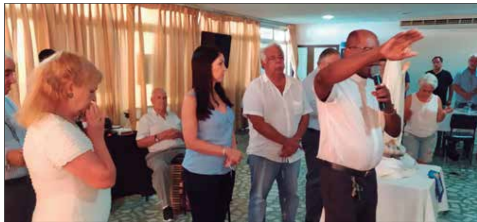
Momento quando o Padre abençoava a todos os presentes