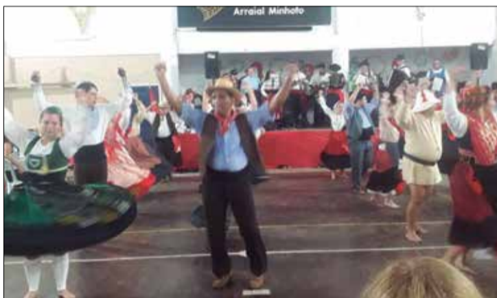
R.F Serões das Aldeias blindou o público presente no Arraial Minhoto com uma linda apresentação parabéns rapaziada