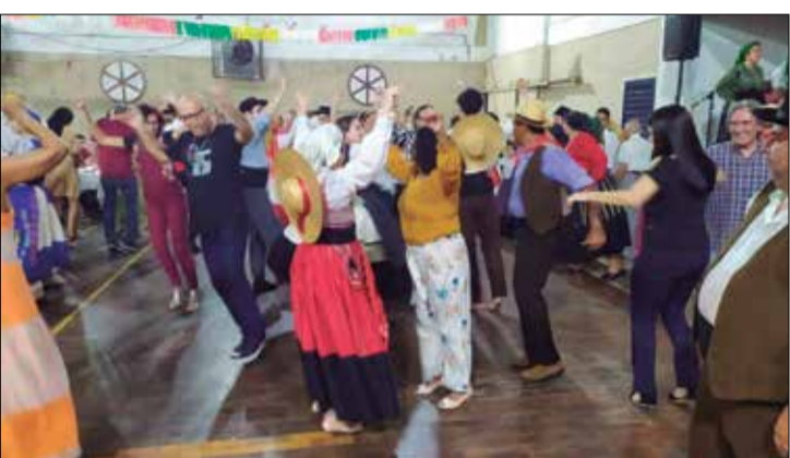
Panorâmica do Arraial Minhoto no Sabado Passado

A Quinta de Santoinho, o tradicional Arraial Minhoto que se realiza, em todos os primeiros sábados do mês, foi, mais uma vez, só alegria; e, no último dia 2, a Casa do Minho soube oferecer e receber os associados, como já é tradicional. Que bom foi saborear as sardinhas portuguesas assadas na brasa, divinas, de dar água na boca, e