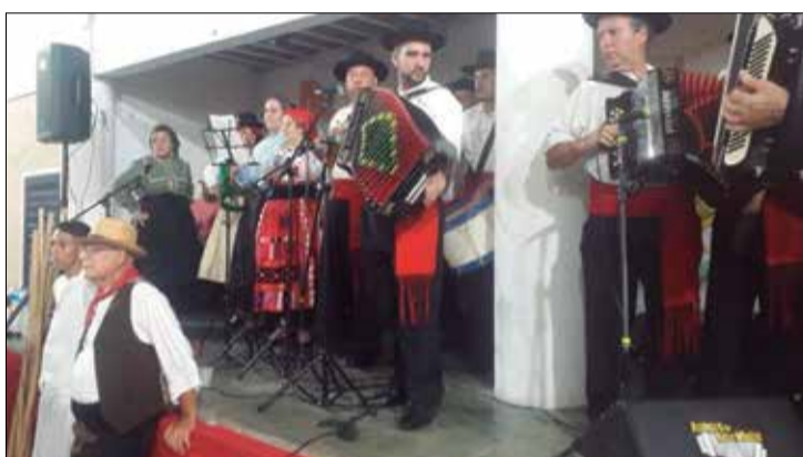
A Tocata do Rancho Maria da Fonte é uma atração à parte

belo espetáculo especial deixando o público maravilhado, o Presidente G.F Serões das Aldeias Juvenil da casa do Minho lindamente trajados e suas músicas tradicionais que nos fizeram marcar o ritmo com o pé.