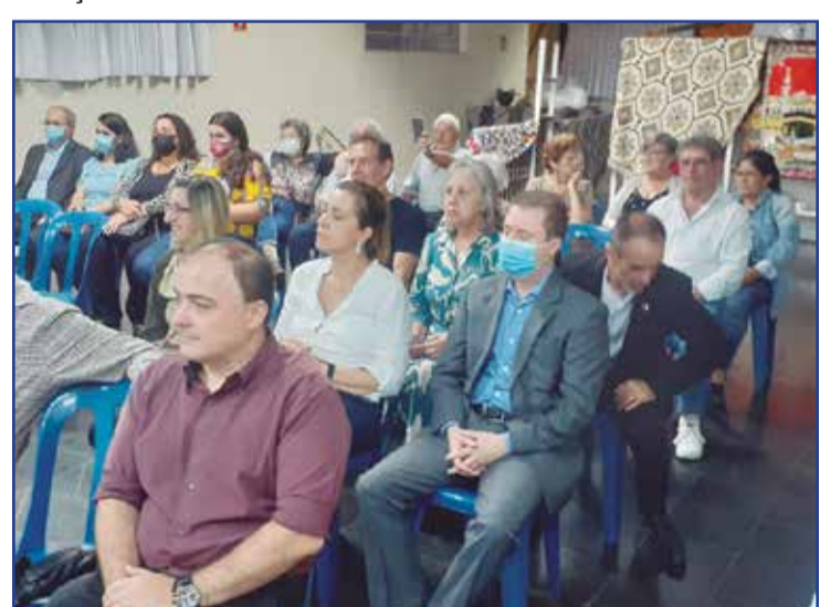
Detalhe dos muitos presentes.