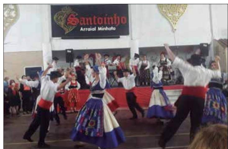
Que show deu o R.F. Infanto Juvenil da Casa do Minho

o caldo verde soltando fumaça com seu cheirinho peculiar, tudo acompanhado pelo bom vinho português. Feliz estavam, os diretores com o clube lotado. As atrações foram incríveis: o conjunto Amigos do Alto Minho veio comandar a animação dos casais rodopiantes do salão, com belas canções do Minho e suas tradições. Aconteceu outro