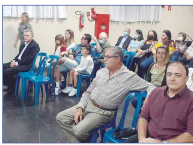
Flagrante dos presentes.