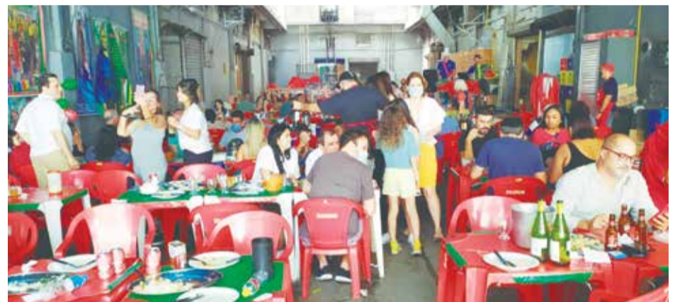
Panorâmica da Aldeia Portuguesa no Cantinho das Concertinas ponto de encontro da família Luso-brasileira