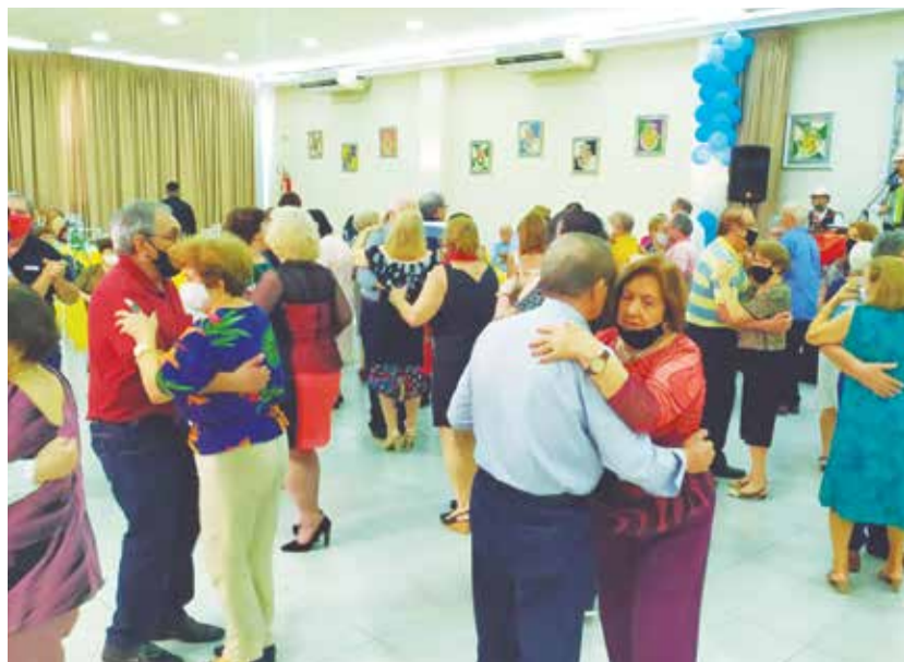
Panorâmica do salão social transmuntano como nos velhos tempos com seus "pés de valsa" ao som do Cláudio Santos