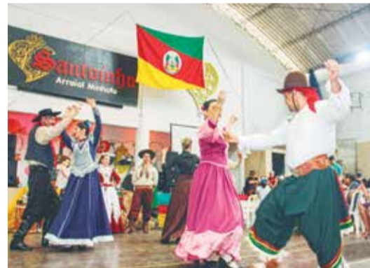
Quem também brilhou na semana Farroupilha foi o Rancho Gaúcho da Casa do Minho