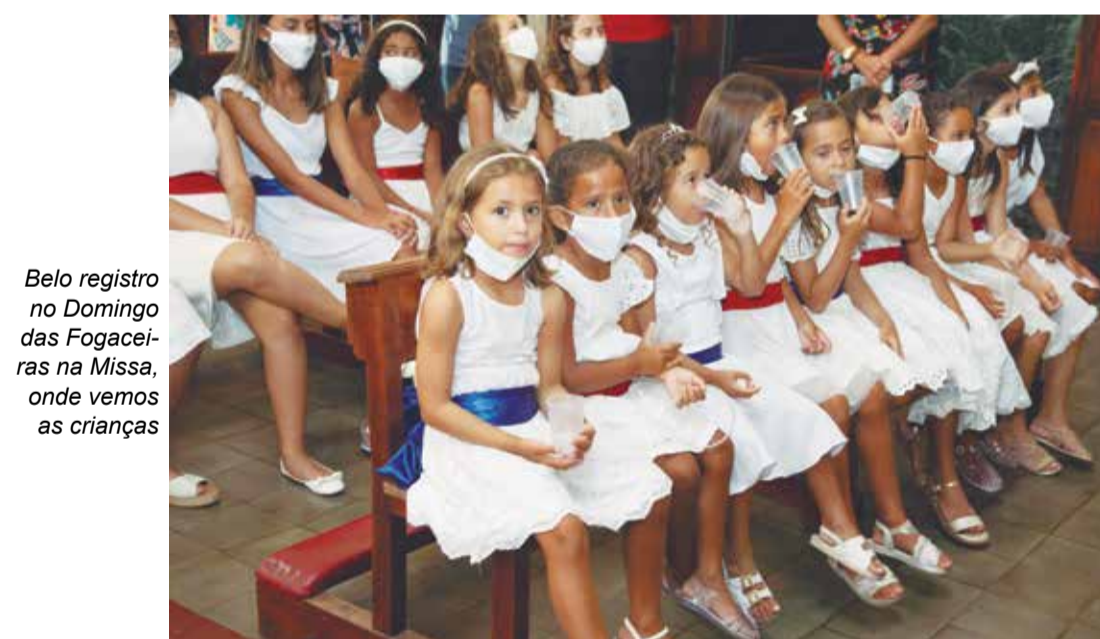
Belo registro no Domingo das Fogaceiras na Missa, onde vemos as crianças

A Festa das Fogaceiras é uma tradição que se cumpre há mais de 500 anos em Santa Maria da Feira (Portugal). Tem origem num voto ao mártir São Sebastião, feito em 1505, quando as terras de Santa Maria foram assoladas por um surto de peste e o povo prometeu que, em troca de cura, ofereceria ao santo, todos os anos, o pão doce chamado "Fogaça".