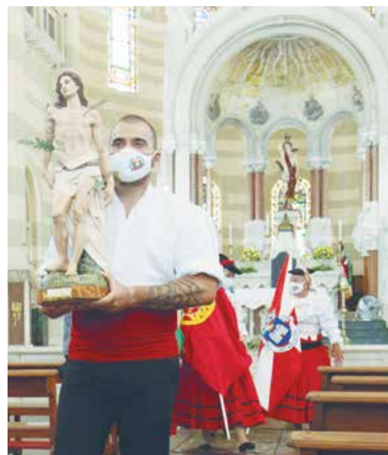
Que imagem maravilhosa do Padroeiro da Casa da Vila da Feira, São Sebastião, no interior da Igreja sendo conduzida pelo componente do Rancho Almeida Garrett

Devido às restrições impostas pela peste dos tempos atuais, o voto foi cumprido pela Casa da Vila Feira apenas com celebração religiosa, de forma reduzida, mas com muita fé e devoção.