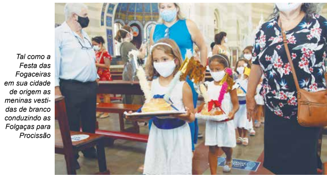
Tal como a Festa das Fogaceiras em sua cidade de origem as meninas vestidas de branco conduzindo as Fogaças para Procissão