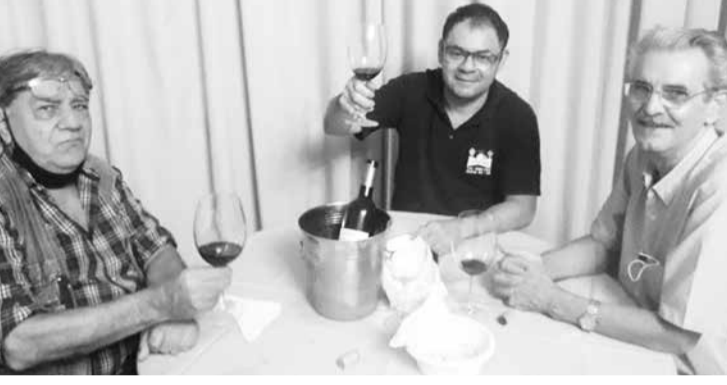
Foi um verdadeiro show a última Quinta Transmontana saboreando vinho português

vinhos portugueses e aquela cervejinha bem gelada, muito papo informal e descontraído entre amigos. Vem você também desfrutar deste ponto de encontro entre amigos.