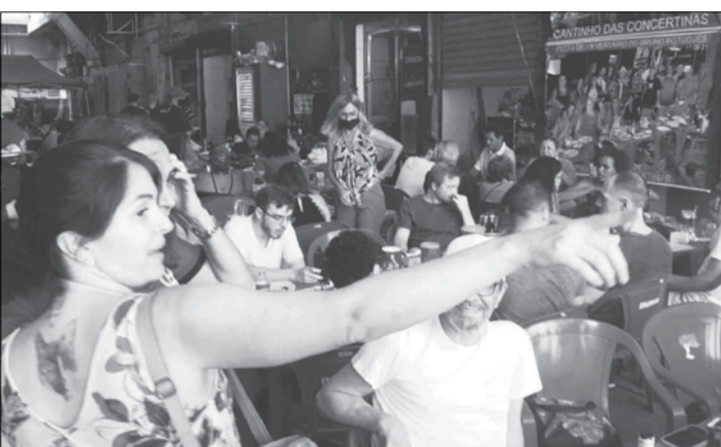
Panorâmica do sábado passado da Aldeia Portuguesa do Cadeg, sempre de Casa cheia recebendo seus amigos e clientes