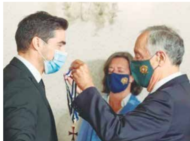
Abel Ferreira é condecorado pelo Presidente de Portugal

Treinador recebeu das mãos de Marcelo Rebelo de Sousa a “Ordem do Infante D. Henrique”