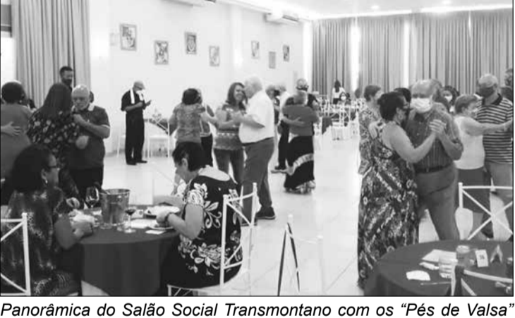
Panorâmica do Salão Social Transmontano com os "Pés de Valsa" mandando ver na pista de dança

descontração ao som do Conjunto Típico das Beira, colocando musica boa pra dançar não faltando os tradicionais parabéns diante do bolo comemorativo.