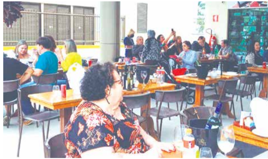
Outro Aspecto no sábado passado na Loja Arte dos Vinhos, no Recreio, recebendo um excelente número de amigos que receberam atenção especial do anfitrião Diretor Presidente da Arte dos Vinhos "nosso querido Ceará"