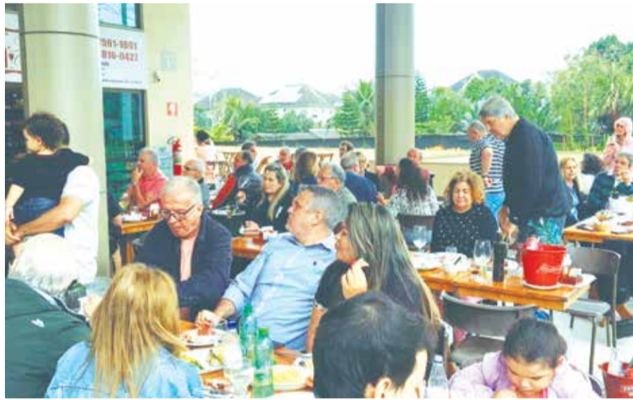
Panorâmica do sábado passado a Loja Arte dos Vinhos, onde Conjunto Amigos do Alto Minho, colocou todo mundo para dançar foi um pedaço de tarde maravilhoso

Rua Profª Luíza Nogueira Gonçalves, 350 Loja 114/115 (Próximo ao Prezunic, na saída Av. Salvador Allende)