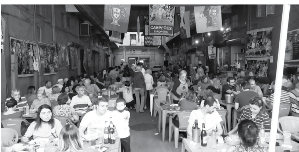
Panorâmica da Aldeia Portuguesa do Cadeg com Casa cheia