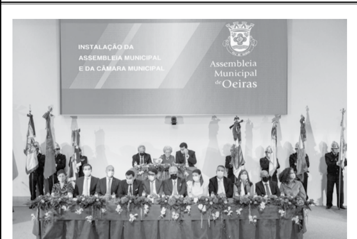
Os Órgãos Municipais eleitos em Oeiras para o mandato 2021-2025 tomaram hoje posse, numa cerimônia que decorreu no auditório do Taguspark, em Porto Salvo