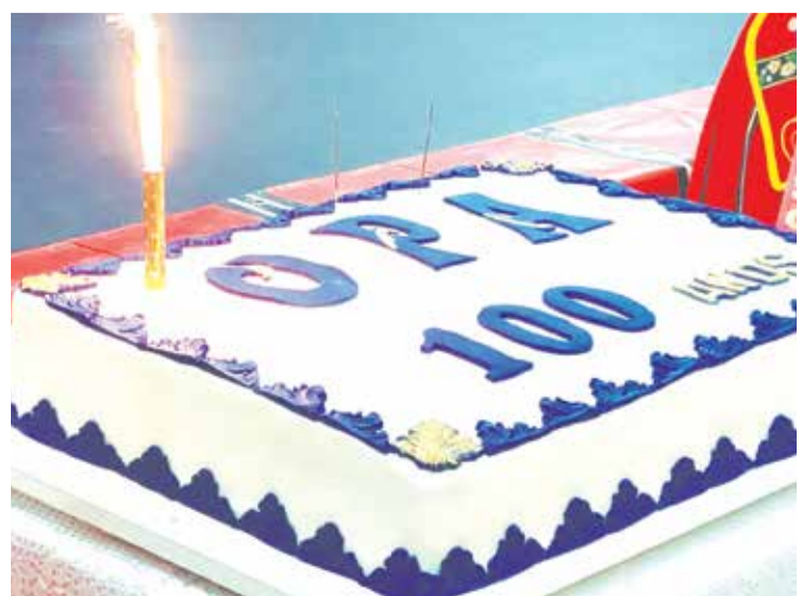
O lindo bolo Comemorativo ao centenário da Obra Portuguesa de Assistência