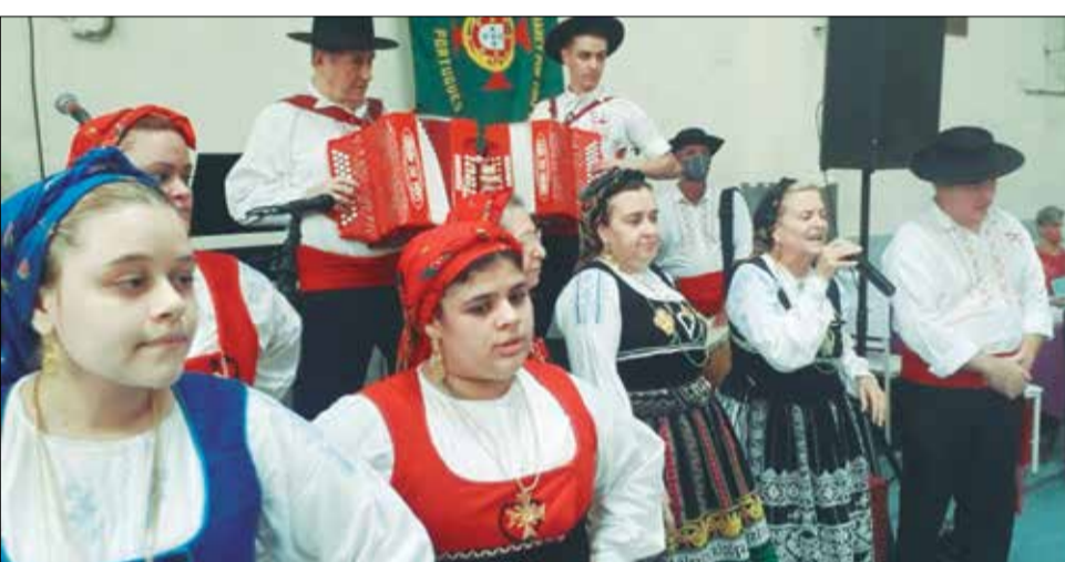
A Tocata sempre é uma atração aparte com seus cantores

Depois o presidente reuniu toda diretoria e apresentou a surpresa a diretoria e aos amigos que foram prestigiar estes momentos super emocionante, enfim pediu para acenderem as luzes e inaugurou a nova iluminação da quadra aonde são realizadas as Festas da Casa. Ainda faltava mais uma atração especial a presença do Grupo Folclórico Infanto Juvenil da Casa do Minho. Que deram um belíssimo show deixando o ambiente ainda mas agradável.