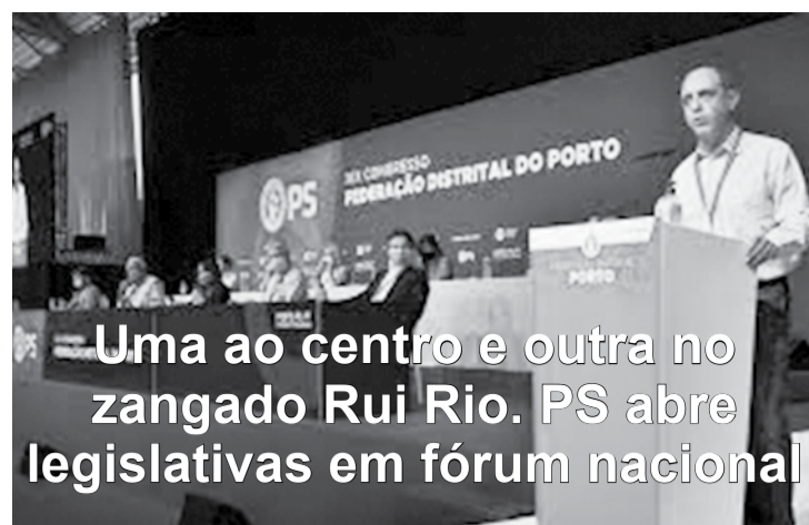
Uma ao centro e outra no zangado Rui Rio. PS abre legislativas em fórum nacional

O XXV Congresso da ANMP realizou-se no Parque de Exposições e Feiras de Aveiro, com a participação de praticamente todos os 308 municípios portugueses.