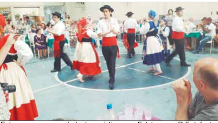
Estávamos com saudade de assistir nosso Folclore e o R.F. Infanto-Juvenil da Casa do Minho, brilhou no Almoço do Orfeão Português, que apresentação. Parabéns a esses componentes