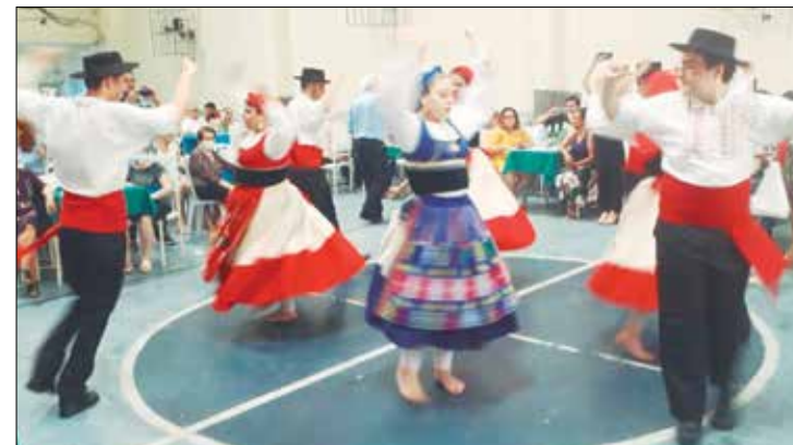
Foi um verdadeiro espetáculo do R.F. Juvenil, arrebatando o coração do público presente