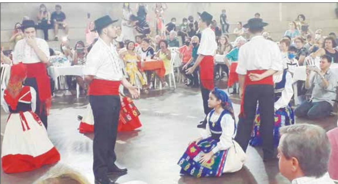
O Rancho Minhoto fez uma exibição de gala empolgando o público presente no Arraial