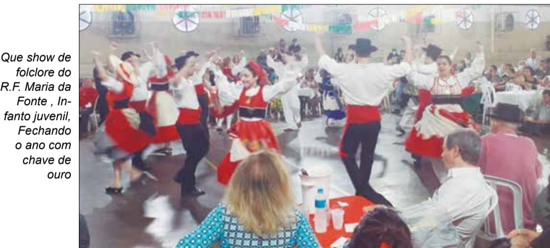
Que show de folclore da R.F. Maria da Fonte, Infante Juvenil, Fechando o ano com chave de ouro

conta do ambiente. Com a exibição no sábado do Rancho Minhoto, como podemos ver, o que não falta à Quinta de Santoinho é muito calor das nossas tradições!. Foi sucesso total a última do ano.