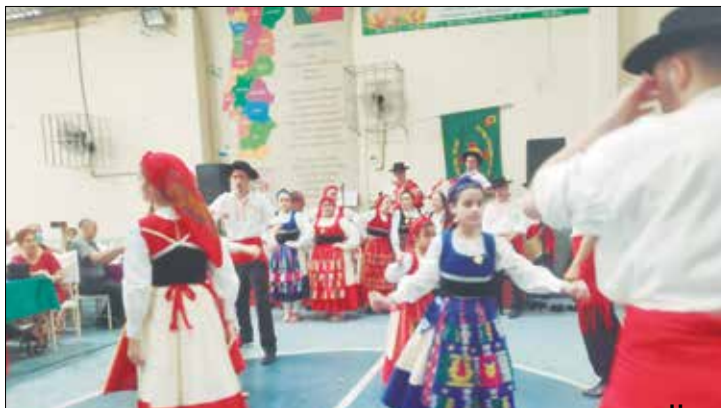
Que show que as crianças do Rancho Folclórico Infanto Juvenil foi lindo nota 10