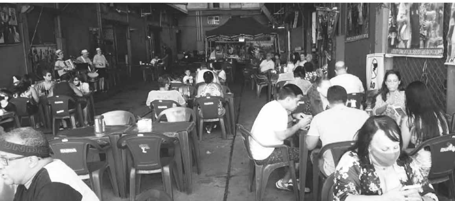
Panorâmica do sábado passado na Aldeia Portuguesa no Cadeg, no Cantinho das Concertinas