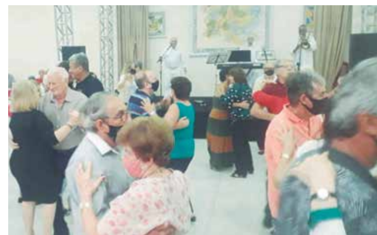
Panorâmica do Salão Social da Casa de Trás-os-Montes com o Conjunto Típicos da Beiras Show agitando os "pés de valsa"

D omingo maravilhoso na Casa de Trás-os-Montes com a presença em peso da Comunidade Portuguesa. Que aos poucos com todo cuidado vai voltando a sua normalidade um dia perfeito, com a Casa oferecendo um cardápio de excelência, vinhos portugueses das melhores procedências de Portugal, animação musical ficou a cargo do Conjunto Típicos das Beira, colocando todo mundo prá dançar, que bom ver as nossas Casa voltando a normalidade