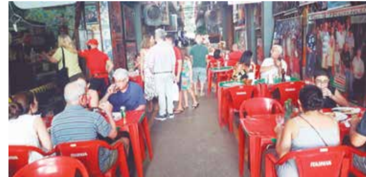
Panorâmica dos amigos que prestigiam a gastronomia do Restaurante Cantinho das Concertinas