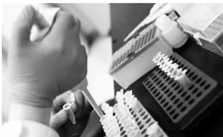
Organismo comunitário tem até 2027 uma verba prevista de dez mil milhões de euros para apoiar projetos inovadores

“Lançamos hoje os primeiros apelos a apresentação de projetos 1500 milhões de euros para 2021, a maior parte desta verba será canalizada para ajudar diretamente pequenas e médias empresas (PME) e start ups, pelo menos metade do financiamento irá apoiar o Pacto Ecológico Europeu, as tecnologias digitais e inovação na área da saúde”, disse a líder do executivo europeu, na cerimônia online de lançamento do CEI.