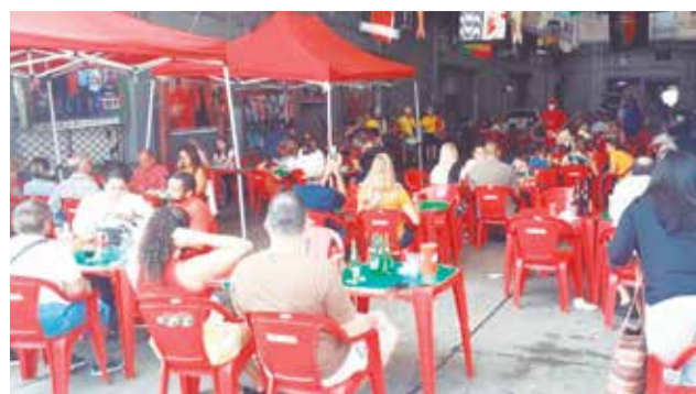
Panorâmica do sábado no Cantinho das Concertinas

Com música ao vivo no Cantinho das Concertina, é muito bom poder vermos a alegria de todos em extravasar toda felicidade, com os amigos dando um show na pista de dança da Aldeia Portuguesa, Graças a Deus, tudo esta voltando ao normal, mas com muito cuidado em não aglomerar, e muito alcool em gel. Então amigos não percam no próximo sábado a partir de meio dia, a Aldeia Portuguesa no Cadeg.