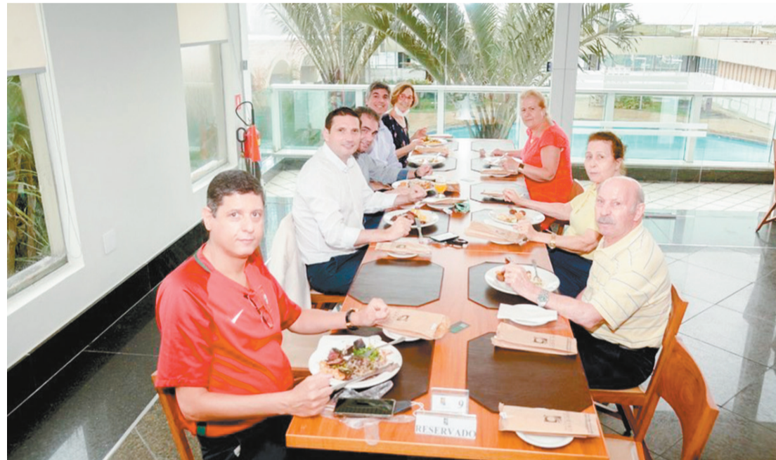
Almoço da diretoria da Associação de Portugueses do Espírito Santo no Hotel Senac - Ilha do Boi