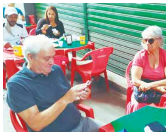
É bom demais vê as famílias Luso-brasileiras curtindo o Bar e Restaurante Cantinho das Concertinas no Cadeg em Benfica

E stá ficando pouco a pouco movimentado o Cantinho das Concertinas, com muita gente boa marcando presença neste Pedacinho de Portugal no Cadeg, sempre oferecendo um cardápio de primeira qualidade e de muito bom gosto. Além dos deliciosos bolinhos de