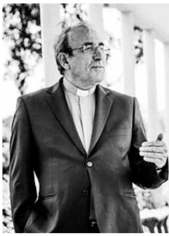
feira, 6 de abril, o bispo de Leiria-Fátima, D. António Marto.

A peregrinação internacional aniversária de maio ao Santuário de Fátima, que normalmente reunia naquele espaço entre 200 a 300 mil pessoas, vai celebrar-se pela primeira vez sem a presença de peregrinos, devido às restrições impostas e aconselháveis de combate à propagação da Covid-19, anunciou esta segunda-