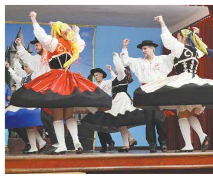
A mágia e o encanto do folclore do G. F. Almeida Garrett