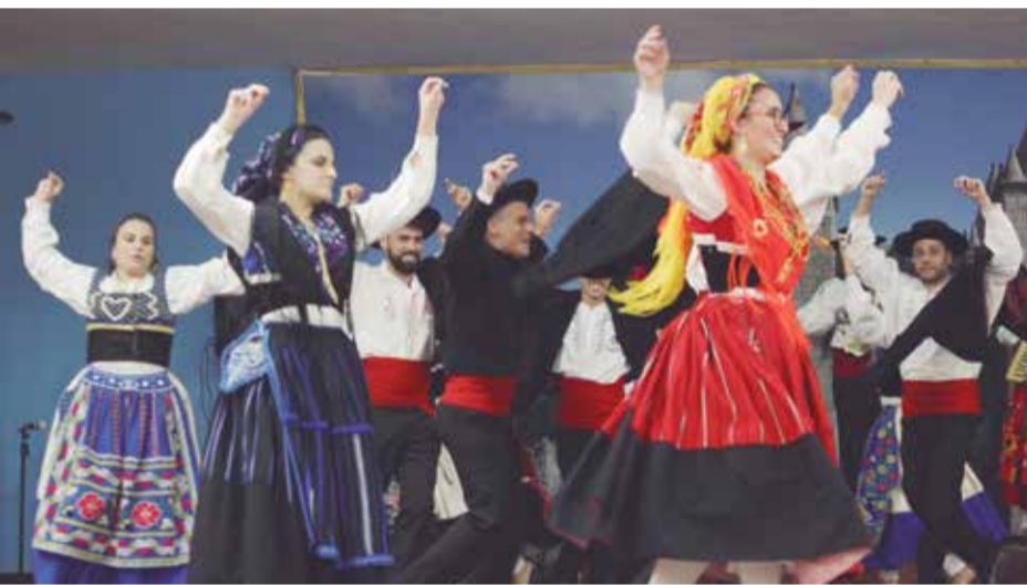
Beleza, elegância e charme, marca registrada dos componentes do G. F. Almeida Garrett nas apresentações