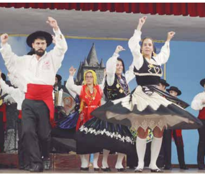
Mais um espetáculo do G. F. Almeida Garrett no arraial Feirense