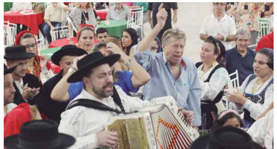
Explosão de alegria da Tocada Feirense, envolvendo a todos os no grande show