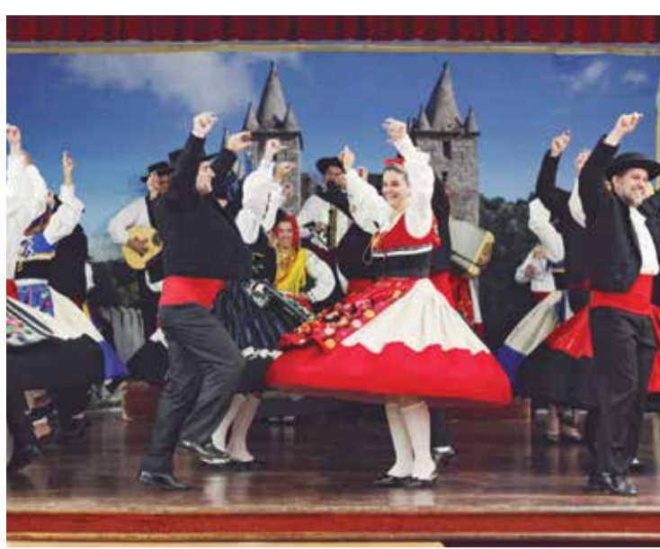
Que festa de folclore no domingo da família feirense