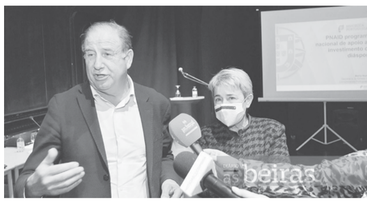
A Secretária de Estado das Comunidades Portuguesas, Berta Nunes, reuniu-se

O Governo vai dar formação aos funcionários dos municípios (muitos deles já a colaborar nos respetivos Gabinetes de Apoio ao Emigrante), para alargarem o seu âmbito de ação ao Programa Nacional de Apoio ao Investimento da Diáspora (PNAID). Trata-se de um esforço de aprofundamento local das relações já estabelecidas com portugueses no estrangeiro, ou que queiram emigrar, agora mais focadas no investimento económico.