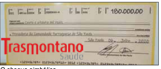
O cheque simbólico.