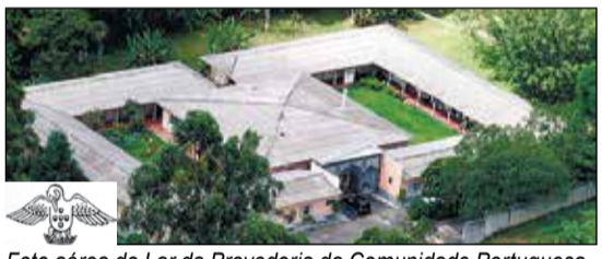
Foto aérea do Lar da Provedoria da Comunidade Portuguesa.