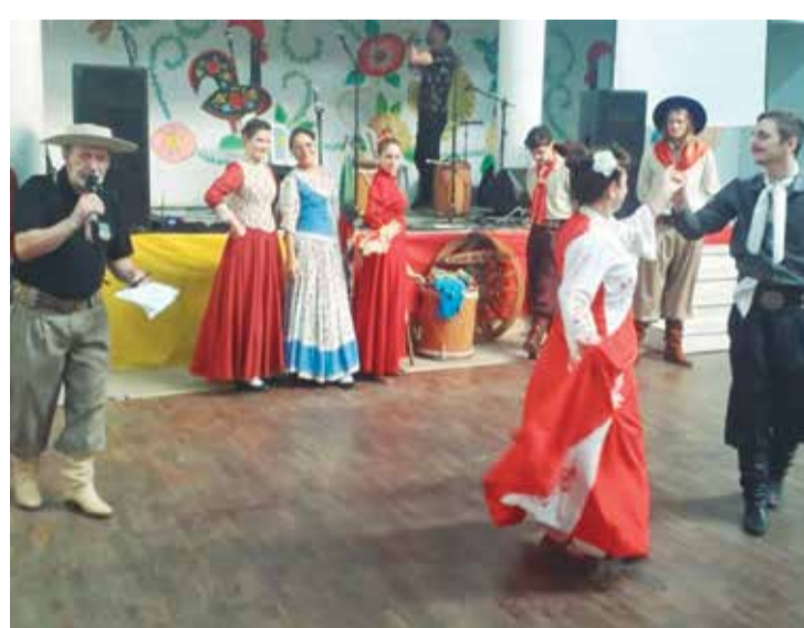
O Charme e a elegância dos componentes Rancho da Casa da Minho