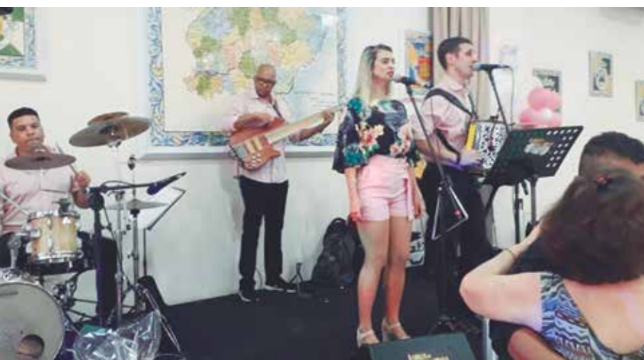
Os pés de valsa dando um showzinho particular, ao som do Conjunto Amigos do Alto Minho, e os aniversariante do dia