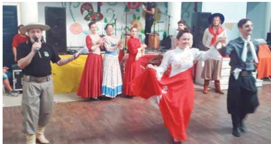
O diretor J. Maciel apresentando o espetáculo Gaúcho