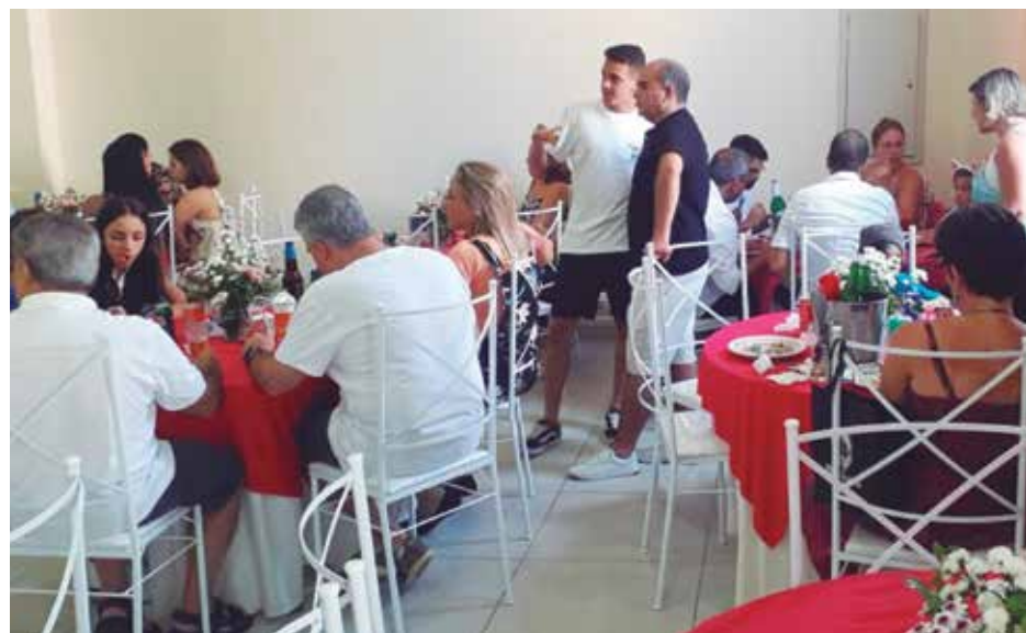
Panorâmica do Domingo na Casa de Trás-os-Montes e Alto Douro com associados e amigos