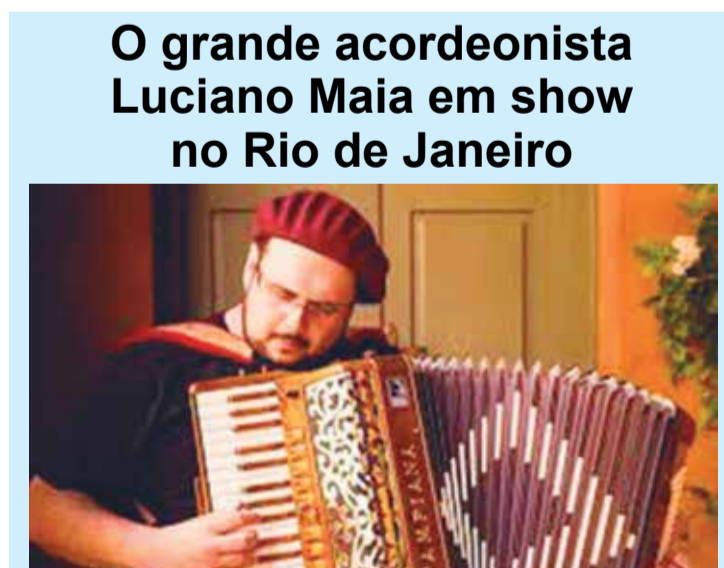
O grande acordeonista Luciano Maia em show no Rio de Janeiro