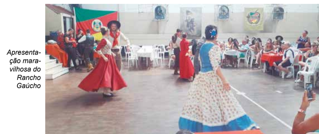
Apresentação maravilhosa do Rancho Gaúcho