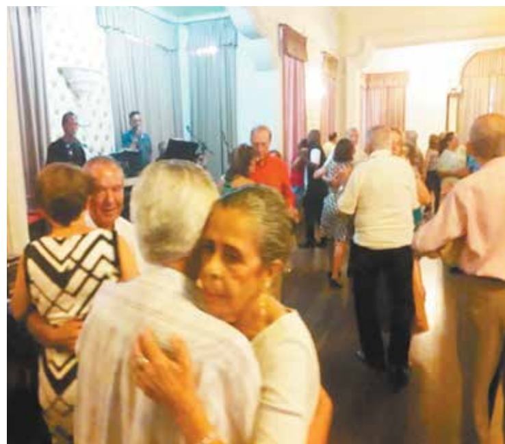
O conjunto Som e Vozes deu mais um show musical no domingo feirense

O outro belo fim de semana no Castelo da Feira, encerrando a estação do verão com grande sucesso apesar da temperatura amena com a chegada do outono mas mesmo assim o clima foi agradável no salão com associados e amigos prestigiando o convívio social que esteve perfeito. a animação do Conjunto Cláudio Santos e Amigos, cada dia melhor, deu o tom musical, neste último domingo de verão.