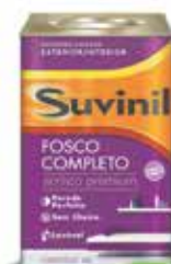
Tinta Acrílica acabamento fosco