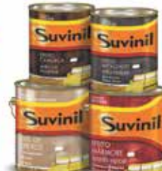
Efeitos Especiais Texturatto Premium especial interior