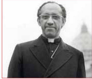
Dom Lucas

São João Del-Rei está incrustada entre a imponente Serra de São José e a encantadora Estrada Real, aberta no século XVII pelos valerosos desbravadores Bandeirantes,