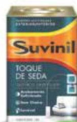
Tinta Acrílica acabamento acetinado