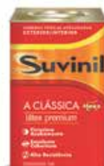
Tinta Látex Premium acabamento fosco acveludado