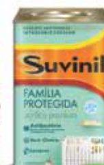
Tinta Acrílica sem cheiro e antibacteriana