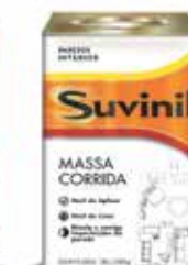
Massa Corrida de fácil aplicação interiores.