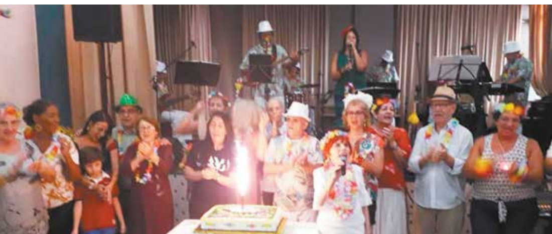
A Diretoria Beirã homenageou os aniversariantes, no Almoço Tropical, onde todos foram acarinhados com um lindo bolo e o parabéns p'ra você