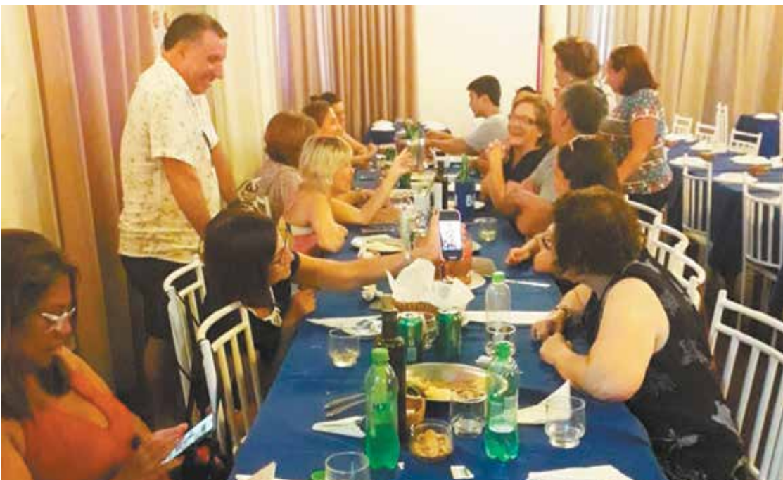
A casa da Vila da Feira finalizou o fim de semana com seu almoço dominical com muita alegria e descontração

O outro belo fim de semana no Castelo da Feira, encerrando a estação do verão com grande sucesso apesar da temperatura amena com a chegada do outono mas mesmo assim o clima foi agradável no salão com associados e amigos prestigiando o convívio social que esteve perfeito. a animação do Conjunto Cláudio Santos e Amigos, cada dia melhor, deu o tom musical, neste último domingo de verão.