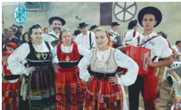
A Tocata do R. F. da Casa do Minho e suas cantadeiras abrilhantou a Quinta de Santoinho no passado sábado