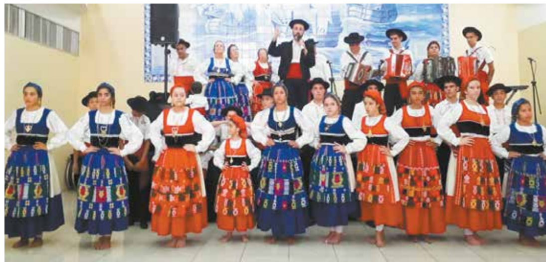
Um dia especial para esses folcloristas do Rancho Juvenil Minhoto