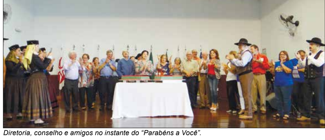
Diretoria, conselho e amigos no instante do "Parabéns a Você".