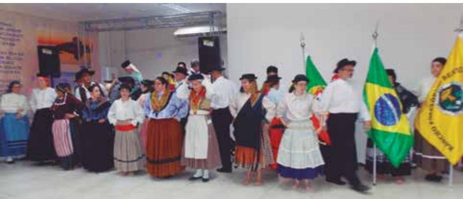
Apresentação de Gala do R.F. Benvinda Maria na Casa de Espinho. Foi uma belíssima tarde onde as tradições do folclore português estiveram bem representadas