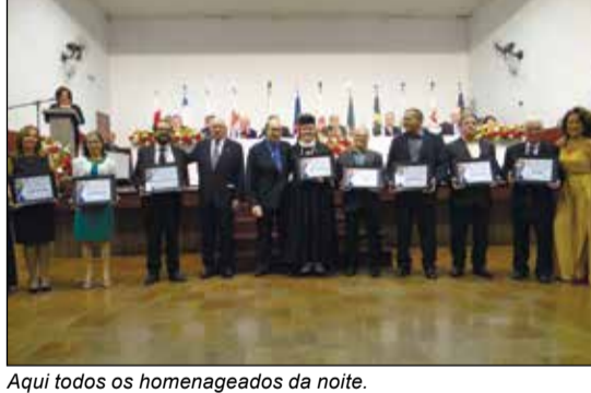
Aqui todos os homenageados da noite.