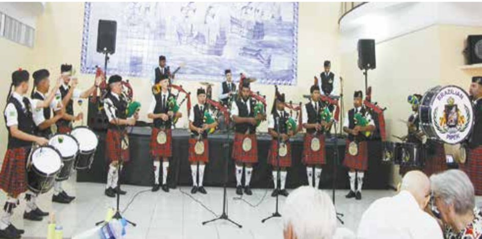
A banda Brazilian Piper, foi uma das atrações da festa