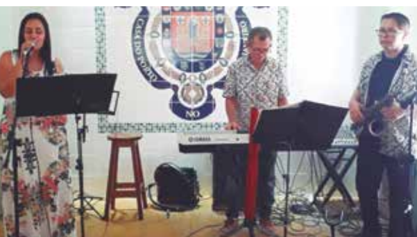
O Trio Josevaldo agitou o domingo em homenagem a Mulher na Casa do Porto