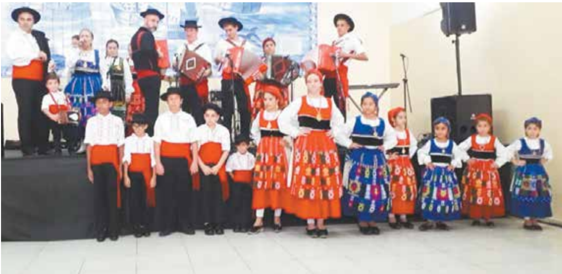
Bonita imagem dos jovens componentes do R.F. Juvenil da Casa do Minho, que festejou 34 anos