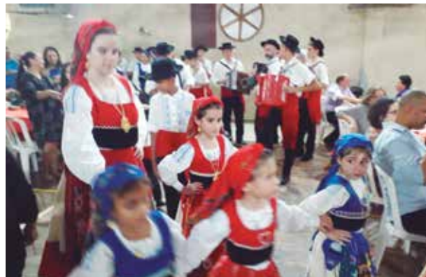
Brilhante participação das crianças do R.F. Juvenil da Casa do Minho, na famosa Quinta de Santoinho