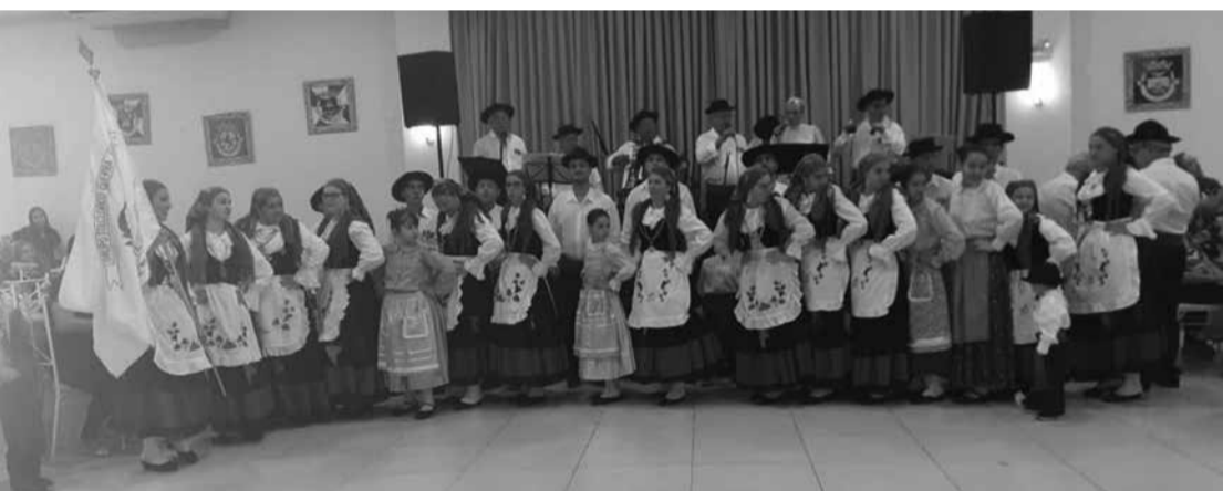
Numa pose para o Portugal em Foco, o G.F. Guerra Junqueiro, representando o folclore das terras transmontanas