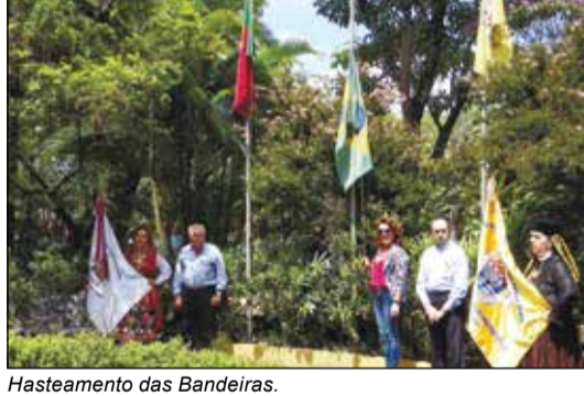
Hasteamento das Bandeiras.