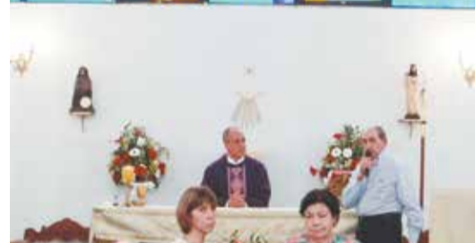
Instante da celebração da santa missa.