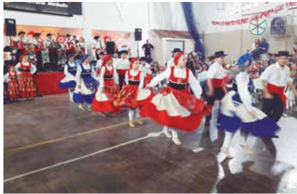
O R.F. Juvenil brilhou no arraial Minhoto no sábado

E, diga-se de passagem, a Quinta de Santoinho é um dos Arraiais mais tradicionais e conhecidos no calendário associativo, bastante frequentado a cada realização e, no sábado, lotou o salão Afonso Henriques.