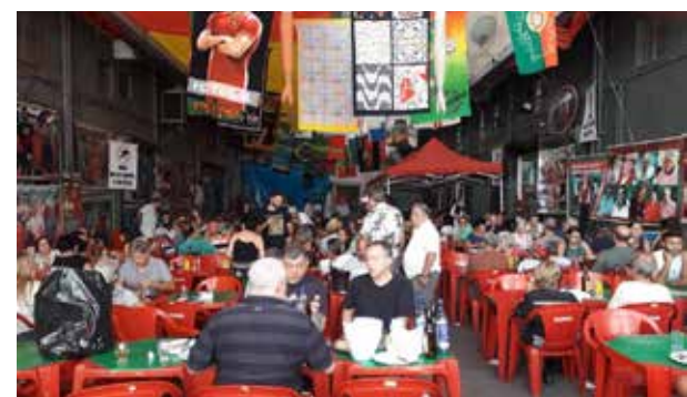
Panorâmica na Aldeia Portuguesa do Cadeg, nosso Cantinho das Concertinas

bem passada, onde todos se divertiram ao som da sensacional Tocata, que tocou o tempo todo. A música não deixou que ninguém ficasse parado, enchendo o recinto de alegria. Os presentes saboreavam a bela sardinha assada, assim como as febras de porco. Com tudo isso não há temperatura