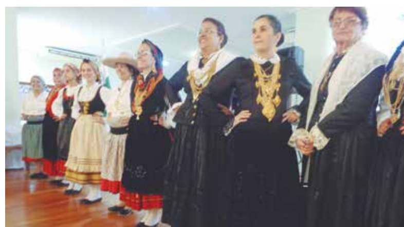
O Grupo Folclórico Armando Leça, foi atração do domingo passado no Solar Portuense, apresentando belíssimos trajes regionais