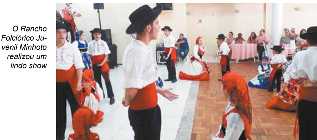
O Rancho Folclórico Juvenil Minhoto realizou um lindo show