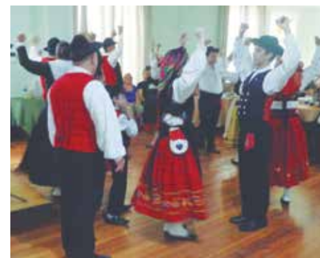
Linda exibição do Rancho Folclórico Armando Leça, na Festa do Dia Internacional da Mulher