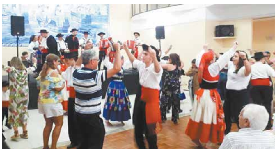
O Tradicional momento do vira-livre com o público interagindo com Rancho Minhoto