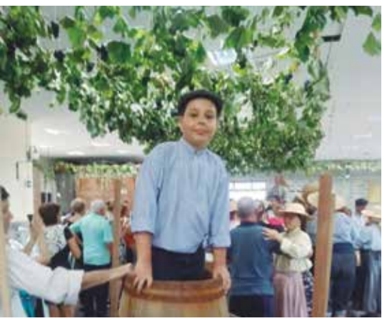
Uma das imagens mais marcantes das Vindimas dos Camponeses onde um menino participa da colheita das uvas