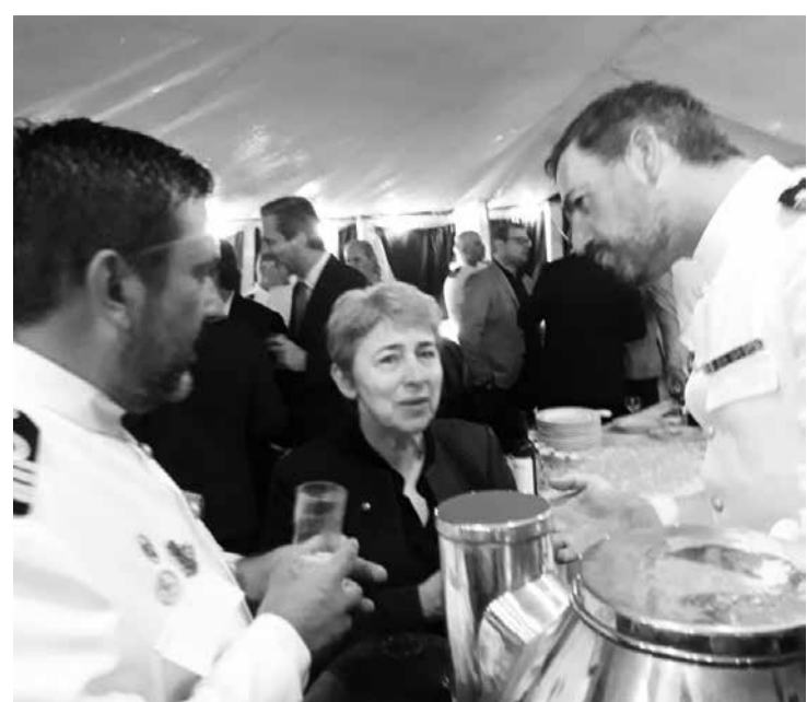
Secretária de Estado das Comunidades Portuguesas Berta Nunes durante o coquetel com os oficiais do Navio Sagres

Em 30 de dezembro, a embarcação da Marinha chega a Portugal, mais precisamente, a Ponta Delgada, nos Açores, estando o regresso a Lisboa agendado para 10 de janeiro de 2021.