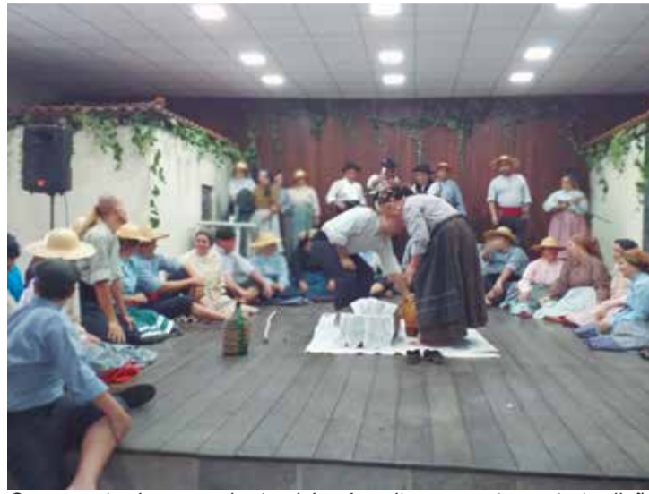
O momento da merenda, também é muito marcante nesta tradição portuguesa e muito bem interpretada pelos componentes do Rancho Folclórico