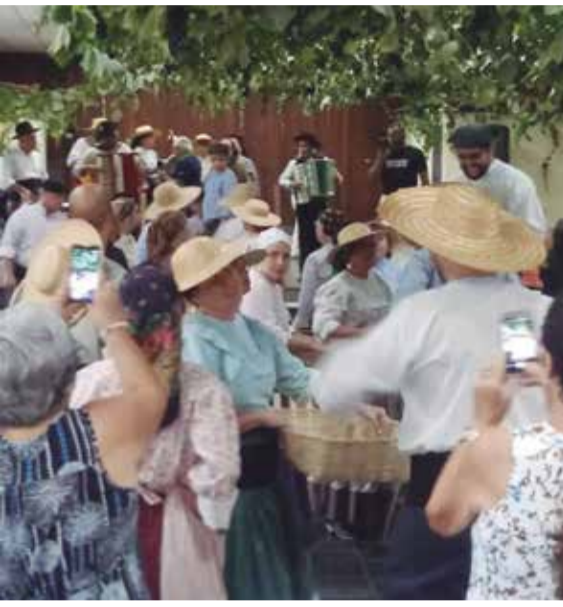
Que linda imagem: O Rancho Camponeses de Portugal, vindimando, exatamente igual em nossas terras, em Portugal