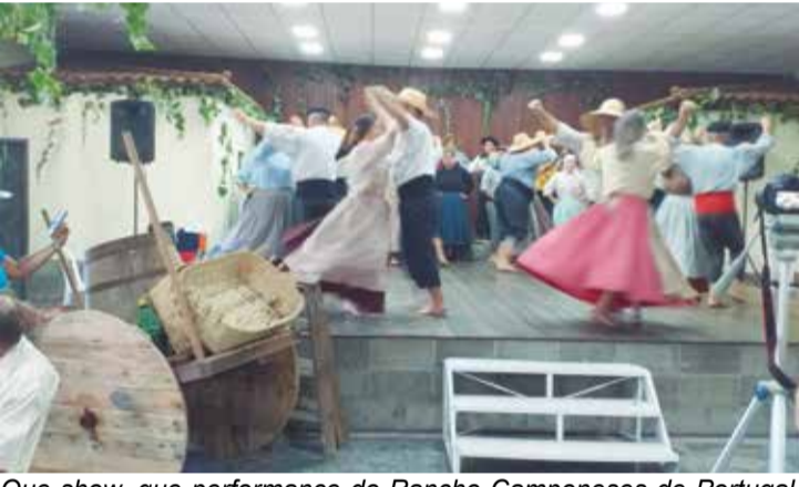
Que show, que performance do Rancho Camponeses de Portugal. Alegria reinou durante esta linda festa regional em Duque de Caxias

Foi um lindo espetáculo, realizado em Duque de Caxias. Está de parabéns a diretoria do Clube Social Camponeses de Portugal pela decoração e organização de toda sua festa, o que deixou todo o público satisfeito. A Vindima, realizada pelo Rancho Folclórico da Casa, foi o ponto alto de todo o espetáculo. Que bom gosto, foi esta festa! Merecendo o aplauso de todos os presentes no Clube Camponeses de Portugal.