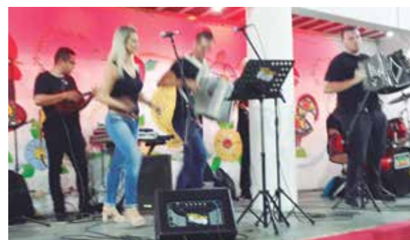
O Conjunto Amigos do Alto Minho abrilhantou o Arraial Minhoto, como sempre arrancando aplausos

da alegria ao som dos Zés Pereiras que brincaram com todos, seguindo as Marchinhas Luminosas.