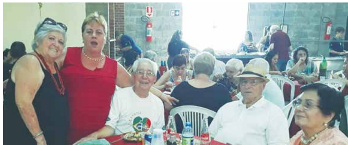
A Presidente dos Camponeses de Portugal, confraternizando-se com seus amigos e convidados, durante esta festa tão Regional