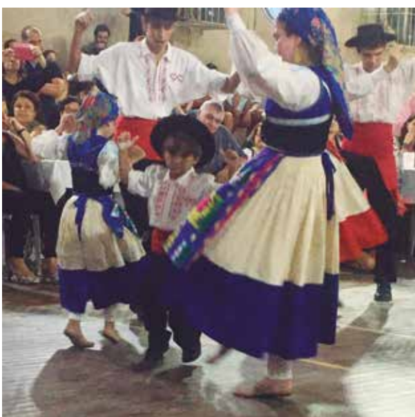
Um show de folclore no Arraial Minhoto, onde vemos os mais “miúdos” já demonstrando o gosto pelo “vira”

Linda imagem dos componentes do Rancho Juvenil na Quinta do Santoinho, durante o show daquela Noite