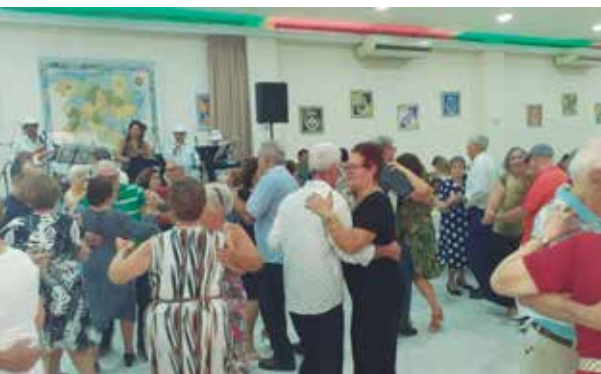
Dando um show no salão, os famosos "pés de valsa" ao som da Banda Típicos da Beira Show, sempre com repertório variado