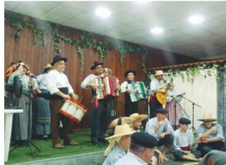
A tocata marcou o ritmo com seus Cantares, que Show! Aliás os Camponeses sempre procuram sempre aprimorar suas festas