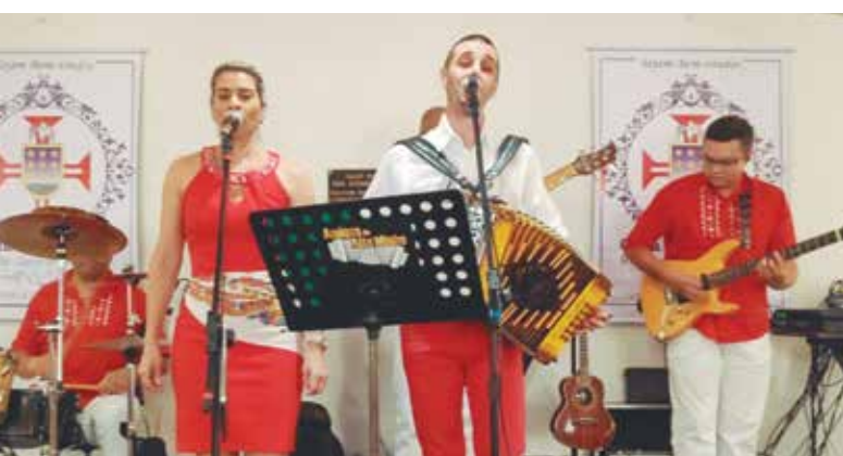
O Conjunto Amigos do Alto Minho, sempre uma atração à parte com muito ritmo

munidade, Amigos do Alto Minho proporcionando um belo show aos sócios e convidados, numa tarde perfeita com muita música boa e alegria. Parabéns a sua dinâmica diretoria.