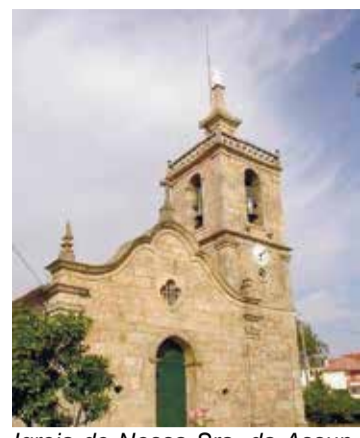
Igreja de Nossa Sra. da Assunção em Pendilhe.