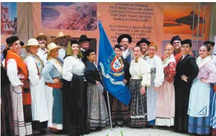
Numa pose especial para esta edição do jornal Portugal em Foco, vemos os componentes do Rancho Folclórico Camponeses de Portugal orgulho da diretoria do Clube Camponeses de Portugal