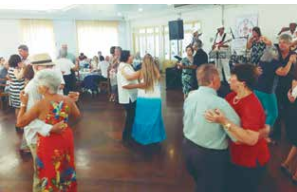
Panorâmica do salão Açoriano, com os famosos pés de valsa