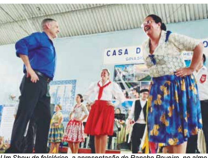
Um Show de folclórico, a apresentação do Rancho Poveiro, no almoço comemorativo aos 90 anos da Casa do Poveiros