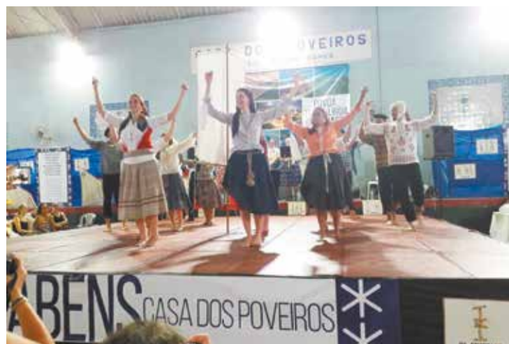
Rancho Folclórico Eça de Queirós da Casa dos Poveiros, abrilhantou a festa de comemoração do 90º aniversário da Casa dos Poveiros

E que aula de Póvoa de Varzim!! Seja na apresenta-