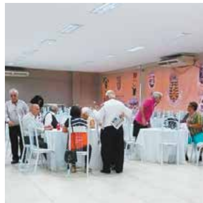
Aspectos do salão social da Casa de Espinho