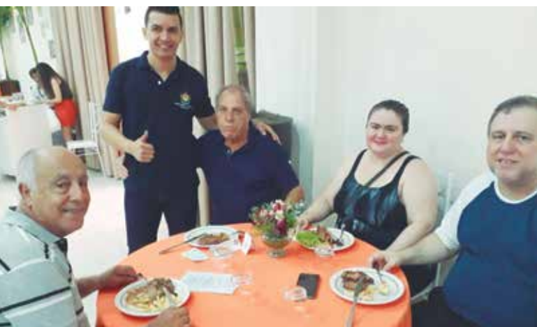
O Junior, num destaque com o amigo, o ex-presidente Antônio Paiva, de mais amigos