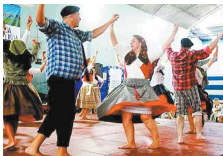
A elegância e o charme, o carisma do Rancho Folclórico Eça de Queirós nas suas apresentações