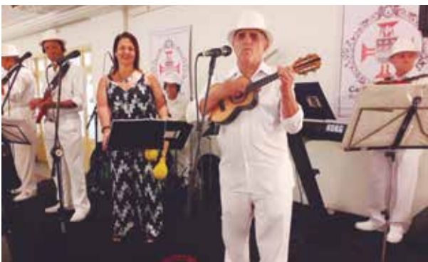
Agitando o domingo Açoriano, a Banda Típicos da Beira Show

Mais um belo domingo no solar Açoriano, com a realização do almoço de Confraternização da família portuguesa que compareceu em um bom número para prestigiar o presidente e sua dinâmica e jovem diretoria, sempre ativa, nas programações da Casa dos Açores. Foi oferecido aos