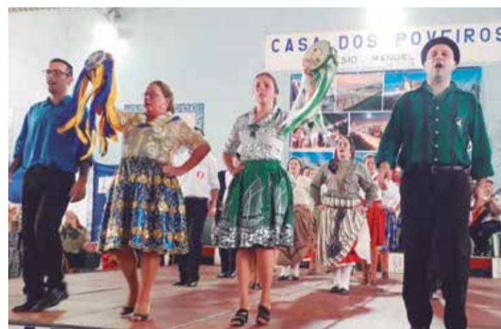
Um verdadeiro espetáculo de folclore do Rancho Poveiro, no domingo passado