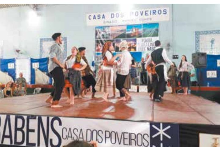
De outro ângulo vemos o show dos componentes do Rancho Folclórico Eça de Queirós da Casa dos Poveiros

ção do Rancho Poveiro como também na exibição do Rancho Eça de Queirós da Casa dos Poveiros, todos mostrando a diversidade existente naquela terra tão pequena, mas que conquista o coração de quem por lá passa. O espetáculo iniciou com o Rancho Poveiro. Em seu primeiro ato estavam vestidos com os trajes de trabalho e de tricanas, fazendo alusão às noites de São Pedro e também homenageando os ranchos de cada bairro da Póvoa de Varzim. Destaque para os Cânticos do coro do rancho e o solo da cantadei-