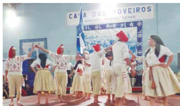
Um verdadeiro espetáculo a apresentação do Rancho Poveiro no domingo festivo

ção do Rancho Poveiro como também na exibição do Rancho Eça de Queirós da Casa dos Poveiros, todos mostrando a diversidade existente naquela terra tão pequena, mas que conquista o coração de quem por lá passa. O espetáculo iniciou com o Rancho Poveiro. Em seu primeiro ato estavam vestidos com os trajes de trabalho e de tricanas, fazendo alusão às noites de São Pedro e também homenageando os ranchos de cada bairro da Póvoa de Varzim. Destaque para os Cânticos do coro do rancho e o solo da cantadei-