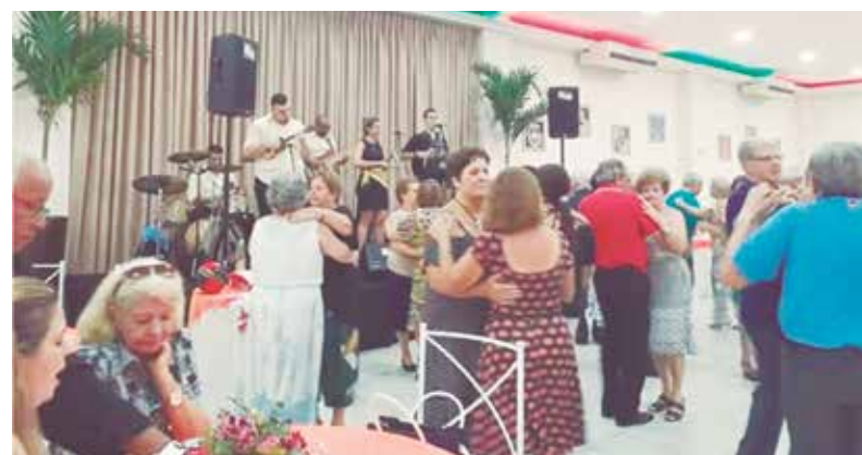
O Conjunto do Alto Minho agitou o domingo Transmontano