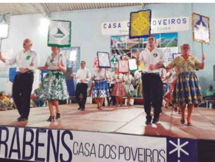
Apresentação magistral do Rancho Poveiro, que veio de Portugal abrilhantar a festa de 90 anos da Casa do Poveiros