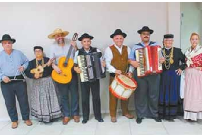
A Tocata do Rancho Folclórico Camponeses de Portugal