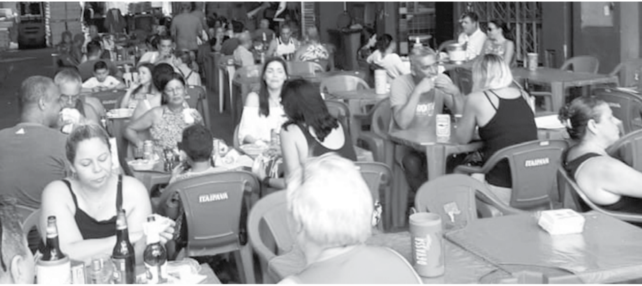
Panorâmica do sábado passada Aldeia Portuguesa do Cadeg no Bar e Restaurante Cantinho das Concertinas

Que final de semana maravilhoso na Aldeia Portuguesa, no restaurante Cantinho das Concertinas, com a comunidade luso-brasileira marcando presença em peso. Tudo perfeito, ambiente agradável, e um show