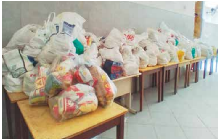
Registro das cestas básicas distribuidas aos amigos, assistidos pela Venerável Irmandade Santo Antônio dos Pobres