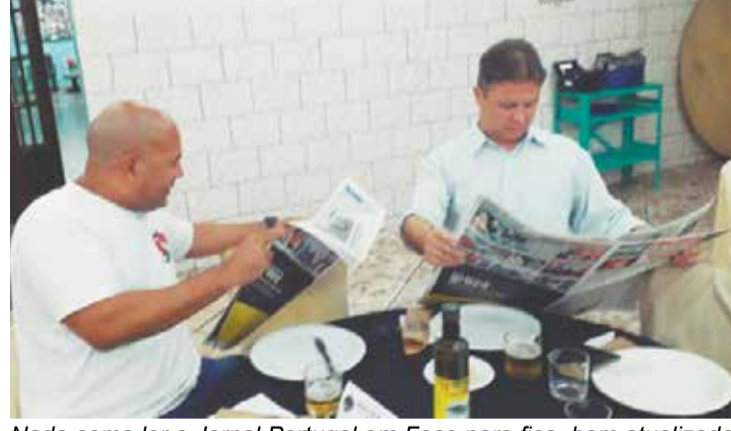
Nada como ler o Jornal Portugal em Foco para ficar bem atualizado com as notícias em Portugal