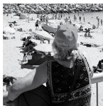
FIGUEIRA DA FOZ

A doença é transmitida por um novo coronavírus detetado no final de dezembro de 2019, em Wuhan, uma cidade do centro da China.