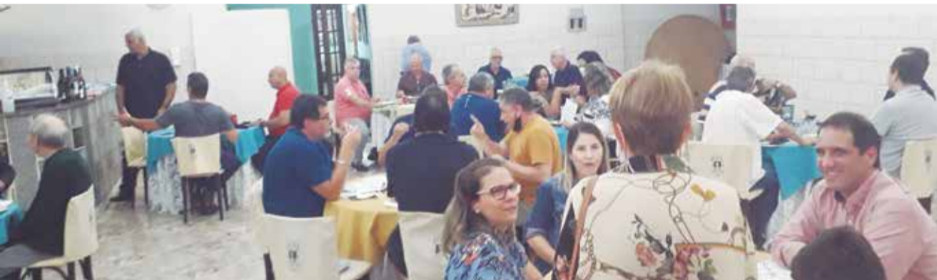
Panorâmica do Almoço das Quartas na Casa das Beiras já recebendo um bom número de amigos