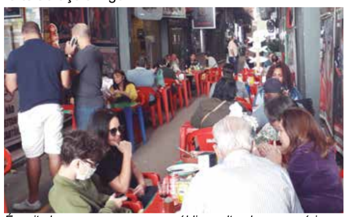
É muito bom ver aos poucos o público voltando ao convívio social na nossa Aldeia Portuguesa do Cadeg no Bar Cantinho das Concertinas, mais com todos os cuidados