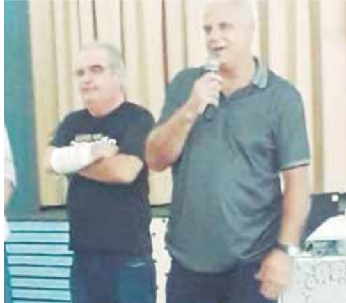
Presidente da Casa das Beiras saudando a família vascaína presente no Almoço das Quartas