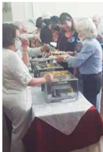
Panorâmica da Bacalhoda Transmontana, no sábado passado