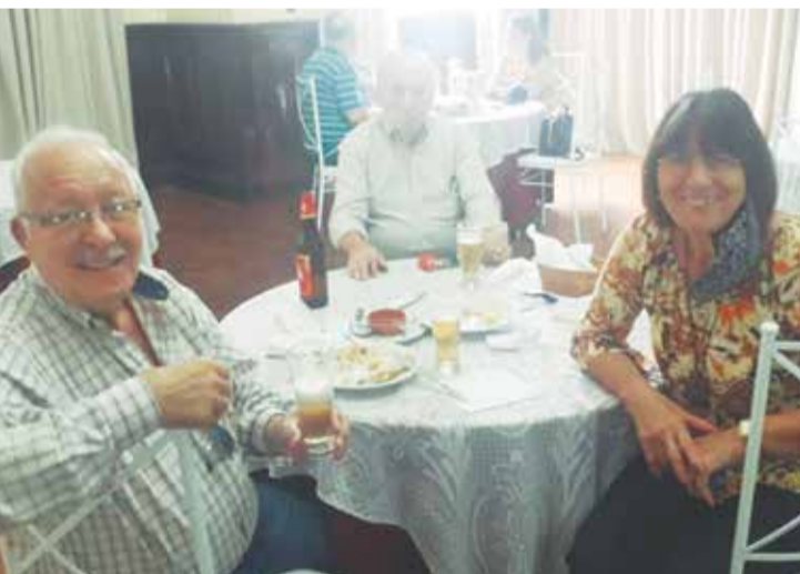
Gente boa e amiga prestigiando o Bacalhau à Transmontano num destaque para o Portugal em Foco na foto vemos.....