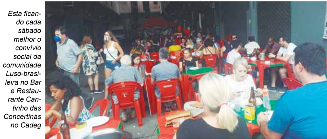
Esta ficando cada sábado melhor o convívio social da comunidade Luso-brasileira no Bar e Restaurante Cantinho das Concertinas no Cadeg