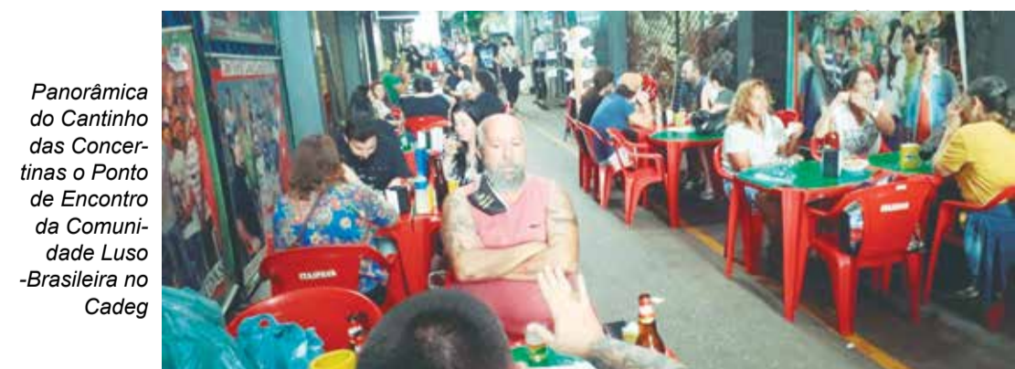
Panorâmica do Cantinho das Concertinas o Ponto de Encontro da Comunidade Luso-Brasileira no Cadeq