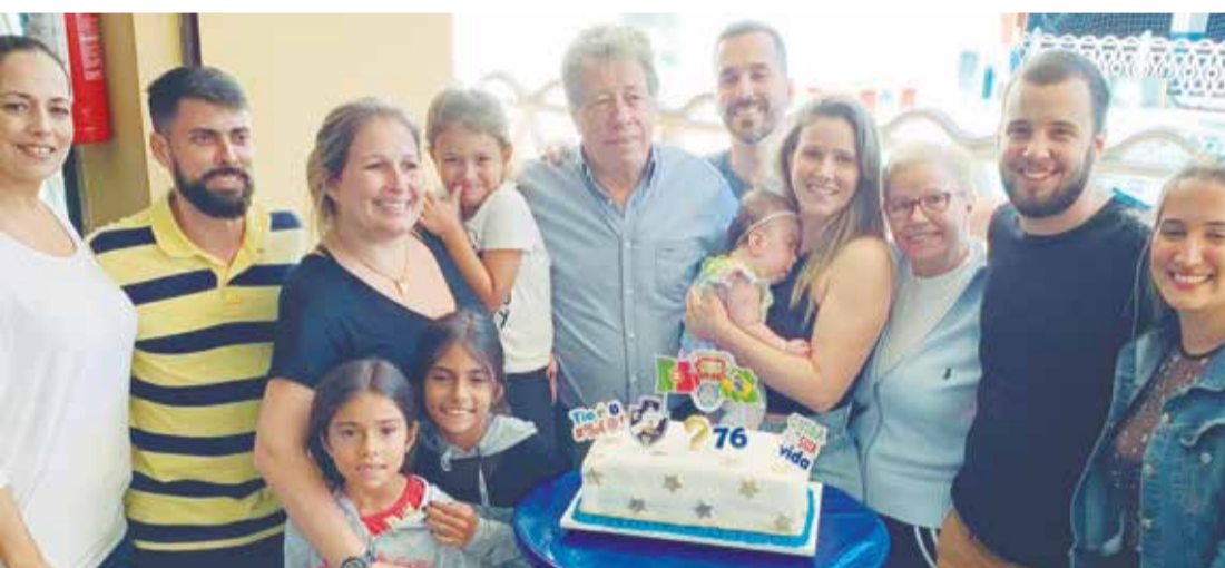
Explosão de alegria do presidente Ernesto Boaventura cercado pela sua família