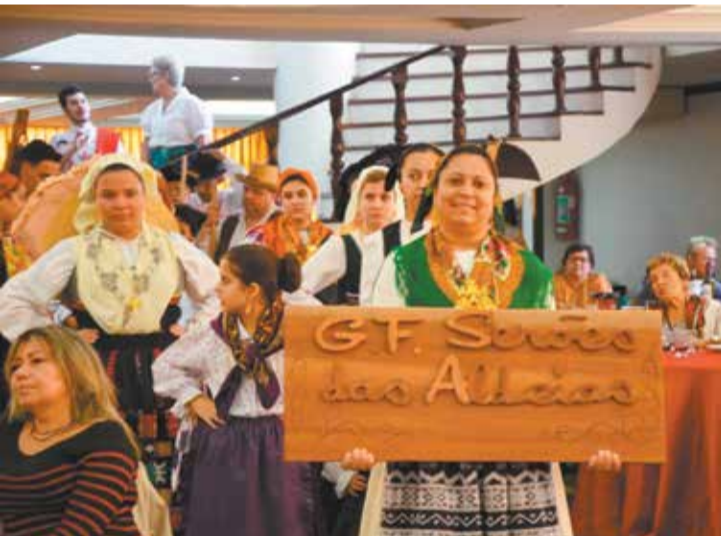
Essa turma tem muito a amor a Portugal e representa as tradições portuguesas. Parabéns ao G.F. Serões das Aldeias