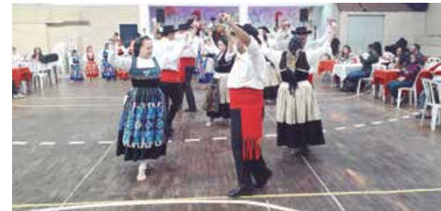
O Rancho Folclórico de Veteranos sempre com sua elegância