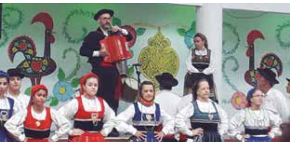
Bonita imagem dos componentes do R.F. Maria da Fonte, com seus belos trajes