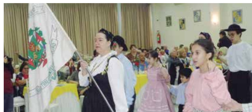
Entrada magistral do G.F. Guerra Junqueiro

verde. Tudo preparado divinamente pelo seu buffet. Um serviço de primeira. O toque musical esteve a cargo dos Amigos do Alto Minho com seus dançarinos agitando o salão transmontano.