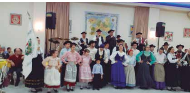
Linda imagem da Tocado com os componentes do Guerra Junqueiro