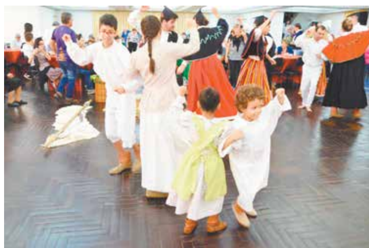
Que show a maravilhosa participação do Rancho Folclórico Típicos Madeirense