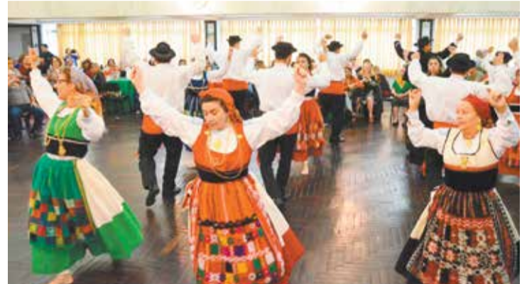
As apresentações do Rancho Folclórico Luis de Camões sempre são marcantes.