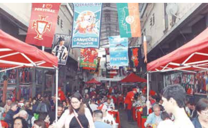
Panorâmica do ponto de encontro totalmente lotado, a famosa Aldeia Portuguesa do Cadeg, no cantinho das Concertinas

a exemplo do bacalhau na brasa, com batata cozida ou cozida ou do cozido a Portuguesa. Bebe-se vinho da terrinha, garrafas das marcas Casal Garcia, Chaminé e Esporão. O calor quase o ano inteiro, no entanto, incentiva o consumo de cerveja. As opções poucas, incluem Brahma e a portuguesa Super Bock. Comes e bebes são atrações em todos os dias de funcionamento, mas a música ao vivo só se ouve aos sábados, com direito a palco montado e bandeiras para enfeitar, entre 13h e 18h30. IMPERDÍVEL.