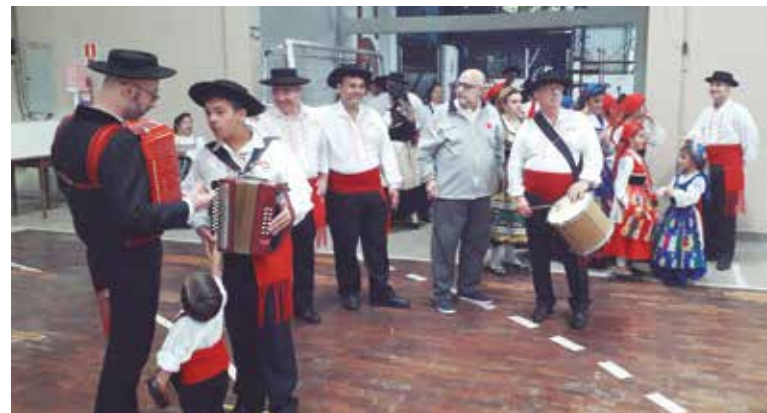
Componentes da Tocata do R.F. Maria da Fonte