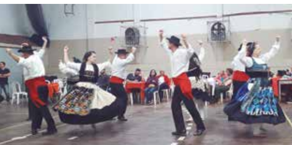
O público atento a mais um belo show de folclore