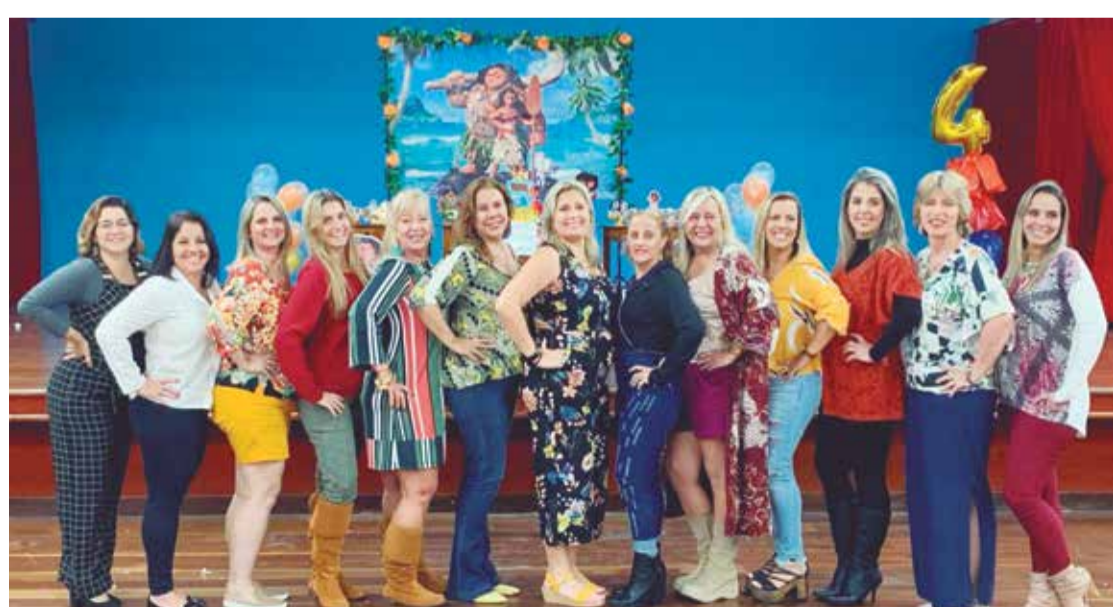
o Charme feminino das Componentes do Grupo Folcórico Almeida Garret