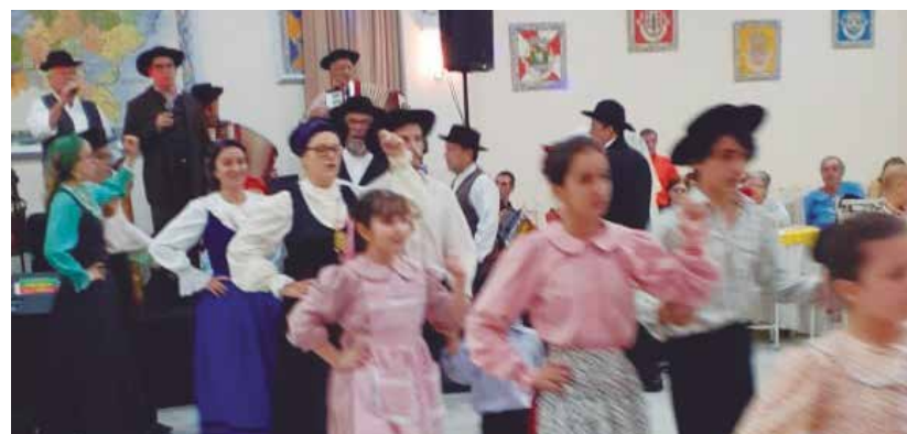
Os jovens são presença marcante no G.F. Guerra Junqueiro