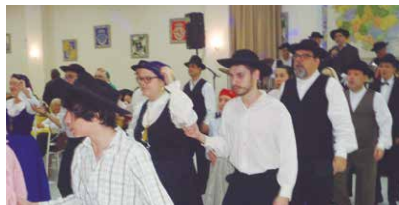
Linda exibição do G.F. Guerra Junqueiro