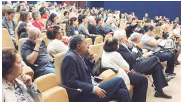
Aspecto da plateia durante a jornada interdisciplinar Holocausto e Direitos Humanos