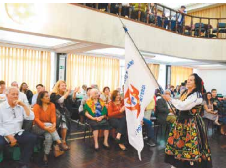
Entrada triunfal no salão do R.F. Luis de Camões. Que elegância!