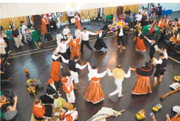
Belíssima apresentação do R.F. Típicos Madeirense de S.P