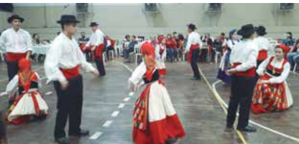
Apresentação magnífica do R.F. Maria da Fonte no domingo