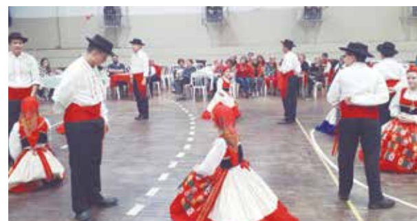
Muito mágico o desempenho do R.F. Maria da Fonte