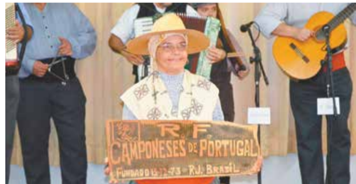
Essa placa é a marca registrada do Rancho Folclórico Camponeses de Portugal