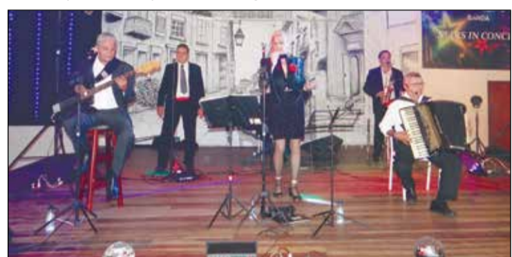
Banda Stars In Concert durante seu show.