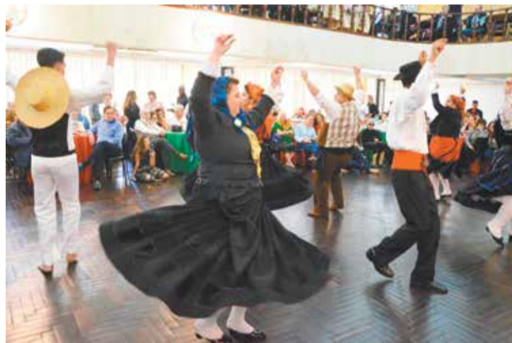
O Grupo Folclórico Serões das Aldeias cada vez melhor sempre empolgando o público