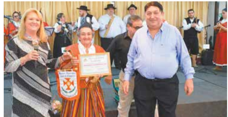
Momento que a 1ª dama Rosa Guedes e o Presidente Fernando Guedes entregavam o certificado de participação no Festival a componente do Rancho Folclórico Típicos Madeirense de São Paulo