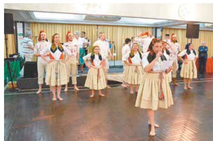
Sempre brilhante as apresentações do Rancho Folclórico Eça de Queiros. Que espetáculo!