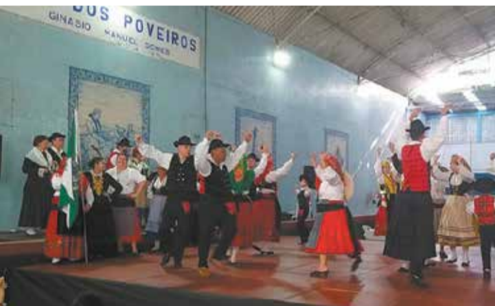
Belíssima apresentação do Grupo Folclórico Armando Leça na Casa dos Poveiros