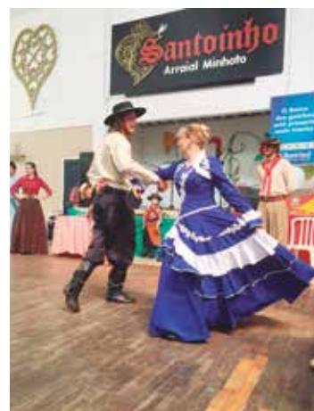
Show apresentação do Rancho Gaúcho na Casa do Minho