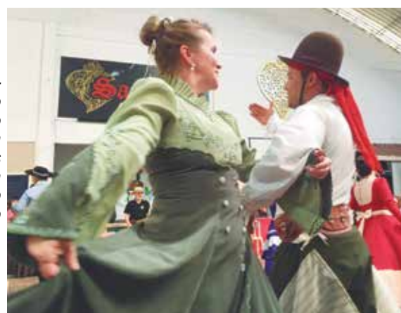
Momento da apresentação do Rancho Gaúcho na festa das crianças na Casa do Minho