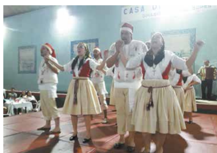
Emoção dos componentes do Rancho Folclórico Eça de Queirós era nitida