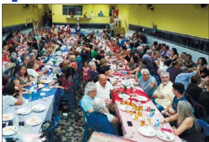
Detalhe do salão lotado de amigos.