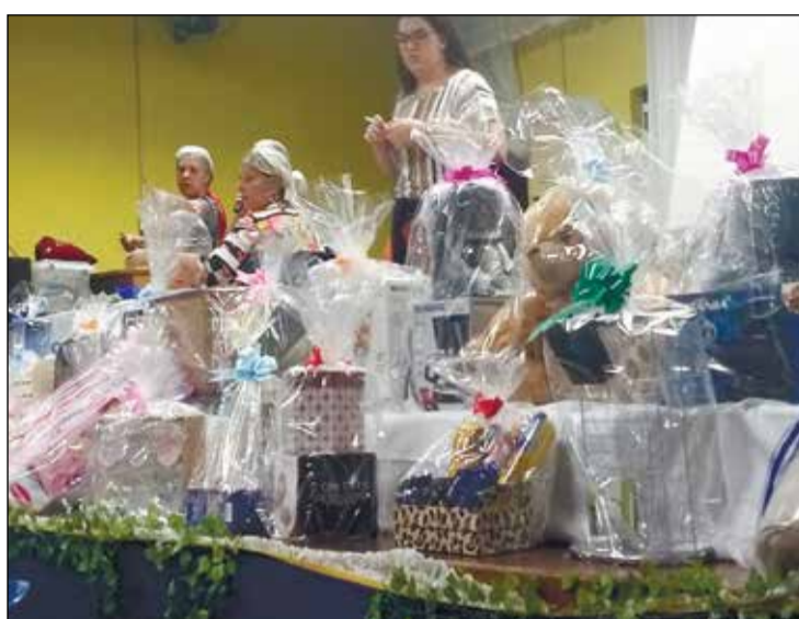
Muitas das prendas sorteadas nesta noite.