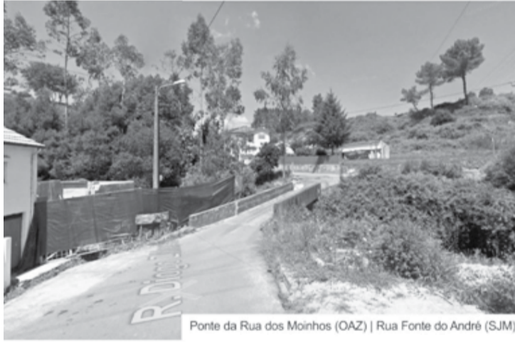
Ponte da Rua dos Moinhos (OAZ) | Rua Fonte do André (SJM)

e sentido de responsabilidade de ambas as autarquias"