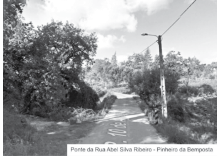
Ponte da Rua Abel Silva Ribeiro - Pinheiro da Bemposta