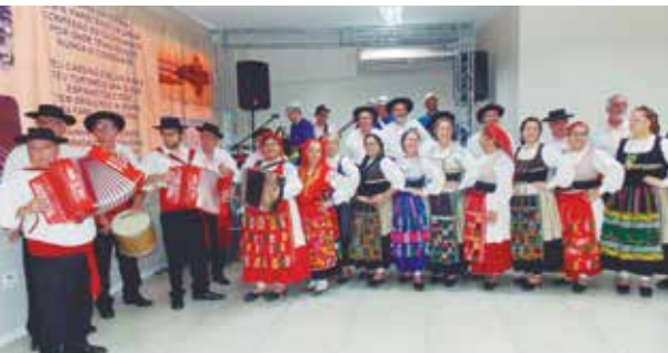
R.F. de Veteranos da Casa do Minho, foi a atração do almoço na Casa de Espinho, onde pode mostrar toda beleza do folclore do norte de Portugal