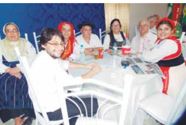
Mesa de componentes do R.F. de Veteranos da Casa do Minho, onde apresentou-se com muita categoria