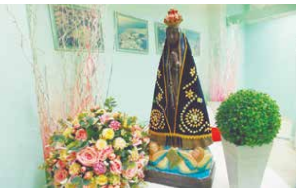
Linda imagem de N.Sra Aparecida, Padroeira do Brasil, foi louvada na Casa de Espinho