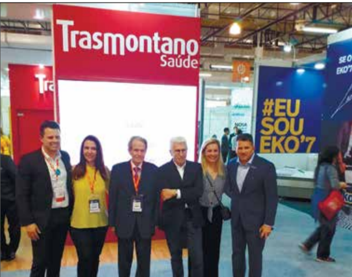
Diretora e amigos no estande do Grupo Trasmontano.

O Trasmontano Saúde, grupo com mais de 87 anos de atuação na área da saúde, participou, entre os dias 29 de setembro a 1º de outubro, do Longevidade Fórum + Expo, evento internacional de produtos, serviços e inovação para a qualidade de vida e bem-estar, que aconteceu no Pavilhão Azul do Expo Center Norte, em São Paulo. Seguindo a temática do evento, o Trasmontano levou interatividade aos seus associados e visitantes, por meio de atividades que testaram as habilidades em três pilares: memória, alimentação