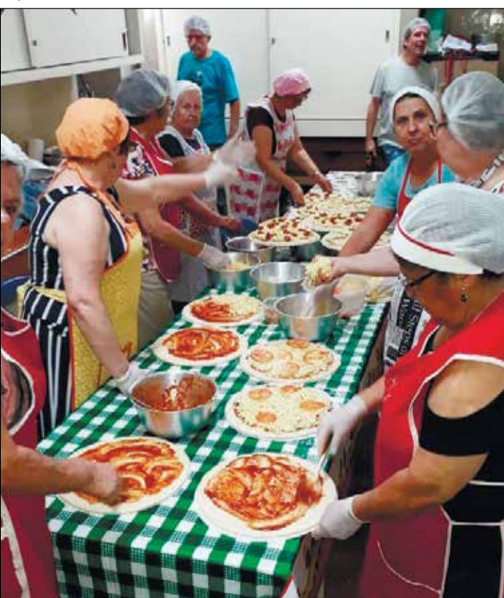
Vemos a equipe da cozinha, trabalhando em prol do sucesso desta noite.