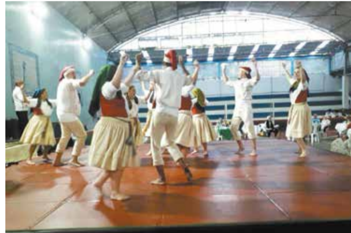
Participação brilhante do Rancho Folclórico Eça de Queirós no seu festival do folclore