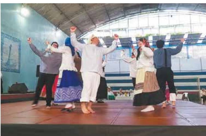
Mais um verdadeiro espetáculo a participação do Grupo Folclórico Padre Tomás Borba no festival