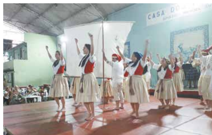
Apresentação magnífica do Rancho Folclórico Eça de Queiroz na dança do barco