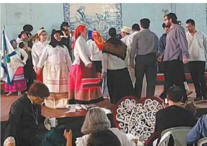
Um Show fantástico do Grupo Folclórico Tomás Borba no festival

Um belo aniversário de 67 anos e um lindo festival de folclore, só das casas regionais da Tijuca, Armando Leça (Casa do Porto), Padre Tomás Borba (Casa dos Açores), Almeida Garrett (Casa da Vila da Feira), Benvinda Maria (Casa das Beiras) e finalizando com o Eça de Queirós (Casa dos Poveiros), só faltou o Guerra Junqueiro que fazia 58 anos nesse dia... festa na Casa. E tivemos também o Trio Josevaldo para o baile.