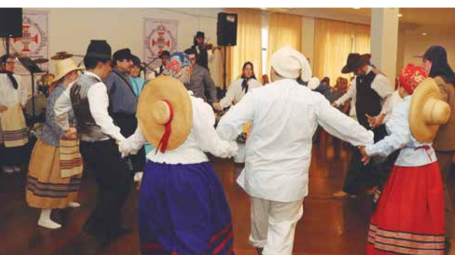
Uma exibição com muita emoção do G.F. Padre Tomaz Borba, onde todos os componentes "vestiram" a alegria de poder comemorar o seu aniversário