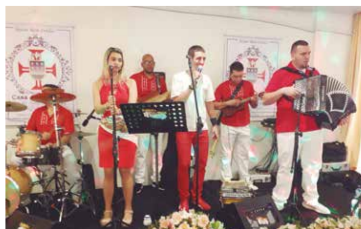
O conjunto amigos do Alto Minho abrilhantou a festa de 65 anos do G.F. Padre Tomaz Borba