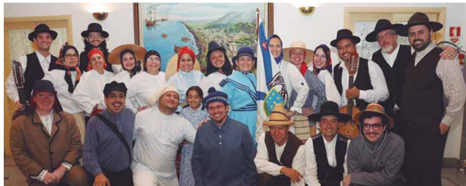
Os componentes do G.F. Padre Tomaz Borba, na festa de 65º anos de fundação, vibraram durante toda festa demonstrando o orgulho em participarem deste Grupo