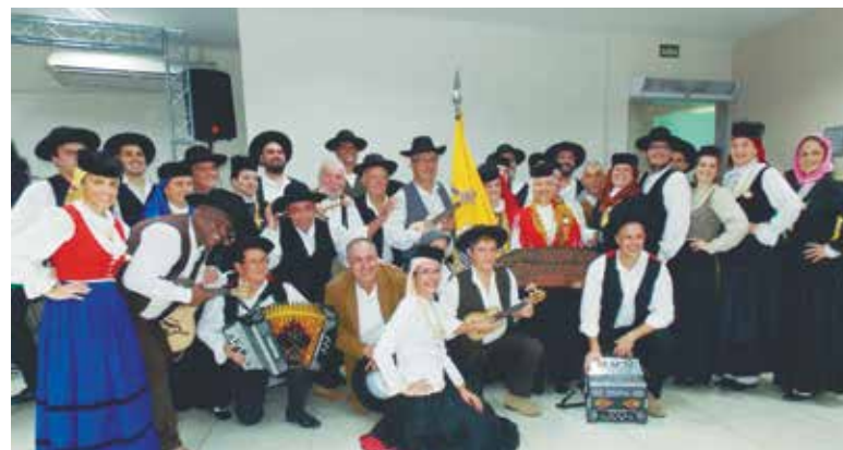
Linda imagem dos componentes do R.F. Arouca Barra Clube, no almoço churrasco na Casa de Espinho onde proporcionaram grandes momentos Regionais