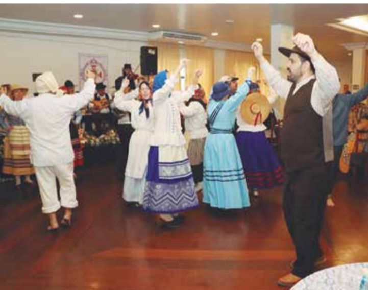
Um show à parte, a dedicação e amor ao folclore Açoriano, dos componentes G.F. Padre Tomaz Borba. Parabéns