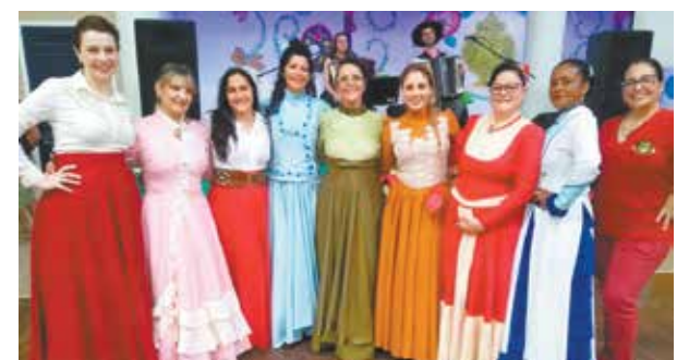
Um close especial para o Portugal em Foco, as belas componentes do Rancho Gaúcho da Casa do Minho