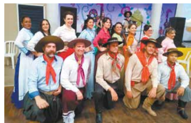
Num close para o Portugal em Foco os Componentes do Rancho da Casa do Minho

uso do acordeon no Rio Grande do Sul. Ferrenhos dedicados a tradição gaúcha naturalmente fizeram uma jogada de mestre, haja vista que os músicos veteranos estão querendo sempre enovar e acabam, alguns, estragando a pureza da nossa música gaúcha. No restante foi tudo muito bom: na culinária a tradicional costela de fogo de chão e para encerrar apresentação impecável do Rancho Gaúcho da Casa.