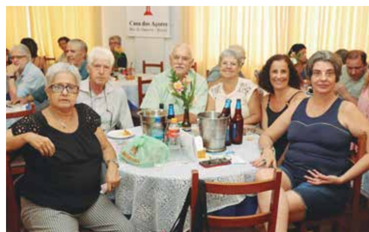
Presença marcante, no domingo festivo Açoriano onde vemos, o ex-presidente Antonio Toste com familiares e amigos