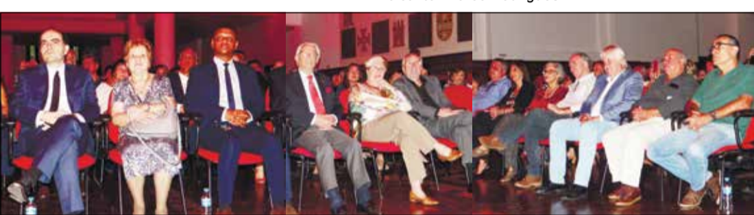
Ilustres personalidades entre os presentes.