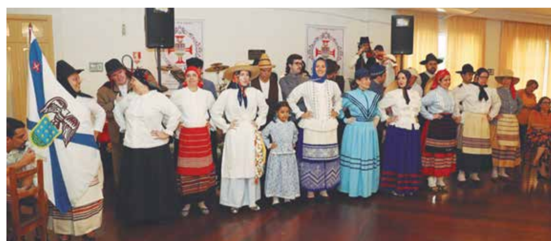
Uma data especial para os componentes G.F. Padre Tomaz Borba, 65 anos de história, continuando brilhantemente o trabalho de seus fundadores