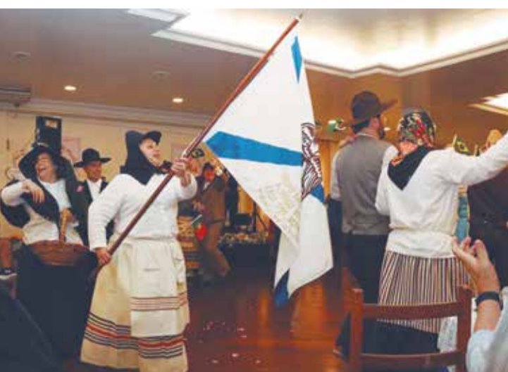
Apresentação maravilhosa do G.F. Padre Tomaz Borba, neste domingo festivo Açoriano, onde a alegria tomou conta da festa