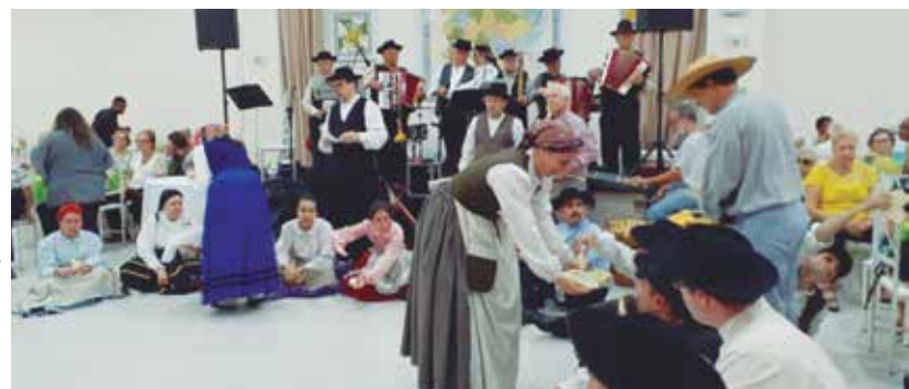
Imagem bonita com os componentes do R.F. Guerra, "merendando" depois da Desfolhada