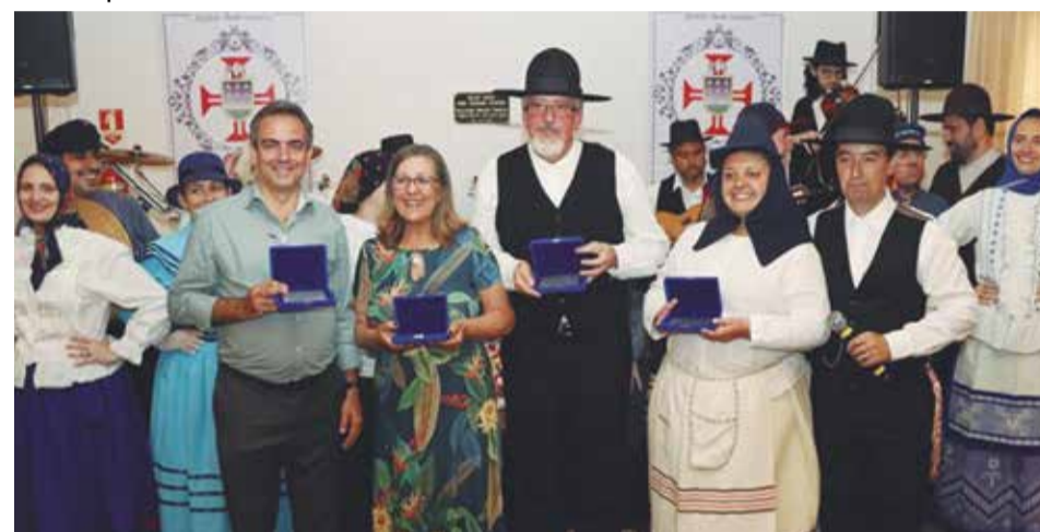
O Presidente Leonardo entregou uma placa comemorativa aos componentes e ex-componentes do G.F. Padre Tomáz Borba