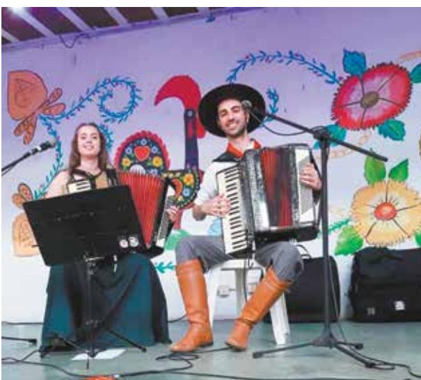
Participação magnificado Rancho Gaúcho da Casa do Minho do Rio de Janeiro