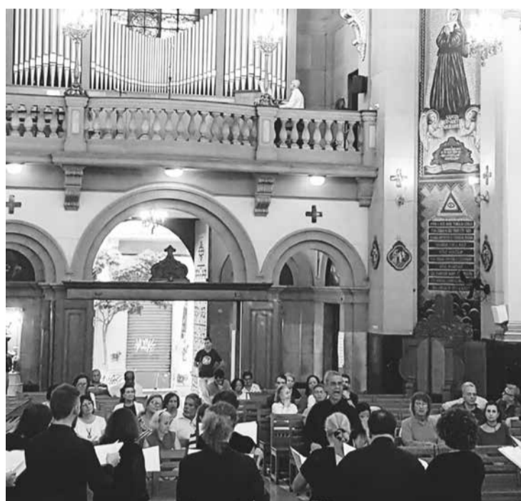
Panorâmica do público no concerto do Coro Câmera Pro-art na linda Igreja Santo Antônio dos Pobres