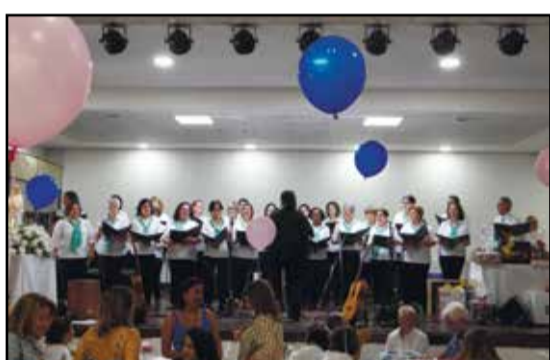
Grupo Vocal Esperançar atuando.