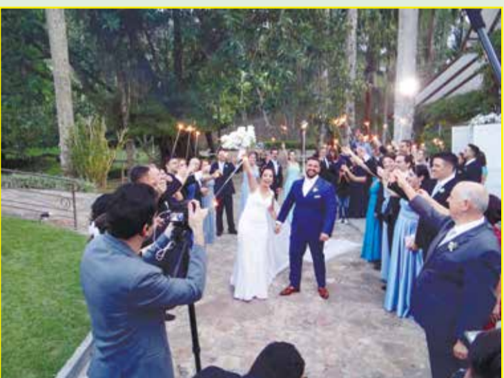
Aqui o cortejo para receber os noivos já casados.