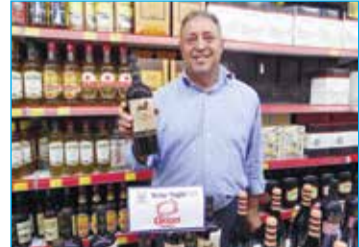
ORION VINHOS - Case