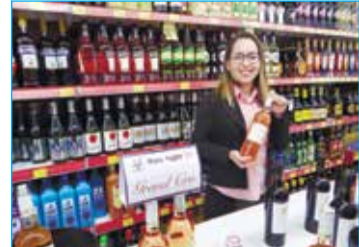
GRAND CRU - Nayara