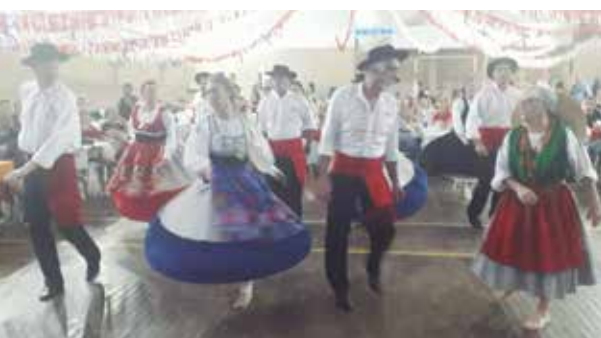
Mais um show de folclore do R.F. de Veteranos da Casa do Minho, como sempre, mostrando o seu entusiasmo pelas tradições de nossa terra

bem gelada para amenizar o calor desta época. No final, aquele caldo verde, caprichado, com broa de milho. O Conjunto Musical Amigos do Alto Minho, levou para o salão muitos casais para dançar.