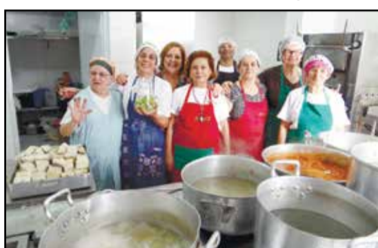
Aqui a equipe da cozinha da Casa de Portugal do Grande ABC responsáveis pelo sucesso do almoço.