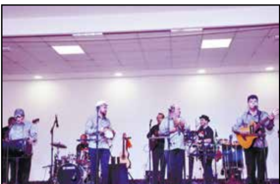
Grupo Demônios da Garôa animando a esta tarde.