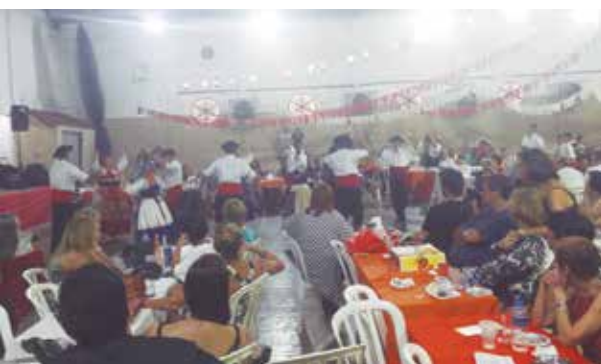
Aspecto do salão da Casa do Minho com o público atento ao show Minhoto