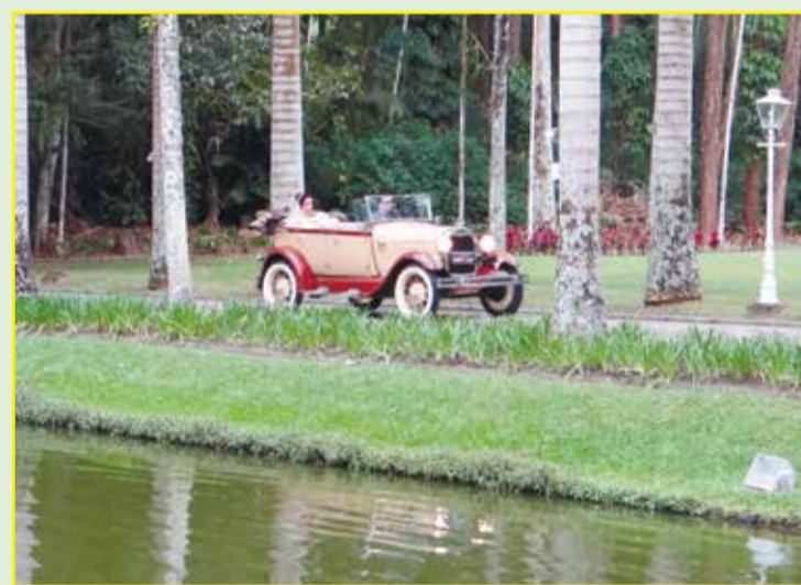
Seguindo pelo magistral caminho de palmeiras vemos o Calhambeque Ford conduzindo a noiva Priscila.