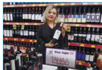
TAHAA - Vanice

salgados e nhoques, Primor charcutaria e da Casapona salames espanhóis, oferecidos para degustação na farta mesa de frios, patês, pães variados e azeites, tudo com muita fartura e qualidade. Não perca a próxima Wine Night. Vá você também conhecer o Supermercado Kanguru e sua Mega Adega, que é referência no mercado de bebidas nacionais e importadas. Além das conceituadas marcas disponíveis, está sempre investindo em sua infraestrutura para lhe oferecer conforto e comodidade ao realizar suas compras. O Kanguru,