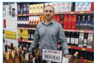
MIOLO - Lourenço

PulentaEstate, Il Pumo, Marquês de Cáceres). Devinum (trouxo os vinhos Viña Esmeralda, Narbona, La Causa, GranCoranas, Celeste). Adega Alentejana (trouxo os vinhos Cartuxa Colheita, Puglia, Izadi, Cedro do Noval, Labrador, Tiago Cabaço). Domno (trouxo os vinhos Casas Del Bosque tinto e branco em 5 tipos). Decanter (trouxo os vinhos Lírica, Bossa n.o 6 Bellini, Ripanço, José de Sousa, Marquês de Montemor, Brunel de La Gardine, Calicanto). Tivemos ainda a Importadora Kanguru, e produtos da Anne