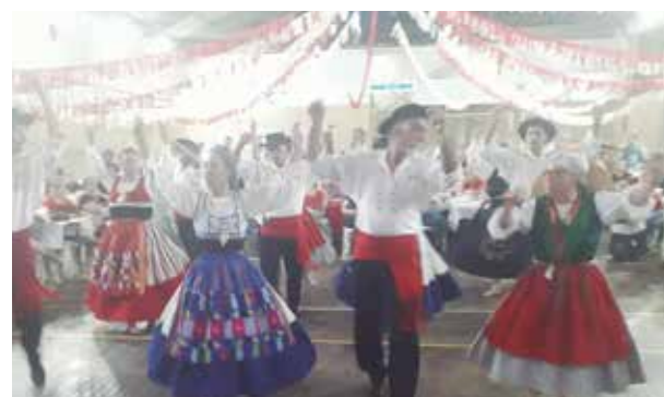
Apresentação magistral do R.F. de Veteranos da Casa do Minho, que Show!! Parabéns a todos!!