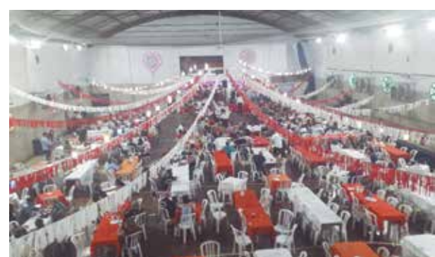
Panorâmica aérea do Arraial Minhoto da Casa do Minho