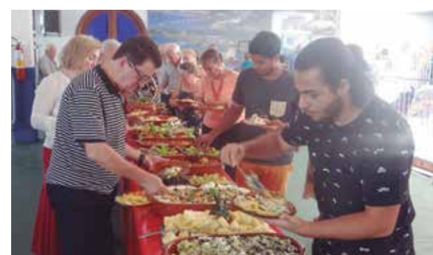
Um show de gastronomia, marca registrada da Festa Portuguesa

fez questão de entregar uma lembrança ao distinto casal. Sem dúvida uma festa portuguesa perfeita, marca da diretoria e do Presidente do Clube Recreativo JPA,