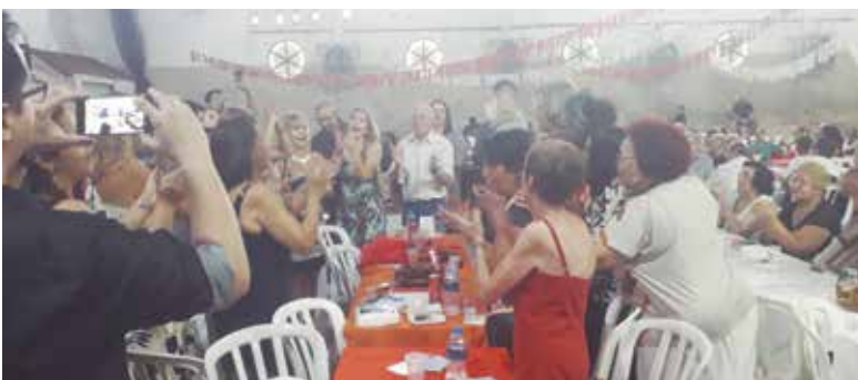
Gente boa e amiga, festejando aniversário, na Quinta de Santoinho - Arraial Minhoto

Após exibição do Rancho, os Gigantones, ao som dos Zés Pereiras, brincaram com todo o público, seguindo-se as Marchinhas Luminosas.