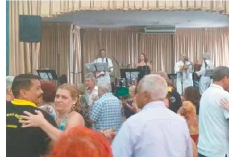
Banda Típicos da Beira Show agitou o salão Beirão e, como sempre bellissimo repertório entusiasmou o público presente