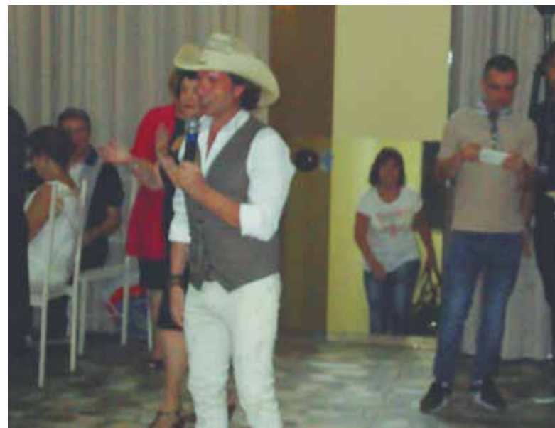
Momento em que a atração internacional, o cantor José Amaro iniciava seu show country

O churrasco estava maravilhoso. Também foi servido pernil e banana assada. Tudo bom demais.