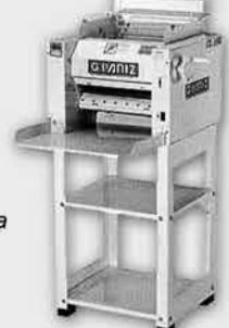
Cilindro Sovador Laminador