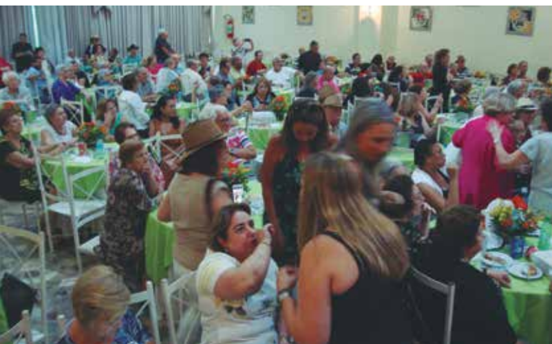
Panorâmica do salão lotado da Casa de Trás-os-Montes e Alto D'Ouro