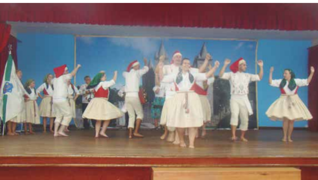
Uma primorosa apresentação foi a do R.F. Eça de Queirós, da Casa dos Poveiros, no Arraial Feirense

aquele cardápio típico com sardinha portuguesa, frango assado, batata cozida e frita e um suculento caldo verde, regados por aquela cervejinha bem gelada e vinhos portugueses; enfim, uma tarde perfeita para os amantes do Folclore Português. Como