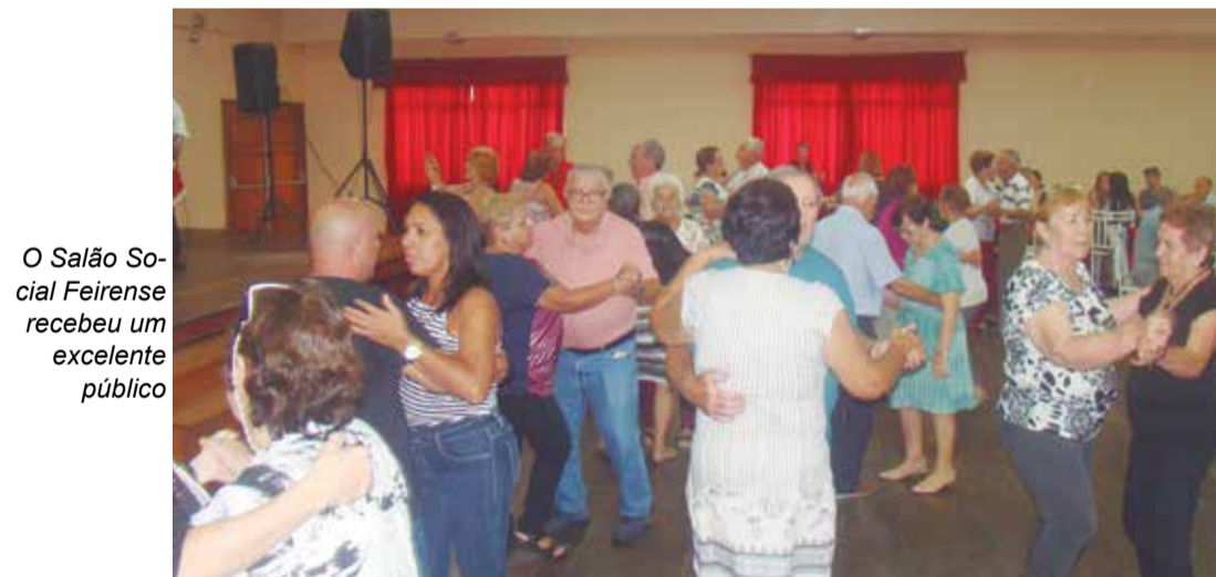
O Salão Social Feirense recebeu um excelente público

As Delícias da Culinária Portuguesa com um Toque todo Especial