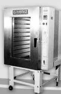
Forno Turbo a Gás