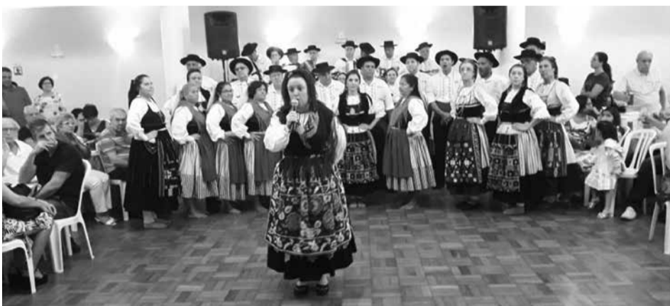
Uma data para lá de especial, para os componentes do R.F. de Veteranos da Casa do Minho