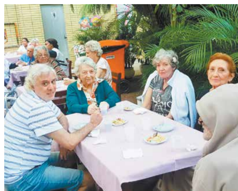
Você pode sentir a satisfação e alegria nas faces dos idosos e familiares, no "Arraiá"