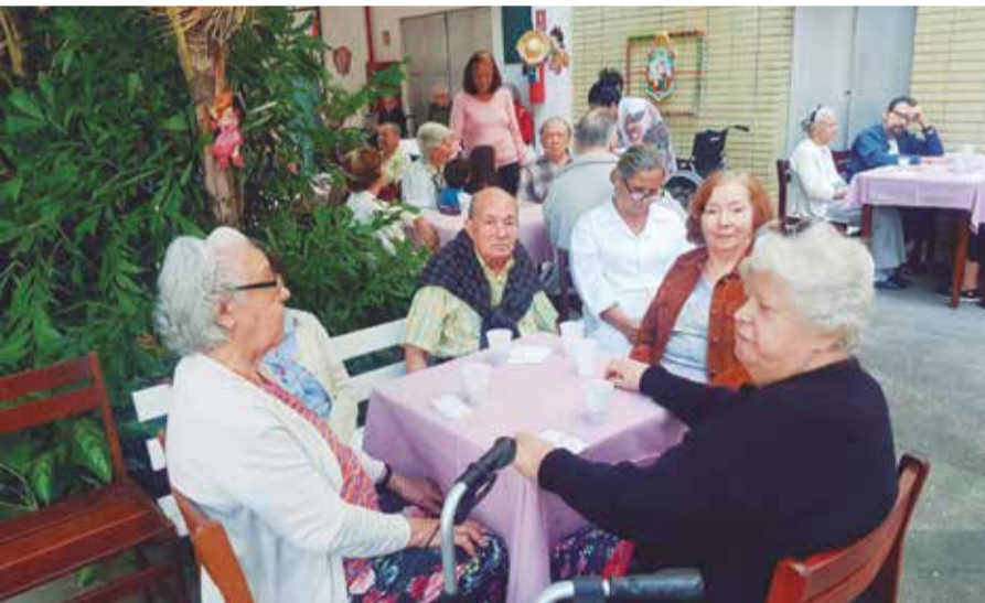
Uma tarde incrível com felizes idosos no "Arraiá" do Lar D. Pedro V