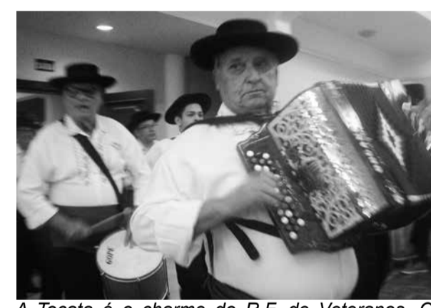
A Tocata é o charme do R.F. de Veteranos. O amor com que tocam todos os sons, das chulas, viras e tudo mais que lembra alegria