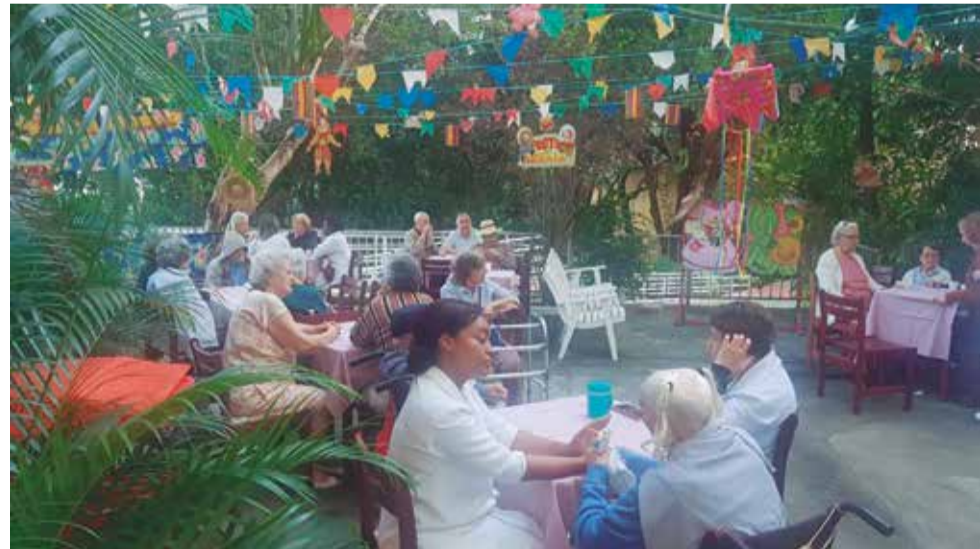
Não tem preço que pague assistir a satisfação desses idosos em viver esses belos momentos