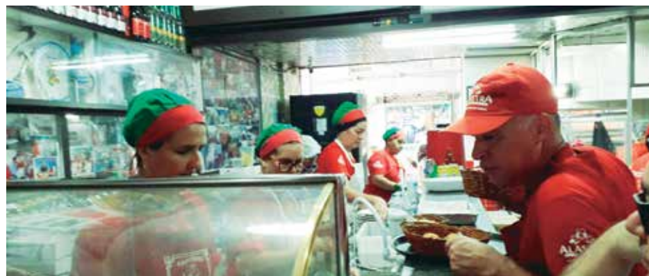
A dinâmica equipe de colaboradores do Bar Cantinho das Concertinas, sempre atenciosa com a clientela servindo, com categoria, seus petiscos