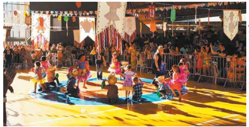
É simplesmente fantástico ver essas crianças, dando um show com seus trajés de caipira