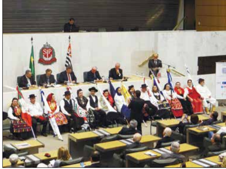
A composição da mesa de honra e os porta-estandartes dos grupos folclóricos presentes.