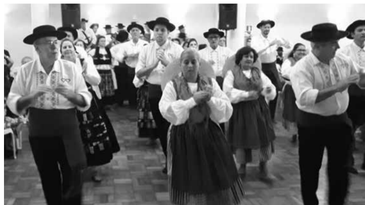
Veteranos da Casa do Minho: um show de experiência, alegria, mostrando que a idade apura a alegria de se ter na alma o amor à sua cultura