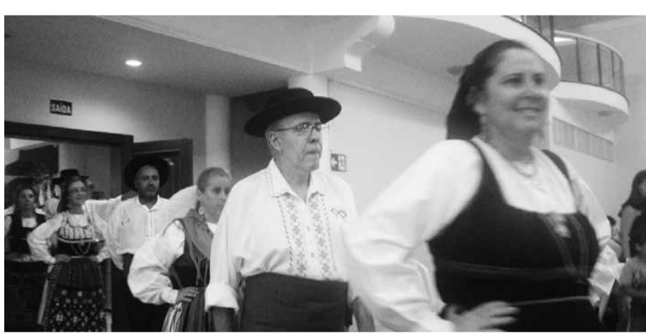
Mais um registro dos componentes veteranos da Casa do Minho, quando em palco, transbordam todo amor que tem pelo seu Rancho