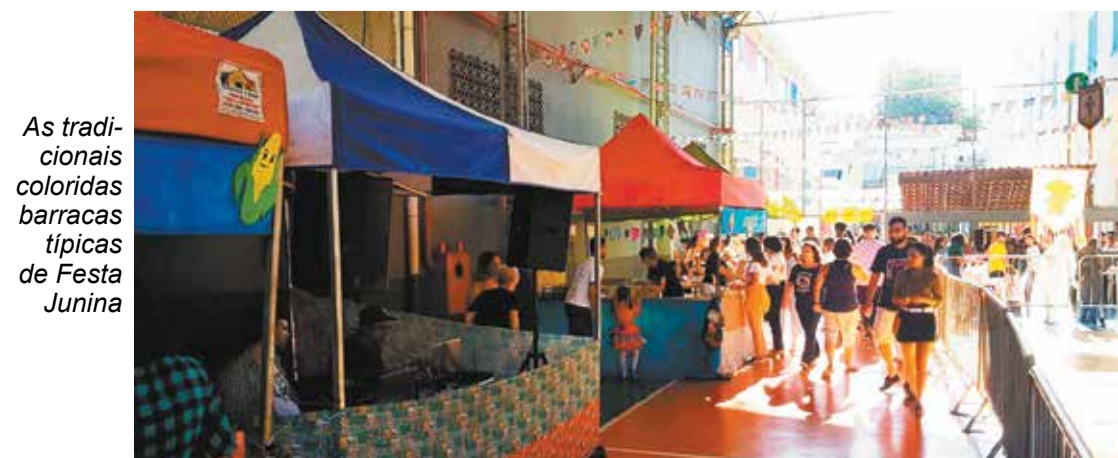
As tradicionais coloridas barracas típicas de Festa Junina