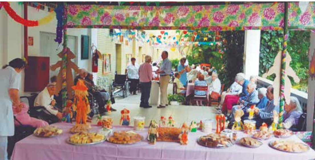
Belíssima mesa com as deliciosas iguarias do arraial, no Lar D. Pedro V, onde vemos os idosos reunidos para festejar o São João