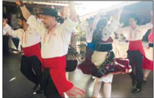
Momentos da apresentação do Grupo Folclórico dos Veteranos de São Paulo do Rotary Penha.