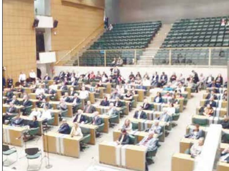
Visão geral dos ilustres presentes ao Plenário Presidente Juscelino Kubitschek de Oliveira da Assembléia Legislativa.