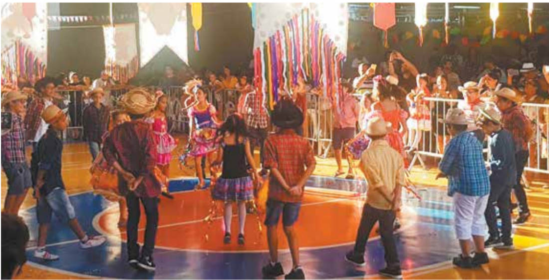
Estão de parabéns as professoras pela dedicação às turmas. Como vemos nesta imagem, a classe brincando lindamente

Com barracas de comidas típicas, muitas brincadeiras, pais atentos com suas máquinas fotográficas e filmadoras a postos para não perderem nenhum passo dos pequenos durante as apresentações de danças; assim foi a Festa Junina do Colégio Sagres que aconteceu no sábado, dia 29 de junho.