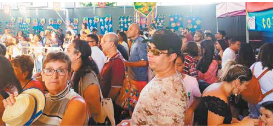
Os pais dos alunos atentos à apresentação das crianças no Arraial do Sagres