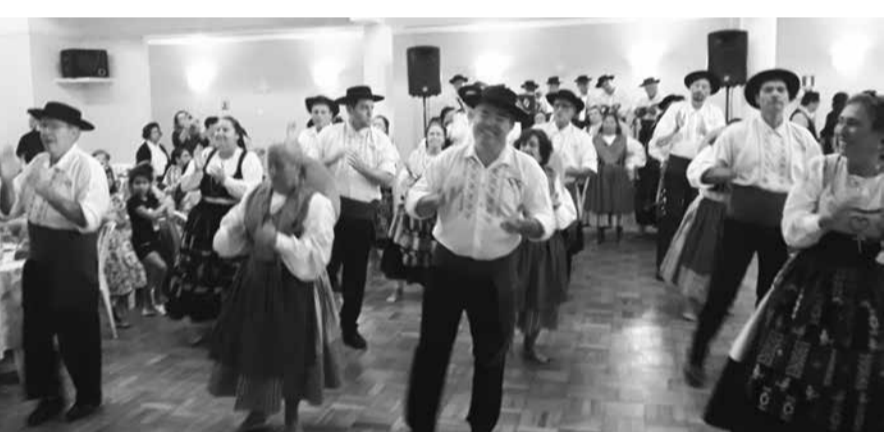
Que show! Esta data festiva, dos Veteranos, no domingo passado será lembrada para sempre