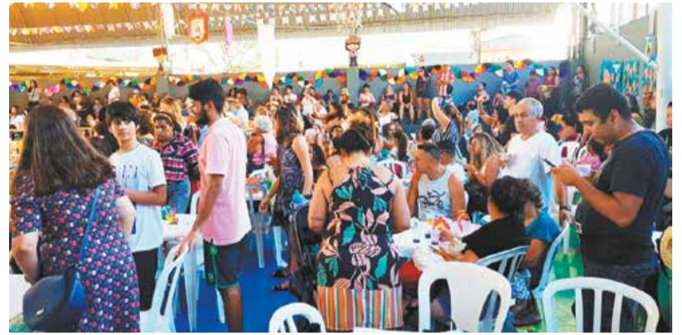
Panorâmica da imponente quadra do Colégio Sagres, totalmente lotada de jovens felizes. Uma beleza de se ver