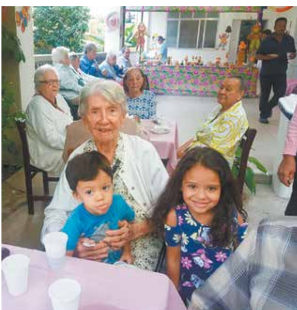
Linda imagem do "Arraiá", com a alegria da vovó com as crianças, irradiando saúde