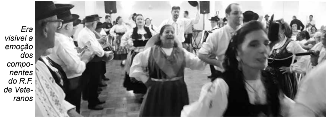
Era visível a emoção dos componentes do R.F. de Veteranos