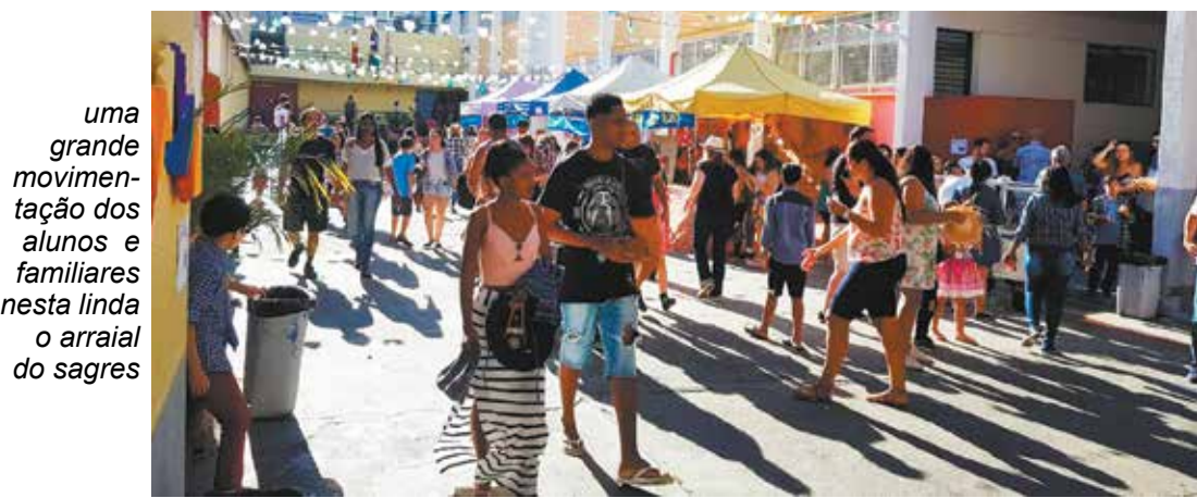
uma grande movimentação dos alunos e familiares nesta linda o arraial do sagres