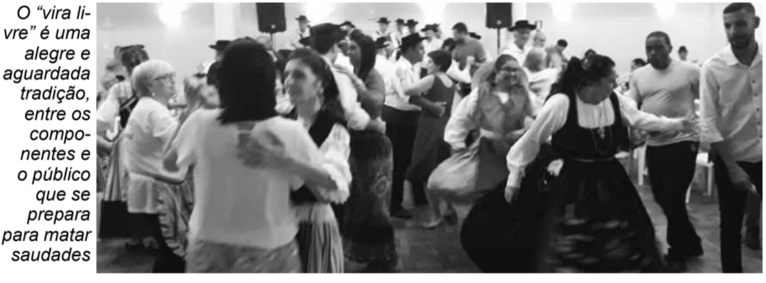
O "vira livre" é uma alegre e aguçada tradição, entre os componentes e o público que se prepara para matar saudades