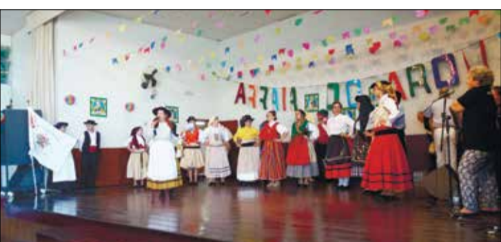
Exibição do Rancho Folc. Aldeias da Nossa Terra do Arouca.

eleições que se aproximam em Portugal, um ato não obrigatório, mas moral e cívico. O Rancho Folclórico Aldeias da Nossa Terra, do Arouca São Paulo Clube, mais uma vez cuidou da animação desta tarde, percorren- do Portugal de norte a sul com suas modas, não faltando ainda o tradicional bailarico.