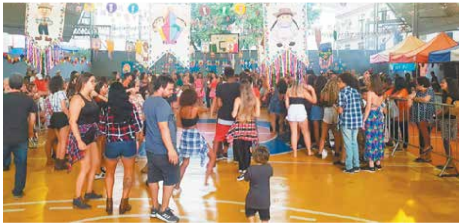
Um clima totalmente familiar, e de confraternização entre pais, filhos, colegas e educadores, no Arraial do Sagres