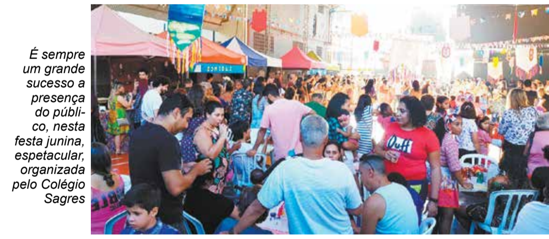
É sempre um grande sucesso a presença do público, nesta festa junina, espetacular, organizada pelo Colégio Sagres