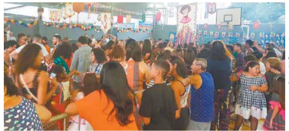
Imagem marcante do público prestigiando o sensacional Arraial do sagres