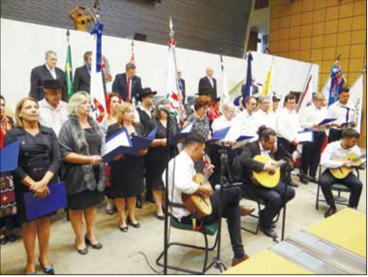
Instante da apresentação do Coral Cantares do Basalto da Casa dos Açores de São Paulo.