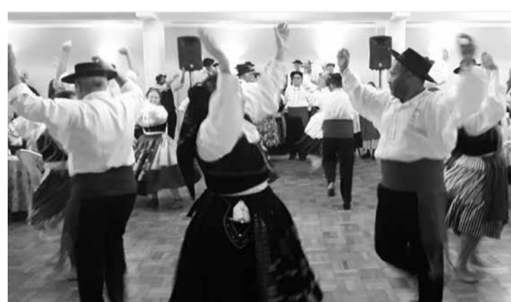
A cada dança, um grande show, a cada volta do vira uma recordação que ficará para sempre