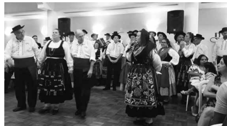
Momento em que os componentes veteranos eram homenageados pelo belo trabalho desenvolvido por quem tem amor à sua Casa