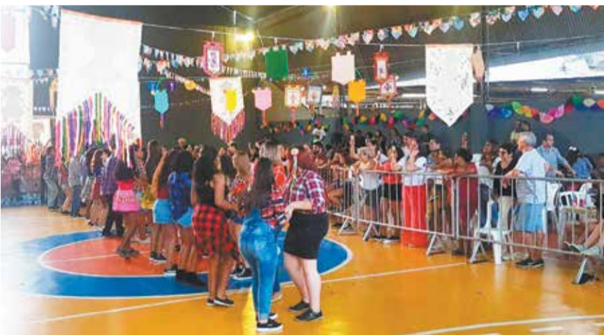
E chegou a hora da quadrilha!! Olha a chuva!!!! Momento sempre esperado nas Festas Juninas dos colégios, quando os alunos formam seus mais bem escolhidos pares para dançar e brincar