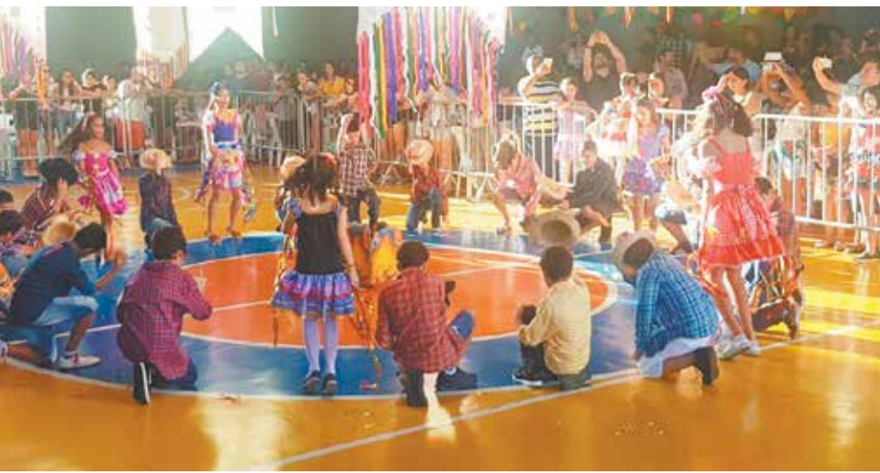
Apresentação espetacular das crianças no Arraial do Sagres