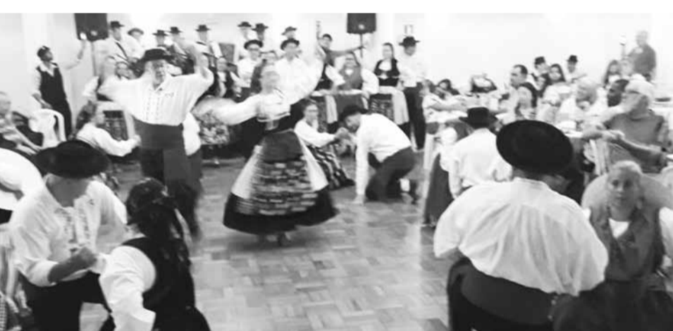
Um verdadeiro espetáculo de Folclore Português foi dado pelo Rancho de Veteranos da Casa do Minho, no seu aniversário