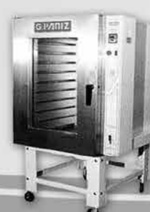
Forno Turbo a Gás