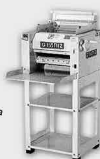
Cilindro Sovador Laminador