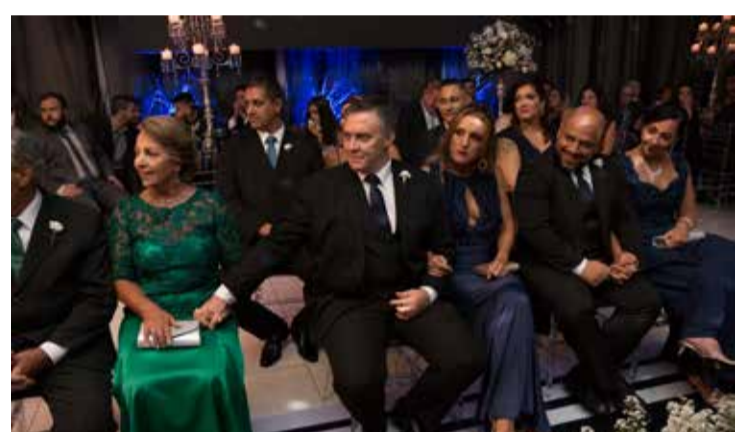
Familiares e padrinhos durante o ato Religioso