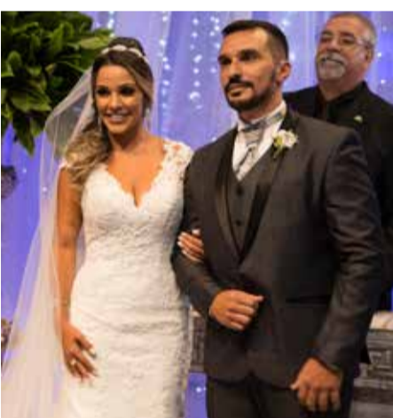
Os noivos radiantes numa pose especial para o Portugal em Foco