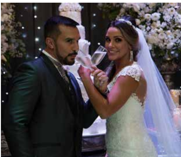
Um brinde ao amor e à felicidade