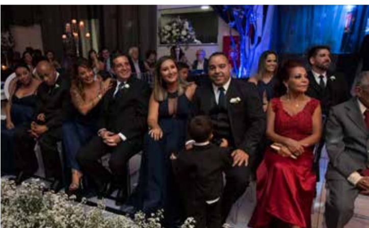
Os padrinhos numa linda imagem durante a cerimônia