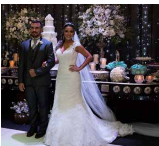
Registro fotográfico dos noivos diante a mesa do bolo e dos deliciosos doces