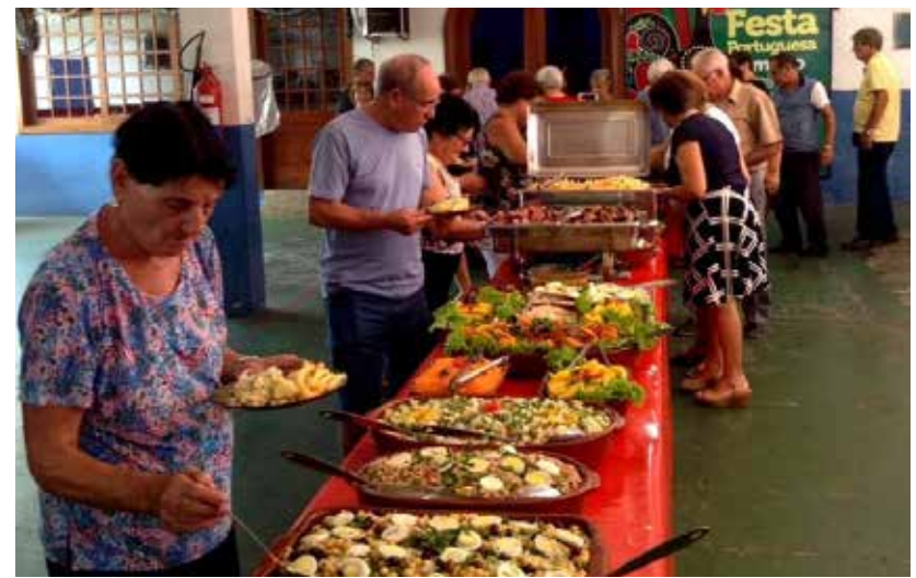
A deliciosa gastronomia do Almoço Português é uma das maravilhas desse encontro mensal