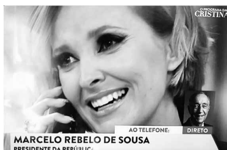
AO TELEFONE: MARCELO REBELO DE SOUSA PRESIDENTE DA REPÚBLICA

vida várias vezes estive consigo quando arrancou com novas fases da sua vida - lembra-se da sua revista, a primeira entrevista? - e várias vezes, noutros tempos, eu queria desejá-lhe muitas felicida-