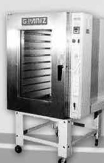
Forno Turbo a Gás