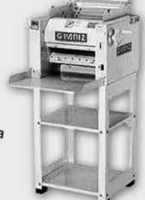
Cilindro Sovador Laminador