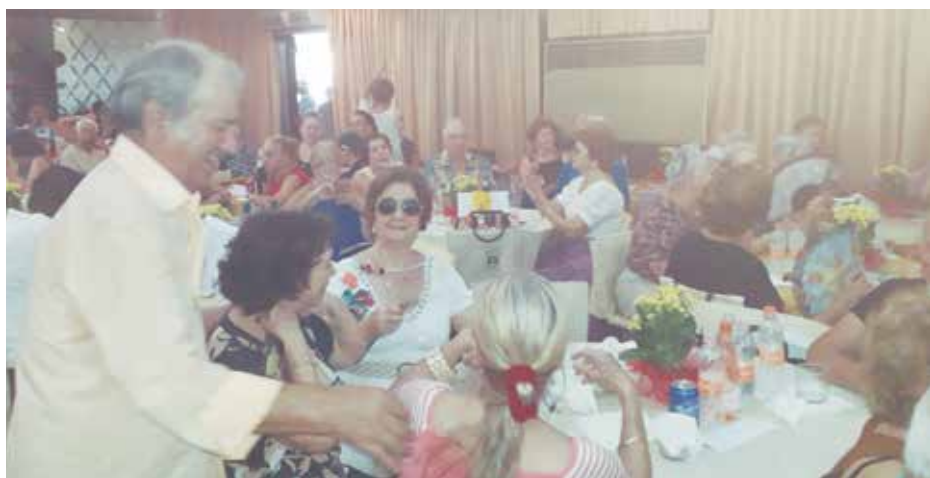
Amigos e associados, felizes, lotaram o Almoço de Reis da Casa das Beiras

empadão de frango (imperdível) e arroz de bacalhau. Tudo preparado com o capricho de sempre. Na música a Banda T.B. Show deu o ritmo empolgante ao Almoço de Reis beirão. Os amigos, os associados e a diretoria comemoraram e homenagearam com um bolo os aniversariantes do mês.