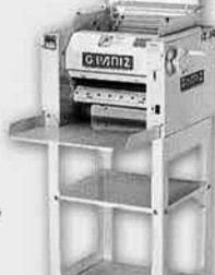
Cilindro Sovador Laminador