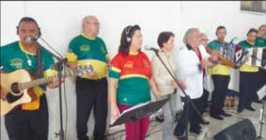
A animação desta tarde esteve a cargo da Tocata Musical Cá Te Quero que muito agradou a todos.

ça ficasse pequena para tanta gente. O Grupo Folclórico dos Veteranos, agradece aqui todo o apoio da comunidade com suas presenças, bem como patrocinadores e apoiadores, e promete que para o ano teremos muito mais realizações.