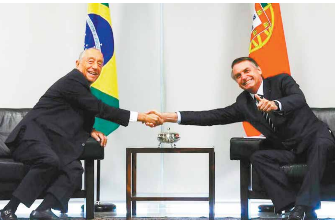
Marcelo rebelo reuniu com Bolsonaro em Brasília