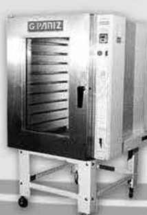
Forno Turbo a Gás