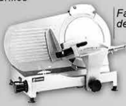
Fatiador de Frios