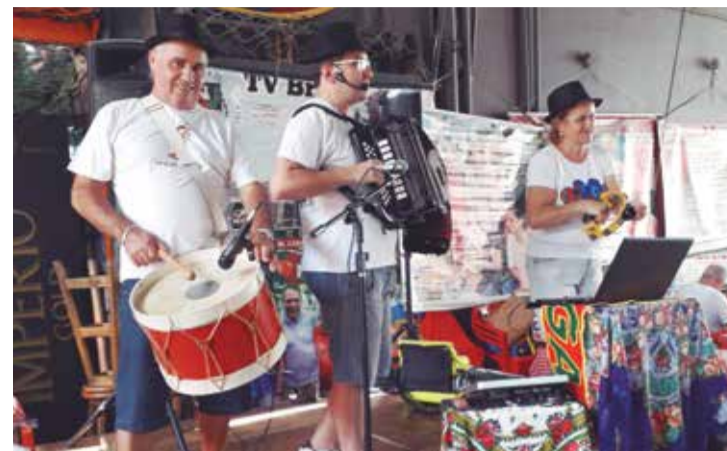
A Tocatá do Cadeg, sempre uma atração a parte na Adeia Portuguesa

proprietário, do Restaurante Cantinho das Concertinas recebendo todos com muito carinho, que durante o ano inteiro prestigiou a Aldeia Portuguesa do Cadeg.