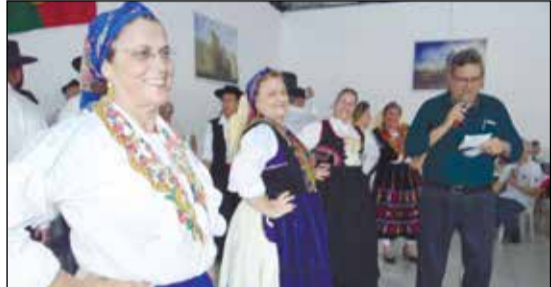
Instantes da exibição do Grupo Folclórico dos Veteranos de São Paulo do Rotary Penha.