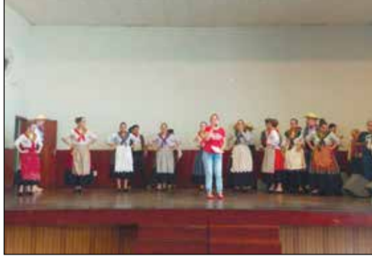
Rancho Aldeias da Nossa Terra do Arouca durante sua atuação.