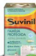
Tinta Acrílica sem cheiro e antibacteriana