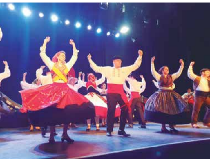
Apresentação espetacular do Rancho folclórico Maria da Fonte da Casa do Minho em Buenos Aires