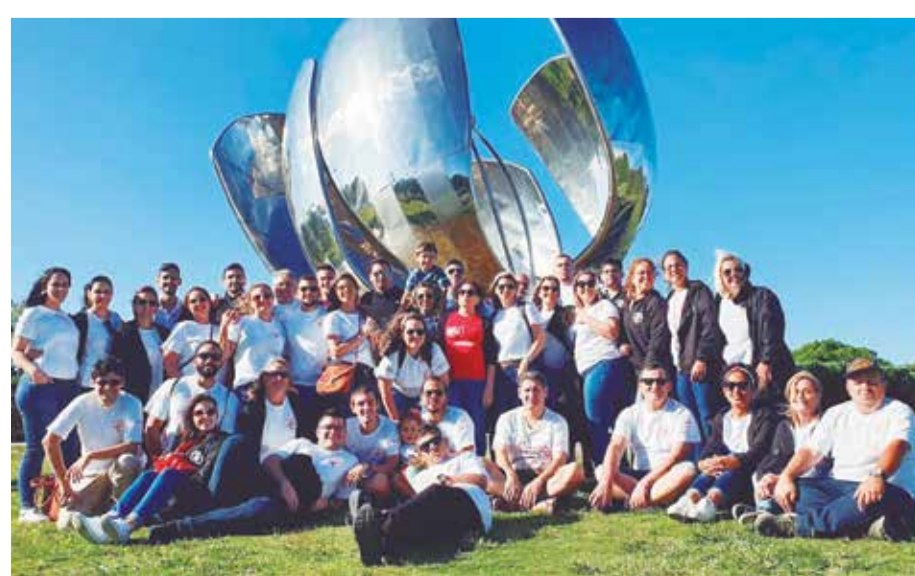
Momento de descontração dos componentes do Rancho Folclórico Maria da Fonte, no ponto turístico em Buenos Aires na Argentina