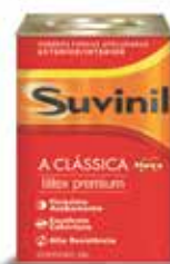
Tinta Látex Premium acabamento fosco aveludado