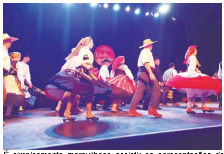
É simplesmente maravilhoso assistir as apresentações do Rancho folclórico Maria da Fonte em qualquer lugar do mundo