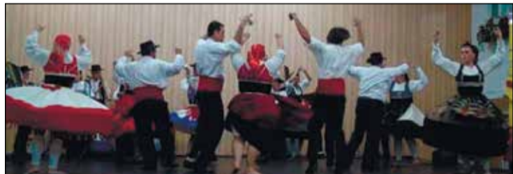
Instante da exibição do grupo adulto da Casa de Brunhosinho.