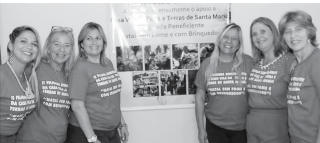
Num close para o Portugal em Fogo, um grupo de amigas incentivadora do Projeto Social Cecília Conde.