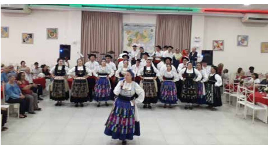
Bonita imagem durante a apresentação do Rancho Folclórico Veteranos da Casa do Minho