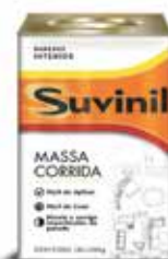
Massa Corrida de fácil aplicação interiores.