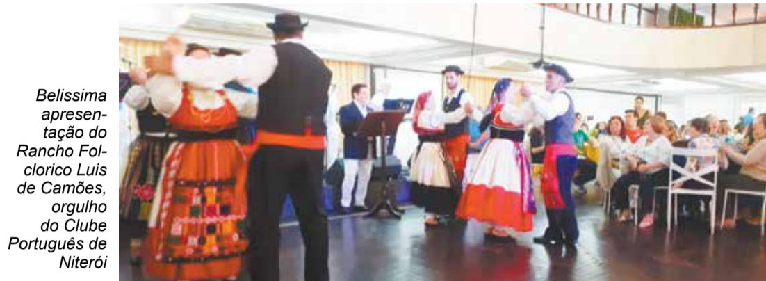
Belíssima apresentação do Rancho Folclórico Luis de Camões, orgulho do Clube Português de Niterói