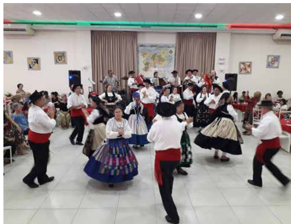
Apresentação especial Rancho Folclórico Veteranos da Casa do Minho no arraial transmontano