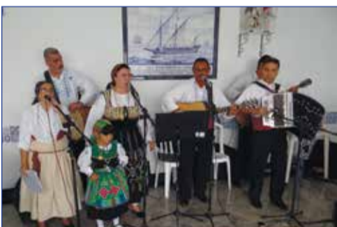
Animando a esta tarde a tocata do Rancho Folc. Raízes de Portugal.