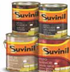
Efeitos Especiais Texturatto Premium especial interior