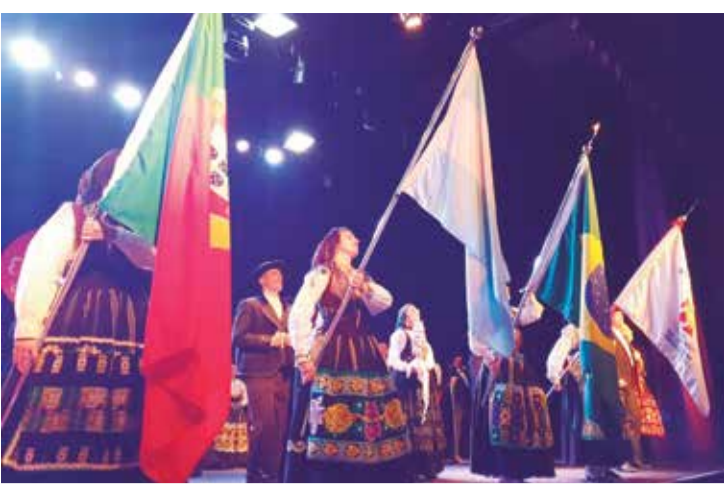
O verdadeiro espetáculo, o show das bandeiras, de Portugal, Argentina, Brasil e do Rancho folclórico Maria da Fonte da Casa do Minho