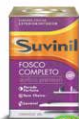
Tinta Acrílica acabamento fosco