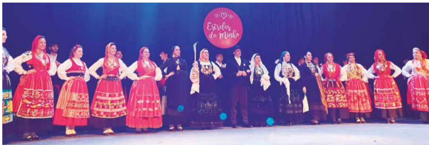
Imagem marcante do Rancho Folclórico Maria do Fonte da Casa do Minho, no teatro Canning em Bueno Aires