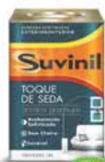
Tinta Acrílica acabamento acetinado