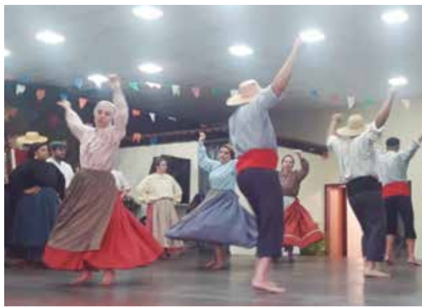
Outro registro do show de folclore, na Festa de São João, nos Camponeses de Portugal. Nesta foto vê-se o "Bailarico" em movimento