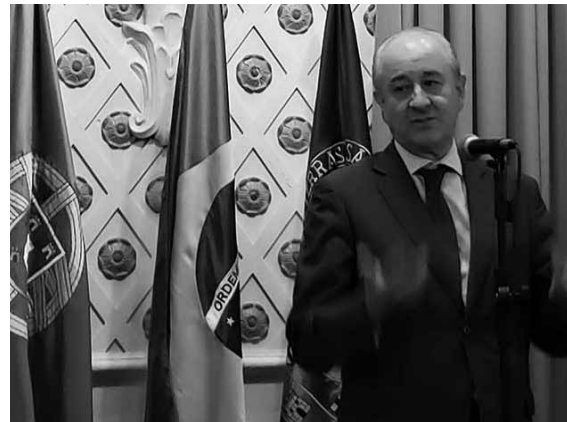
Dr. Rui Rio discursando