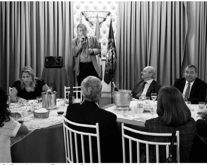
O Presidente Ernesto Boaventura saudando os presentes