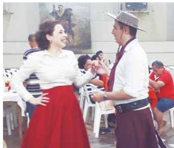
O encanto e a magia do Folclore Gaúcho revivido na Casa do Minho, onde as "prendas" recebem carinho de seus "peões"

Outra belíssima Festa Gaúcha, a tradicional Costelada mensal na Casa do Minho, onde a Cultura Gaúcha é grande atração, com show do Rancho Gaúcho da Casa do Minho blindando o público com um belo espetáculo de danças e músicas tradicionais do Rio Grande do Sul. Bonitas prendas e seus peões brilham rodopiando no ginásio da Casa do Minho. Outro destaque da Festa Gaúcha é, sem dúvida, a deliciosa Costelada com um sabor inconfundível, preparada por verdadeiros mestres da culinária gaúcha; enfim, um domingo perfeito, com a presença das Comunidades Gaúcha e Portuguesa.