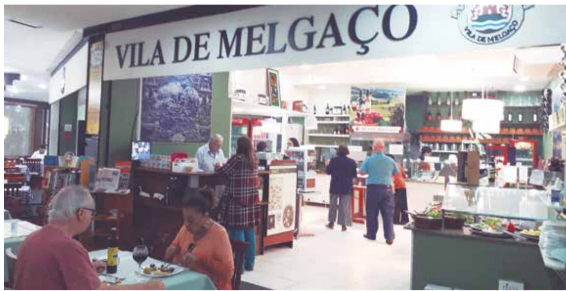
Visual da Belíssimas instalações do lindo Restaurante Vila de Melgaço, no Niterói Shopping

Excepcional comida portuguesa Apresenta diversos pratos típicos portugueses, mas também tem op-