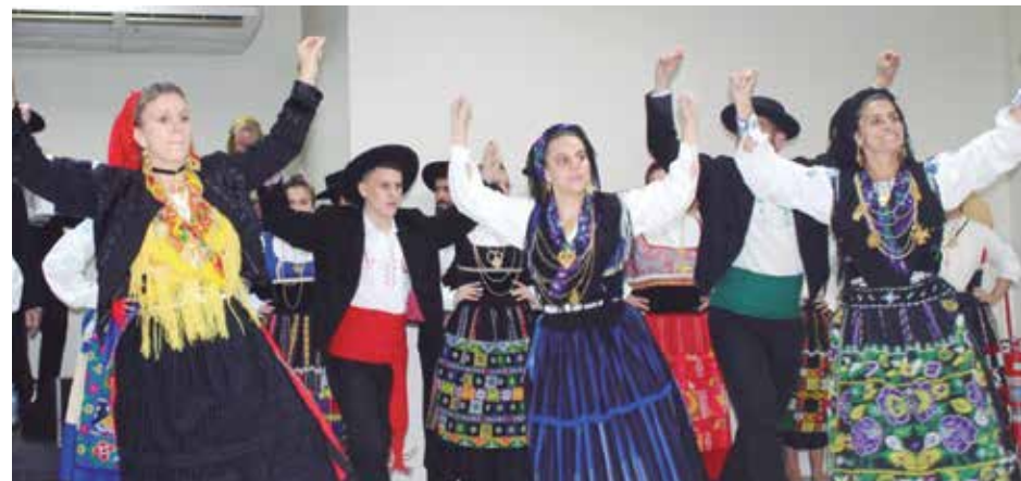
O G.F. Almeida Garrett é, realmente especial e, com seu carisma, encantou mais uma vez, o público presente da querida Casa de Espinho