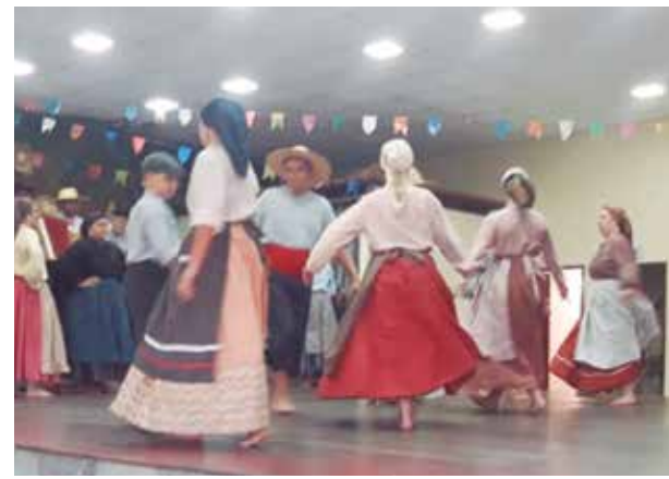
Apresentação, com muito capricho e emoção, dos componentes do R.F. Camponeses de Portugal, com seus trajes tipicamente regionais