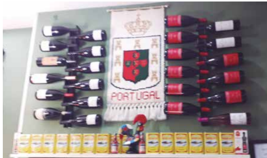
Excelentes marcas de azeite e uma maravilhosa carta de vinhos portugueses e nacionais