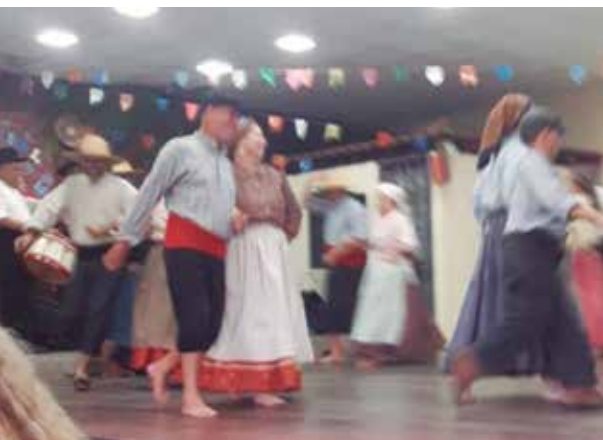
R.F. Camponeses de Portugal brilhou na Festa de São João, em Duque de Caxias, relembrando as festa dos santos populares em Portugal