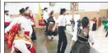
Momentos da exibição do G. F. da Casa de Brunhosinho adulto.