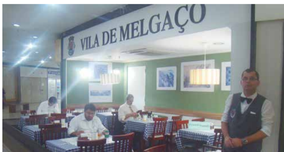
Panorâmica da maravilhosa decoração do Restaurante Vila de Melgaço

Outro ângulo das dependências do Restaurante Vila de Melgaço, sempre com sua equipe atenta para servir bem os cliente