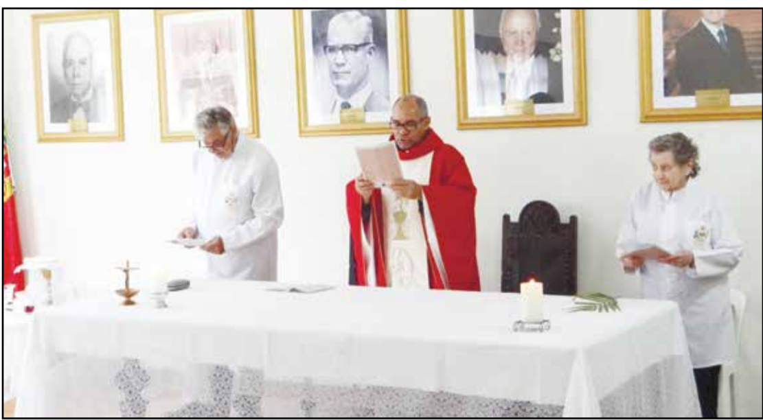
Instante da celebração da Missa de Ramos no Lar da Provedoria.