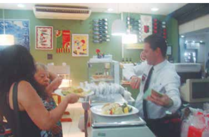
Uma equipe de alto nível para servir muito bem

ções a brasileira. O sabor e a qualidade da comida são excelentes. O atendimento é ótimo.