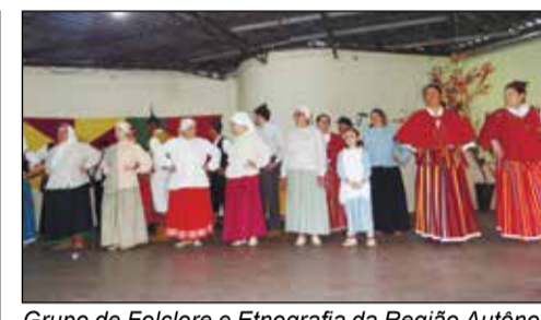
Grupo de Folclore e Etnografia da Região Autónoma da Madeira infantil.