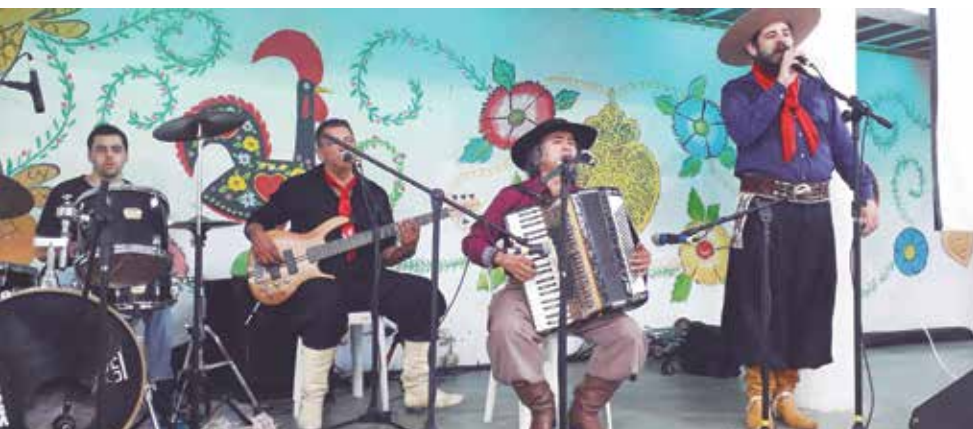
Dando o toque musical na Festa Gaúcha, o Grupo Marcas do Sul, com excelente repertório alegrou esta tarde dominical