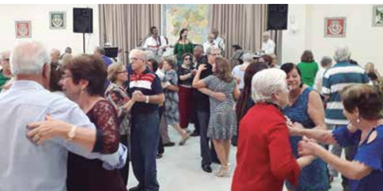
O conjunto Típicos da Beira Show, dando o ritmo ao almoço transmontano, evento sempre aguardado por aqueles que apreciam uma Casa Regional