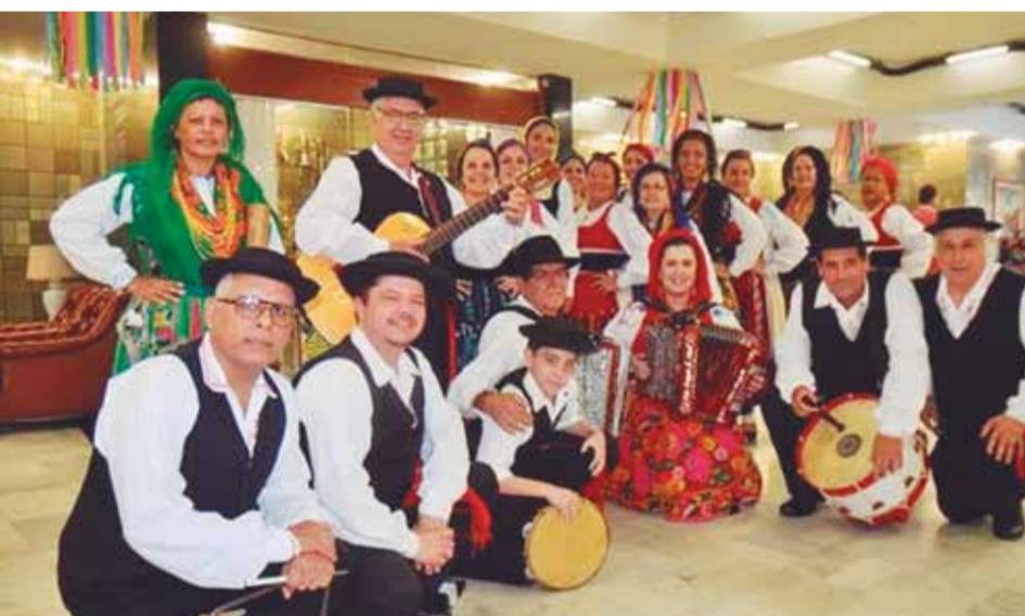
O Rancho Folclórico Luiz Vaz de Camões, com seus belíssimos trajes, brilhou na Quinta de Santoiinho, mostrando toda a "raça"