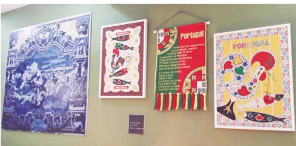
Restaurante Vila de Melgaço onde a saudade de Portugal, é revida com Intensidade. A diretora saúda a Comunidade Portuguesa neste dia de Portugal e Camões