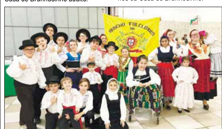
Grupo Folclórico da Casa de Brunhosinho mirim.