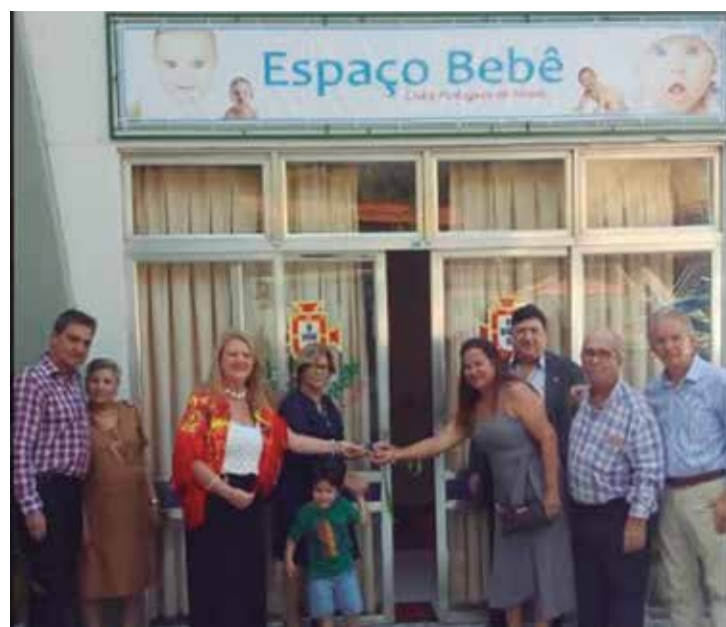
Diretoria do Clube Português de Niterói, inaugurou, no domingo passado, nas dependências do Clube, o Espaço do Bebê, especialmente para o conforto das crianças que frequentam com seus pais, o nosso Clube