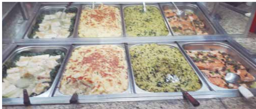
Deliciosos pratos, em destaque, arroz com brócolis, peixe e bacalhau