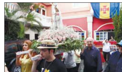
Momentos da procissão debaixo de chuva.