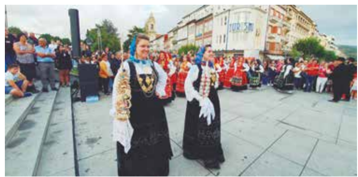
A Elegância o charme dos Componentes do R.F. Maria da Fonte