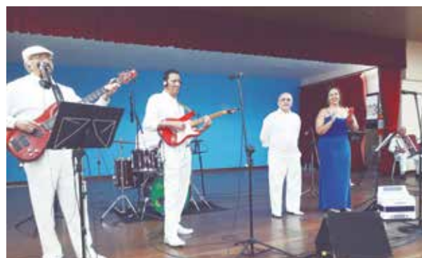
Uma data muito especial, são 34 anos de uma linda história Banda Típicos da Beira Show