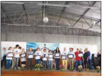
Aqui todos os homenageados neste dia.