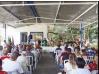
Celebração da santa missa em Louvor a São Bernardino de Sena.