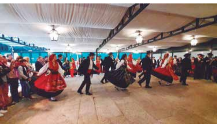
Apresentação magistral do R.F. Maria da Fonte