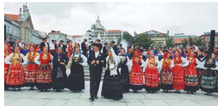
Que apresentação do R.F. Maria da Fonte na cidade de Braga