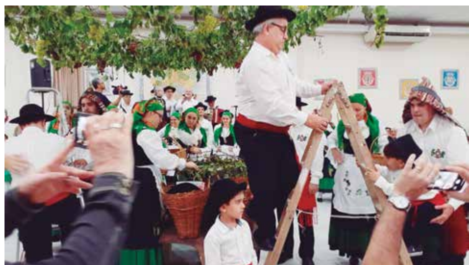
Linda imagem das Vindimas Transmontanas com os componentes do G.F. Guerra Junqueiro

vieram pela primeira vez a uma vindima à portuguesa. Saíram de lá encantados com a bela apresentação do G.F. Guerra Junqueiro com suas danças e cantares e foram só aplausos.