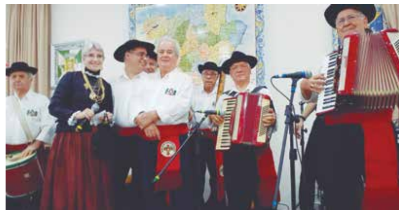
A Tocata do G.F. Guerra Junqueiro e sua cantadeira é sempre uma atração com muito ritmo