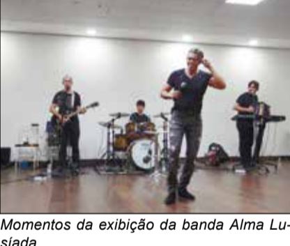
Momentos da exibição da banda Alma Lusíada.

muita alegria e muita animação. Iniciaram o show com o Hino de Portugal, apresentaram muito folclore para os presentes dançarem e recordaram muitas musicas do ídolo Roberto Leal.