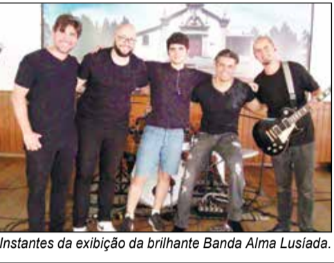
Instantes da exibição da brilhante Banda Alma Lusíada.