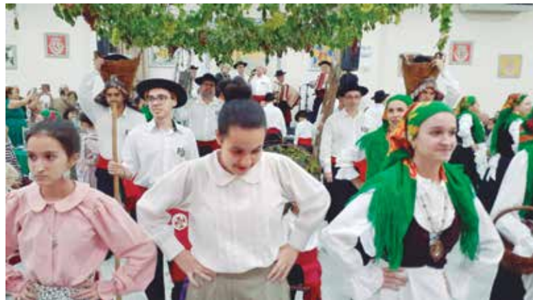
Belíssima apresentação do G.F. Guerra Junqueiro na Festa das Vindimas

O conjunto Amigos do Alto Minho não deixou ninguém ficar parado e para fechar a tarde um delicioso vinho e um