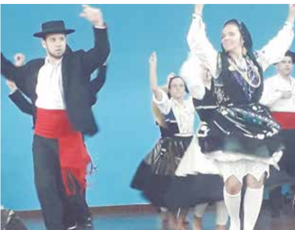
Um verdadeiro espetáculo a apresentação do Rancho Folclórico Almeida Garrett

amigos que já 34 anos prestigiam essa querida Banda, marcando com mais um ano de sucesso. Eles merecem.