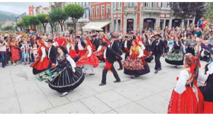
Simplesmente maravilhosa foi a passagem do Rancho Maria da Fonte em Braga