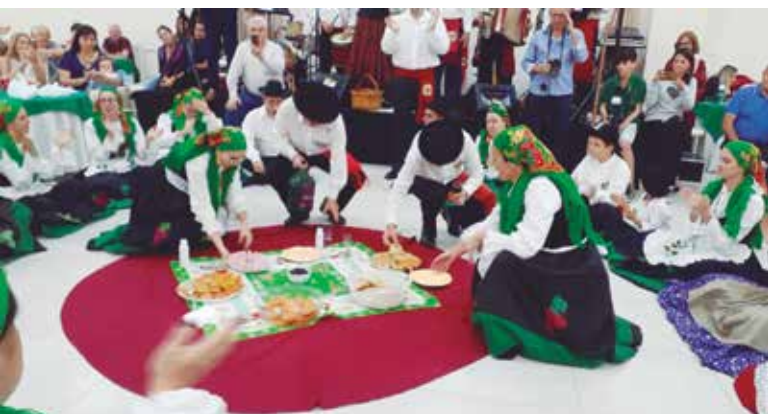
Momento marcante das vindimas com os componentes do G.F. Guerra Junqueiro realizando a merenda