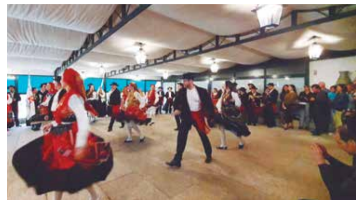
Um verdadeiro espetáculo de folclore encantando o público