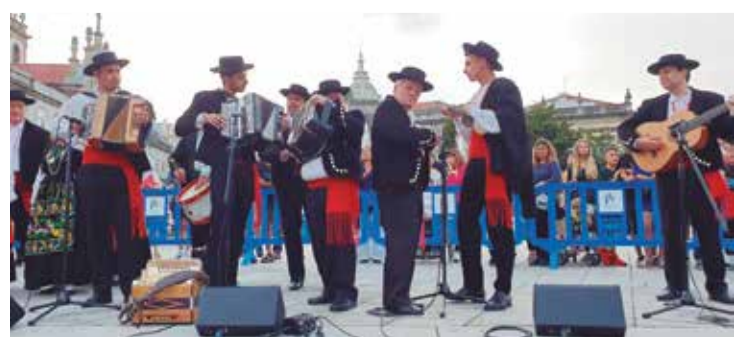
A Toca do R.F. Maria da Fonte deu um show de ritmo e charme em Braga