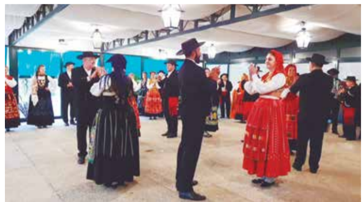
Cada movimento era um show dos componentes do R.F. Maria da Fonte