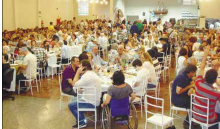
Aqui vemos o salão totalmente lotado neste dia.