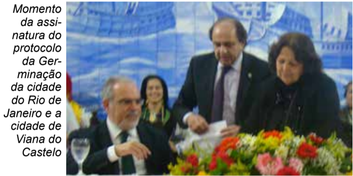
Momento da assinatura do protocolo da Geminação da cidade do Rio de Janeiro e a cidade de Viana do Castelo