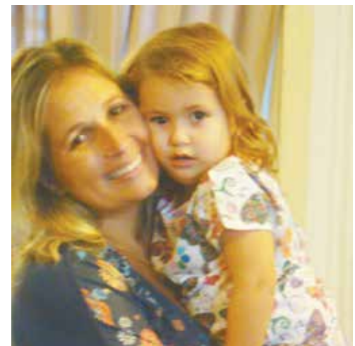
Linda imagem da primeira-dama, Rose Boaventura e sua filha, a princesa Camila num momento de carinho e de amor