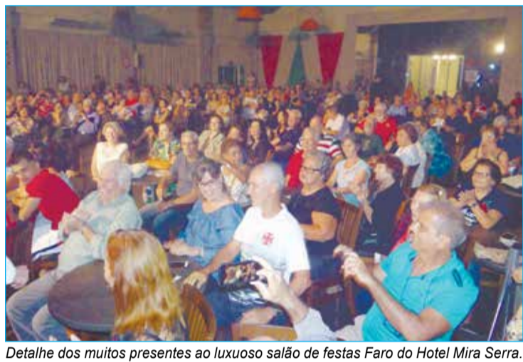
Detalhe dos muitos presentes ao luxuoso salão de festas Faro do Hotel Mira Serra.