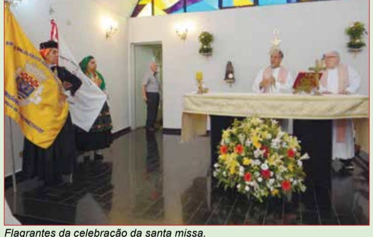
Flagrantes da celebração da santa missa.