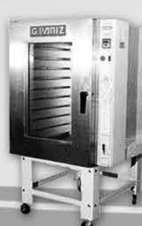
Forno Turbo a Gás