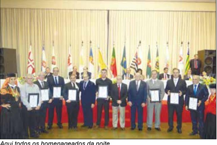
Aqui todos os homenageados da noite.