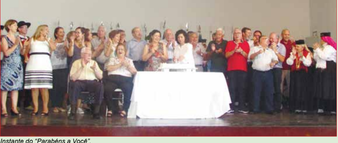
Instante do "Parabéns a Você".