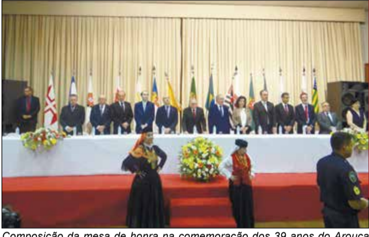
Composição da mesa de honra na comemoração dos 39 anos do Arouca São Paulo Clube.