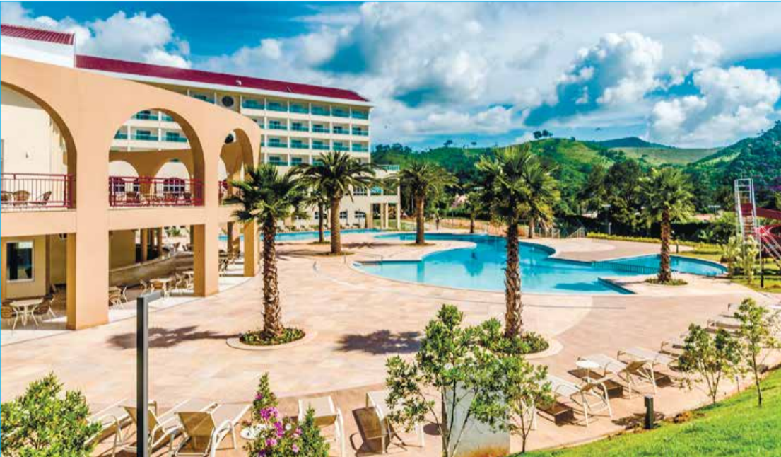
Hotel Mira Serra