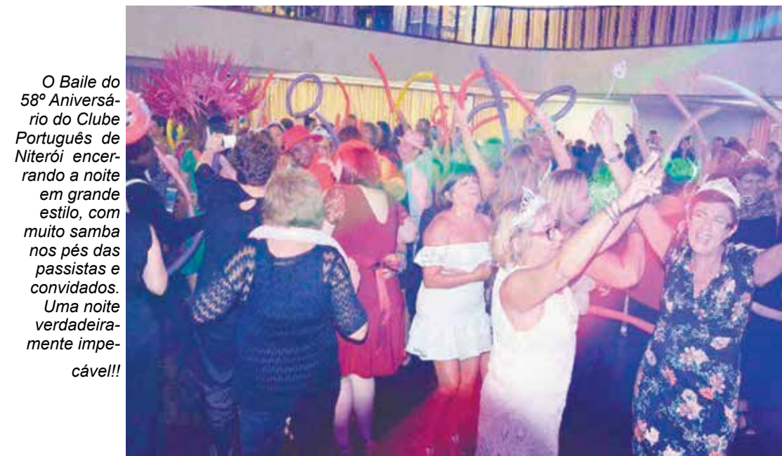
O Baile do 58º Aniversário do Clube Português de Niterói encerrando a noite em grande estilo, com muito samba nos pés das passistas e convidados. Uma noite verdadeiramente impecável!!!