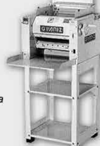
Cilindro Sovador Laminador