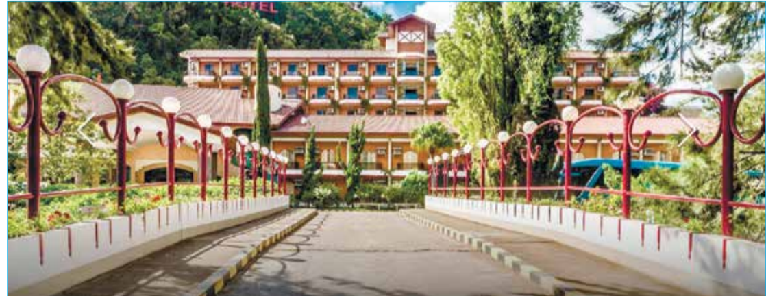
Hotel Recanto das Hortênsias