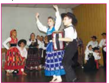
Aqui o grupo mirim da Casa de Brunhosinho durante seu show.