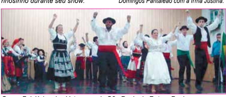
Grupo Folclórico dos Veteranos de São Paulo do Rotary Penha.