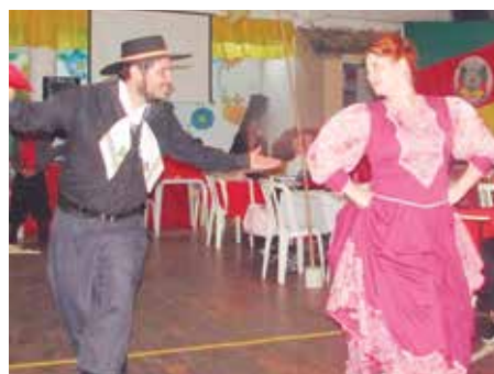
O charme e elegância do Grupo da Casa - Rancho Gaúcho, seus trajes coloridos e muita alegria

Domingo de muito encanto e alegria na Casa do Minho, onde foi realizada a tradicional Costela Gaúcha e na oportunidade a diretoria comemorou o Dia