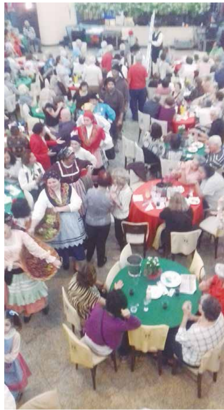
O público prestigiou, em peso, as Vindimas na Casa das Beiras lotando o salão e participando desta alegria que é a colheita das uvas e distribuídas nas mesas

No passado dia 14, a Casa das Beiras realizou a maior festa agrícola de Portugal que são as Vindimas. Depois de um delicioso almoço com churrasco completo, arroz de bacalhau, sardinha portuguesa assada, surgiu no salão o Rancho Folclórico Benvinda Maria que realizou as Vindimas, como em Portugal apresentando uma ramada com grandes cachos de uvas. A casa estava lotada. Foi uma tarde de muita confraternização entre o público presente. Os brasileiros que vieram pela primeira vez, saíram encantados com a bela apresentação do Rancho Folclórico Benvinda Maria, com suas danças e cantares. Depois da colheita as uvas foram distribuídas aos presentes. Foram só aplausos! A Banda Típicos da Beira não deixou ninguém ficar parado. Também foi realizado o tradicional bingo familiar com excelentes prêmios, leilão de produtos portugueses e, para fechar a tarde, vinho doce das Vindimas. A diretoria da Casa das Beiras agradeceu a todos que estiveram presentes nesta festa típica.