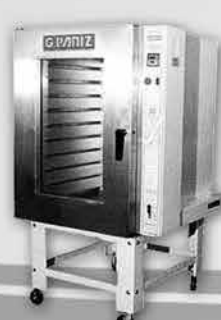
Forno Turbo a Gás