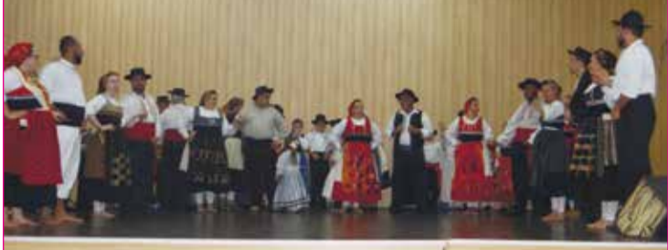
Grupo Folclórico da Casa de Brunhosinho durante sua atuação.