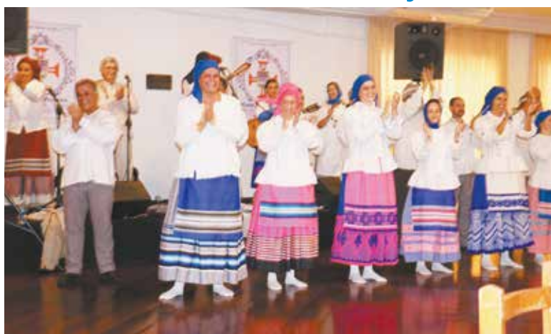
Bonita apresentação do G.F. Passos de Bruma, da Ilha de São Miguel, no domingo passado, na Casa dos Açores do Rio, muito aplaudido