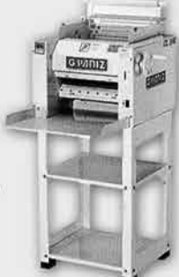
Cilindro Sovador Laminador