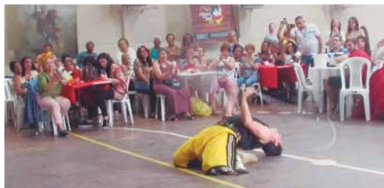
Aspecto do público, durante a apresentação do artista Paulo Nogueira - "El Boleador", num momento de grande estilo