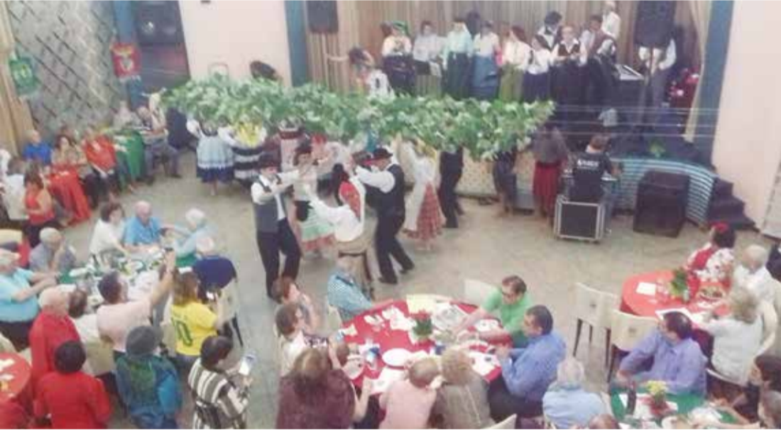
Outro belo momento do brilhante show do R.F. Benvinda Maria, mais uma vez empolgando o público presente nas vindimas na Casa das Beiras

No passado dia 14, a Casa das Beiras realizou a maior festa agrícola de Portugal que são as Vindimas. Depois de um delicioso almoço com churrasco completo, arroz de bacalhau, sardinha portuguesa assada, surgiu no salão o Rancho Folclórico Benvinda Maria que realizou as Vindimas, como em Portugal apresentando uma ramada com grandes cachos de uvas. A casa estava lotada. Foi uma tarde de muita confraternização entre o público presente. Os brasileiros que vieram pela primeira vez, saíram encantados com a bela apresentação do Rancho Folclórico Benvinda Maria, com suas danças e cantares. Depois da colheita as uvas foram distribuídas aos presentes. Foram só aplausos! A Banda Típicos da Beira não deixou ninguém ficar parado. Também foi realizado o tradicional bingo familiar com excelentes prêmios, leilão de produtos portugueses e, para fechar a tarde, vinho doce das Vindimas. A diretoria da Casa das Beiras agradeceu a todos que estiveram presentes nesta festa típica.