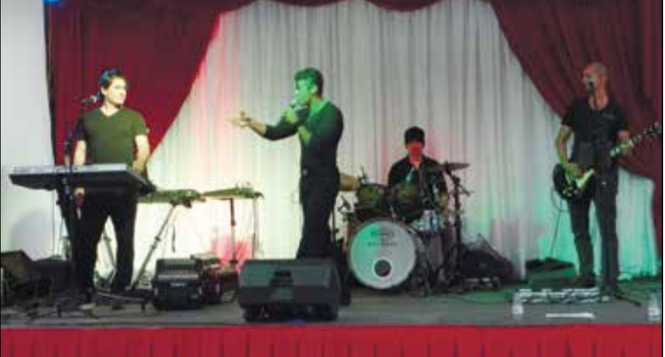
Banda Alma Lusíada que muito agradou neste dia.