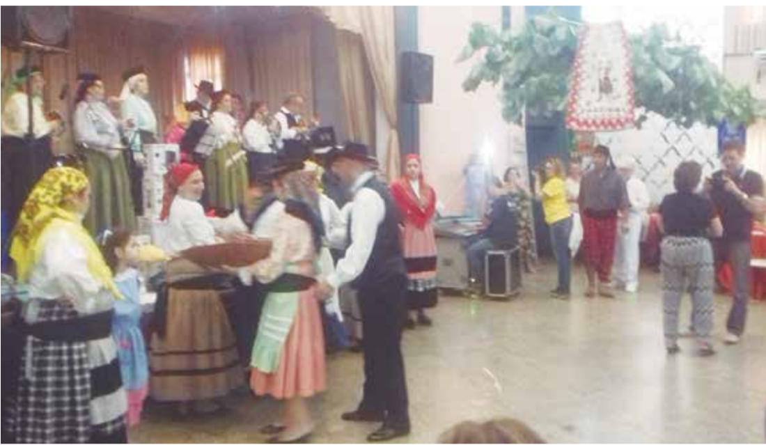
Uma das tradições mais bela de Portugal sem dúvida são as Vindimas, que nos dão cada vez mais a certeza que nossa cultura têm que ser sempre divulgada para os jovens sentirem o amor a terra dos seus familiares