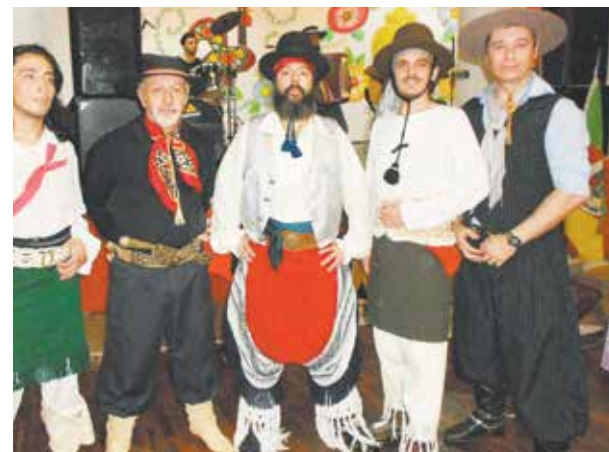
Os guapos, peões, dançarinos que mostraram a força da cultura do Rio Grande do Sul

cer as tradições do Rio Grande do Sul, outros para levar as crianças a se divertirem na cama elástica. Além da culinária que já é muito conhecida, a "Costelada Gaúcha" e os gaúchos seguem à risca a originalidade do folclore. Os trajes de época são cuidadosamente elaborados pelo departamento responsável. Neste domingo passado, a temperatura um pouco mais baixa, ajudou a criar o clima para um "chimarrão" e um "bailão" após o almoço, transformando assim a festa, em mais um sucesso absoluto da Casa do Minho.