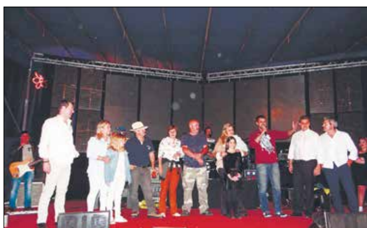
Na noite de domingo os mordomos deste ano fazendo os agradecimentos.