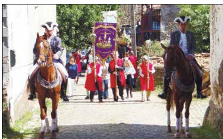
Abrindo alas para a procissão vemos os cavaleiros da Herdade Herdeiro.