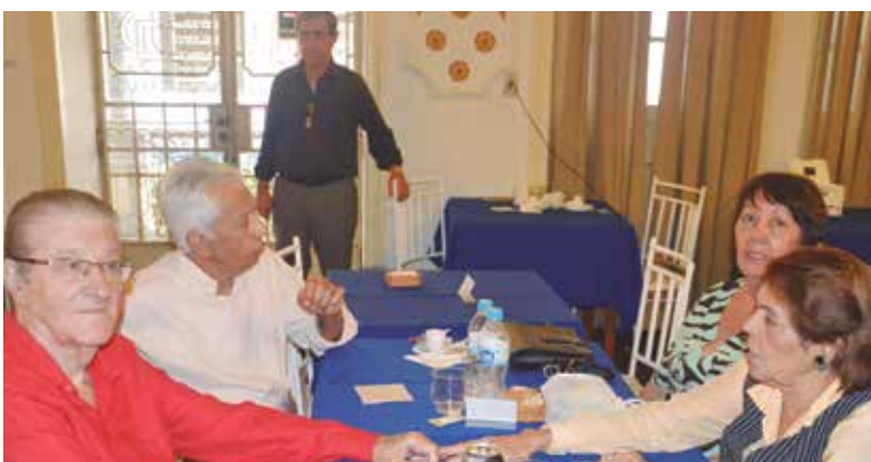
Grupo de amigos, num bate papo informal, no convívio social feirense, frequentadores dos bons eventos