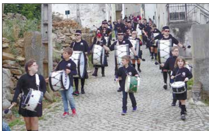
A chegada do Grupo de Bombos US BAT N'PELLE de Alfândega da Fé.