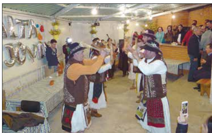
Momento da apresentação dos Pauliteiros de Sausseles.