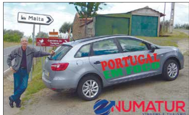
O jornal PORTUGAL EM FOCO nesta viagem a Portugal contou com o apoio da NUMATUR TURISMO.