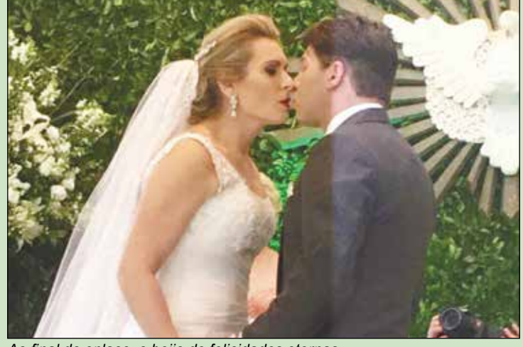
Ao final do enlace, o beijo de felicidades eternas.