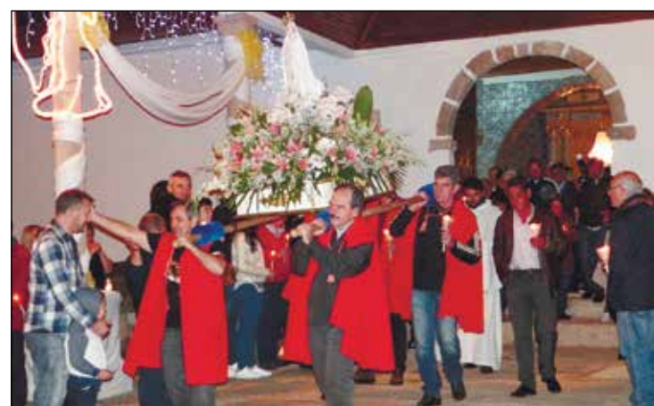
Momentos da Procissão das Velas.