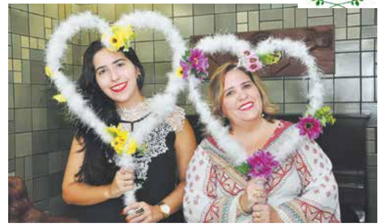
Belissimo momento com as mães posando para as fotos com os corações, estravazando felicidade

Finalizando a tarde, foi realizado um momento de fé com oração homenageando Nossa Senhora de Fátima a "Mãe das Mães"