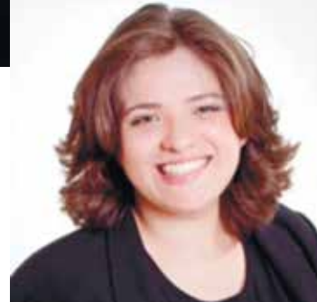
Por: Heloisa Zambianco Publicitária, Gerente e Consultora de Marketing Digital. Para conteúdos gratuitos e relevantes sobre Planejamento, Redes Sociais, Google, Conteúdo e Engajamento.

como se fosse um Wikipedia de papel. Digitar? Que nada! O desafio era escrever uma folha de almaço completa e entregar no outro dia. Enfim, em meio a tanta facilidade tecnológica, às vezes me pergunto se não estamos perdendo nossas habilidades naturais de interpretar, ter opinião sem necessitar fazer o outro concordar e conseguir desconectar para estar presente. Inclusive acredito que muitas vezes, esse é o motivo pra tanto ódio gratuito na internet. Fica a reflexão e o desafio! Te convido a prestar mais atenção nisso tudo, comigo.