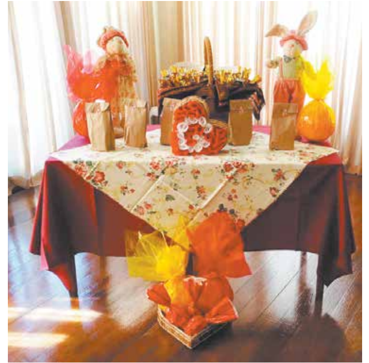
Amêndoas e prendas na mesa da Páscoa Poveira

A tarde festiva iniciou-se às 12:30hs e foi servido o tradicional e saboroso Cozido, sempre muito elogiado por todos os presentes. O Conjunto Trio Josevaldo, um dos grupos destaques da nossa comunidade,