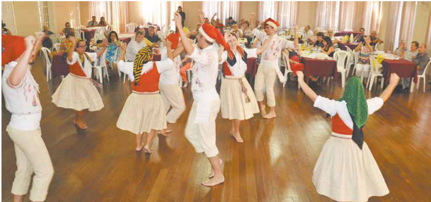
Belíssima apresentação do Rancho Folclórico Eça de Queirós

O dia se encerrou com o tradicional Beija-Cruz. E logo após, foi servido um Porto de Honra acompanhado do Pão-de-ló poveiro. Uma belíssima festa de fé, alegria, paz e tradições para todos os poveiros de sangue e coração.