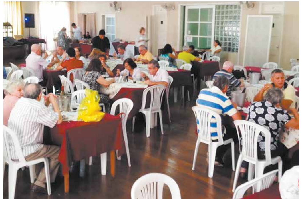
Famílias poveiras comemorando a Páscoa