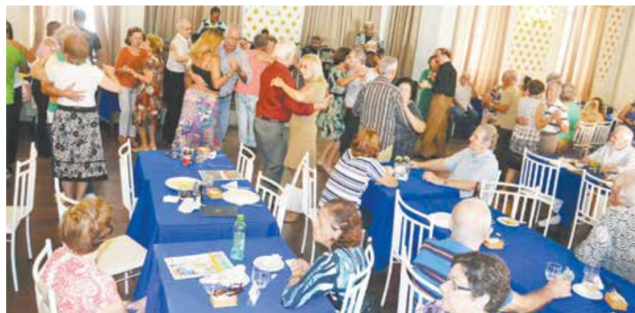
Aspecto do Salão Social Feirense, bem movimentado com os casais “riscando” o salão ao toque musical do Conjunto Som e Vozes

gistrada da Casa, além de deliciosos vinho nacionais e portugueses de ótima