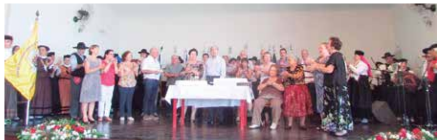
Momentos do "Parabéns a Você" com a presença de diretores, amigos e ilustres convidados, em comemoração aos 38 anos do Arouca São Paulo Clube.