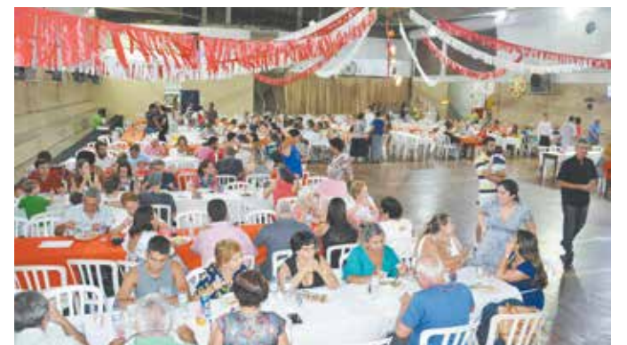
Arraial Minhoto já é ponto turístico do Rio de Janeiro, que não se deve perder

O tradicional Arraial Minhoto - Quinta de Santoinho é verdadeiramente, um espaço de tradições portuguesas "transbordantes", onde associados e frequentadores podem passar horas e horas cultuando a saudade do querido Portugal, em especial da terrinha distante.