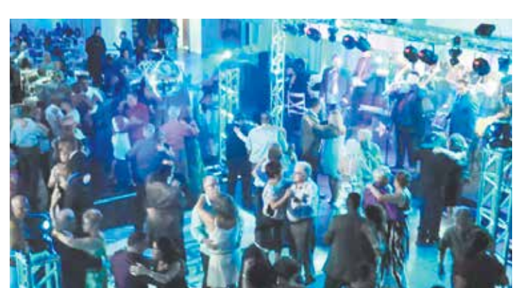
Panorâmica do Clube Português de Niterói totalmente lotado com convidados e amigos dançando ao som da Big Banda Tupy