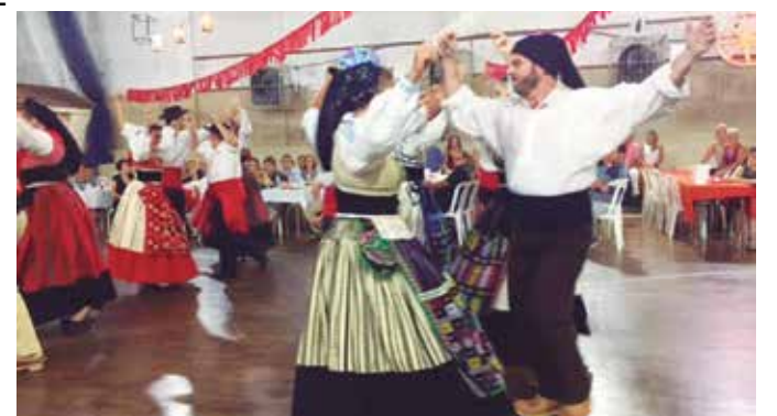
O Rancho Folclórico Maria da Fonte, sempre encantando na quinta de Santoinho, "Vale à Pena ver de novo"