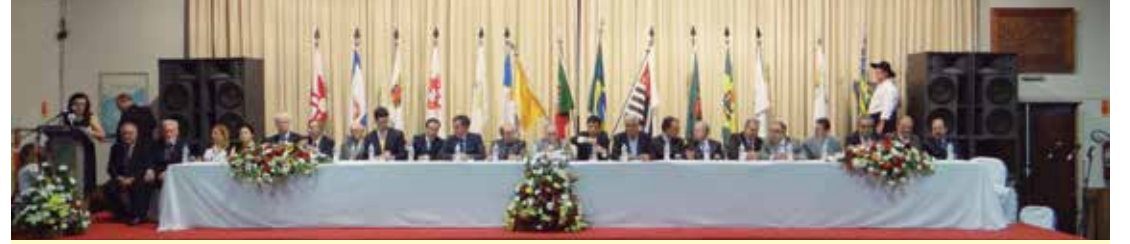
Composição da bellissima mesa de honra do Arouca.