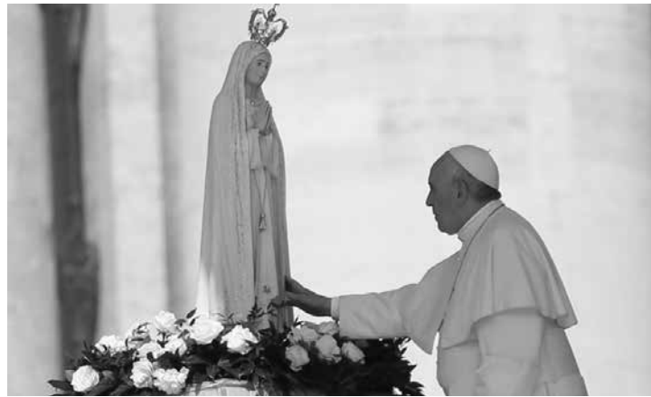
A página inclui igualmente informações úteis de como chegar a Fátima durante a peregrinação de 12 e 13 de maio,

O site www.papa2017.fatima.pt tem como imagem dominante uma foto de Francisco e uma frase de agradecimento: "Obrigado Papa Francisco por ter dito 'sim' há quatro anos. Esperamo-lo em Fátima, em maio."