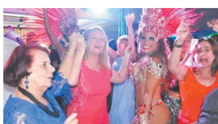
A primeira dama Dr.ª Rosa Guedes era só empolgação no final da comemoração de aniversário do CPN