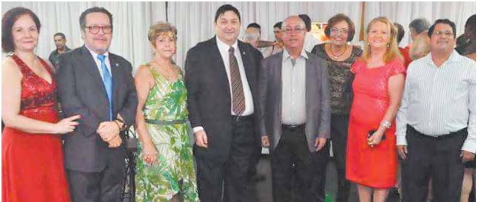
Belíssima imagem da diretoria do Clube Português de Niterói no baile do 57º aniversário de fundação do Clube